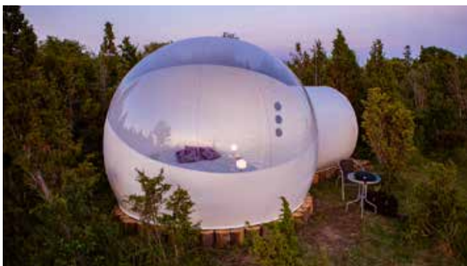
Kadakate vahele maandunud Mullihotell