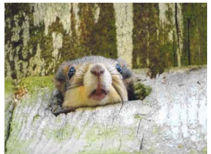
Koduvalla loodusfoto

11.00 armulaud Nissi kirikus 12.00 jumalateenistus Nissi kalmistul Võimalik mälestada lahkunuid, teha liikmeannetusi Buss väljub: 10.10 Kivitammi 10.15 Turba 10.20 Lehetu 10.30 Nurme buss viib tagasi peale jumalateenistuse lõppu