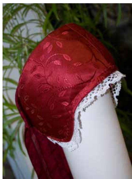
Üks õpitoas valminud pottmütsidest.