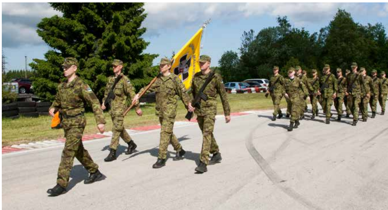
Kaitseliidu Männiku malevkond Harju maakaitsepäeval Tabasalus.

On selge, et omavalitsuse jõupingutused informeerida ja kaasata kodanikke avalikku ellu tugevdavad demokraatiat. Kodaniku huvi oma kogukonna vastu on aga aluseks tugeva ja targa kogukonna tekkele ja selline kogukond aitab tulevikus lahendada nii mõnegi probleemi. ■