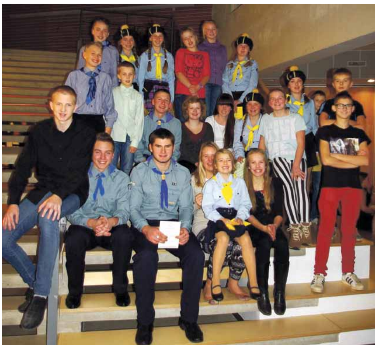
Ootame teid! Turba ja Nissi rühma liikmed peale piduliku koondust Kurtnas 30.11.2013