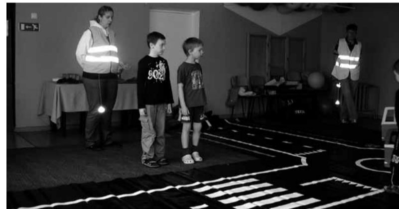
Ennetusprojektist „Mina oskan!“ Riisipere lasteaias loe lk 6.