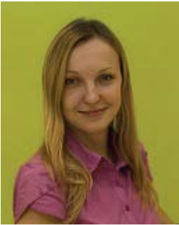
nõustamisega ning seda täiesti tasuta.

Harju Ettevõtlus- ja Arenduskeskus (HEAK) on loodud maakonda just selleks, et olla Harjumaa ettevõtlikule inimesele abiks oma ideede elluviimisel. HEAK tegeleb igapäevaselt nii alustavate kui tegevate ettevõtjate ja kodanikeühenduste