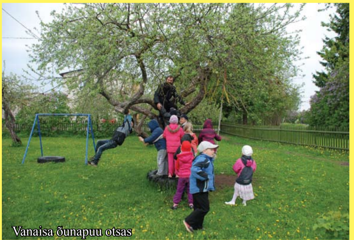
Vanaisa õunapuu otsas