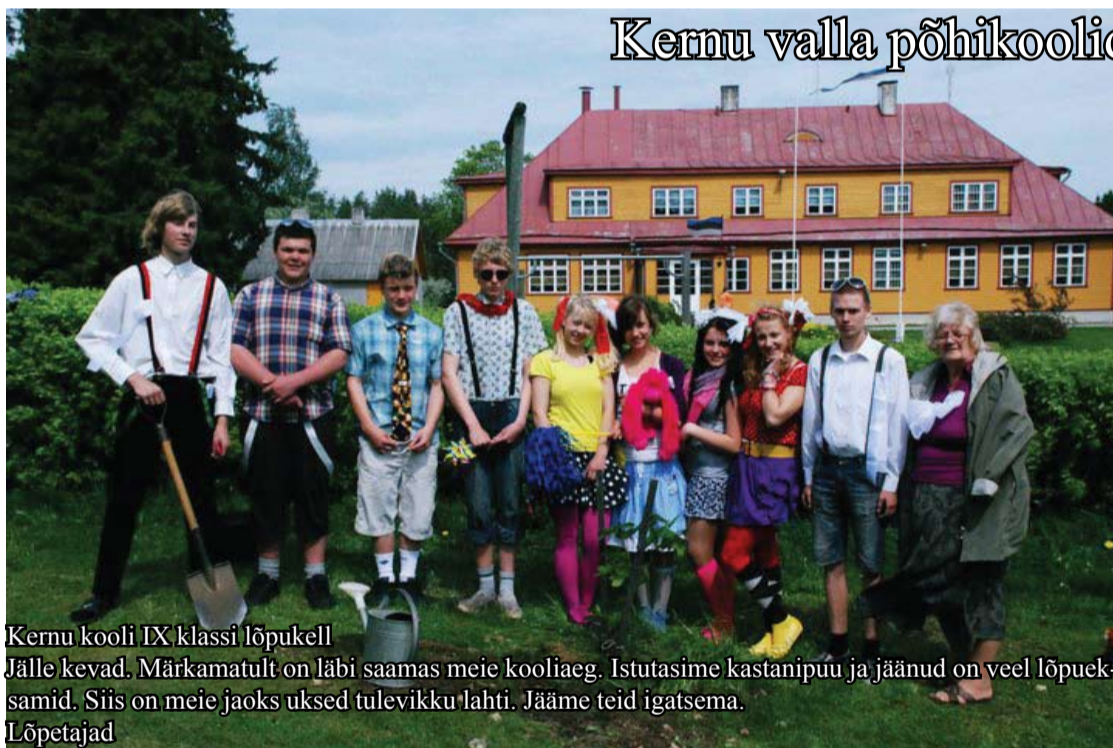
Kernu kooli IX klassi lõpukell

Jälle kevad. Märkamatu on läbi saamas meie kooliaeg. Istutasime kastanipuu ja jäänud on veel lõpukellad. Siis on meie jaoks ukseid tulevikku lahti. Jääme teid igatsema.