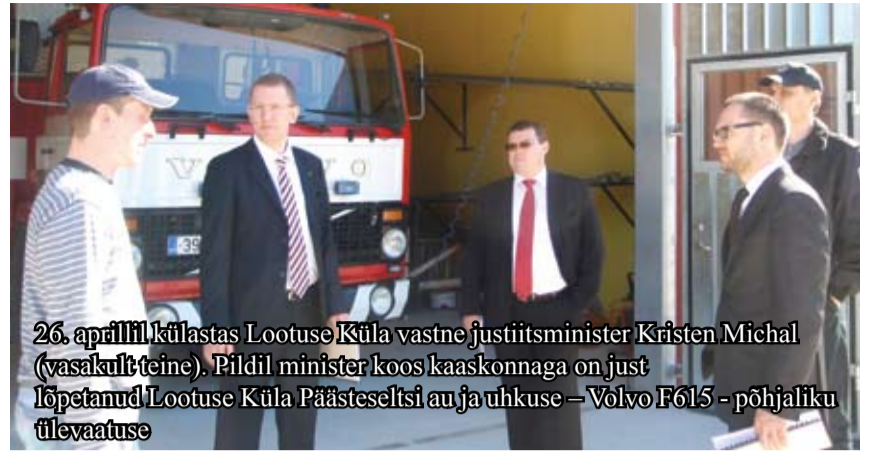
26. aprillil külastas Lootuse Küla vastne justiitsminister Kristen Michal (vasakult teine). Pildil minister koos kaaskonnaga on just lõpetanud Lootuse Küla Päästeseltsi au ja uhkuse – Volvo F615 - põhjaliku ülevaetuse

külastas meid juba teist korda – esimest korda oli ta siin aasta tagasi ja nüüd siis selle aasta märtsis. Pakkusime ministrile ja tema kaasklastele nn täispaketti – õppetunni külastust ning ringkäiku meeste elupaikadesse, puidutööstusse, vabatahtliku tuletõrjajate depoo vaatlust jne. Paaritunnise visiidi käigus arutasime Lootuse Küla arenguperspektiive, programmi sisu ja töötulemusi.