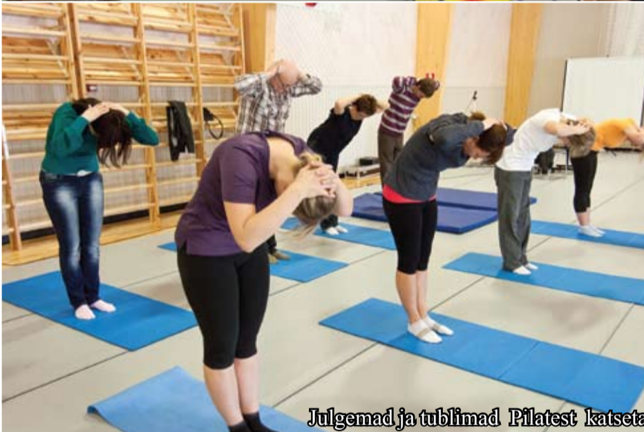
Julgemad ja tublimad Pilatest katsetamas