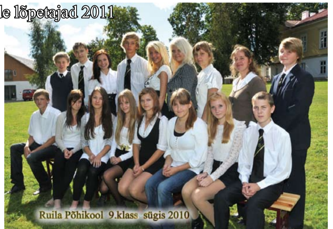
Ruila Põhikool 9.klass sügis 2010