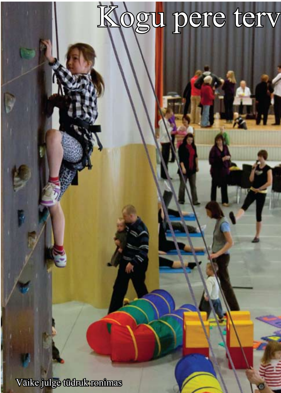
Väike julge tüdruk ronimas