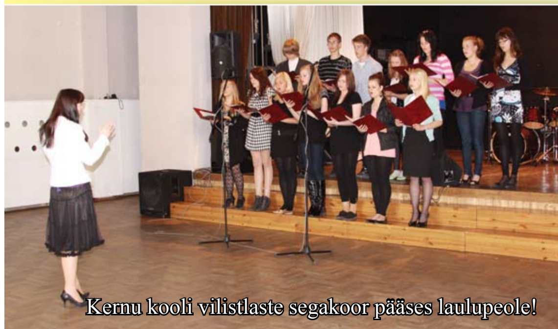
Kernu kooli vilistlaste segakoor pääses laulupeole!