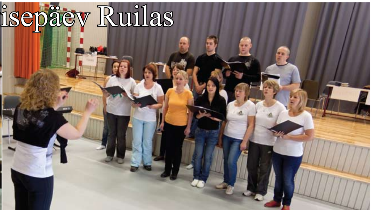
Kernu valla segakoor rahva meelt lahutamas