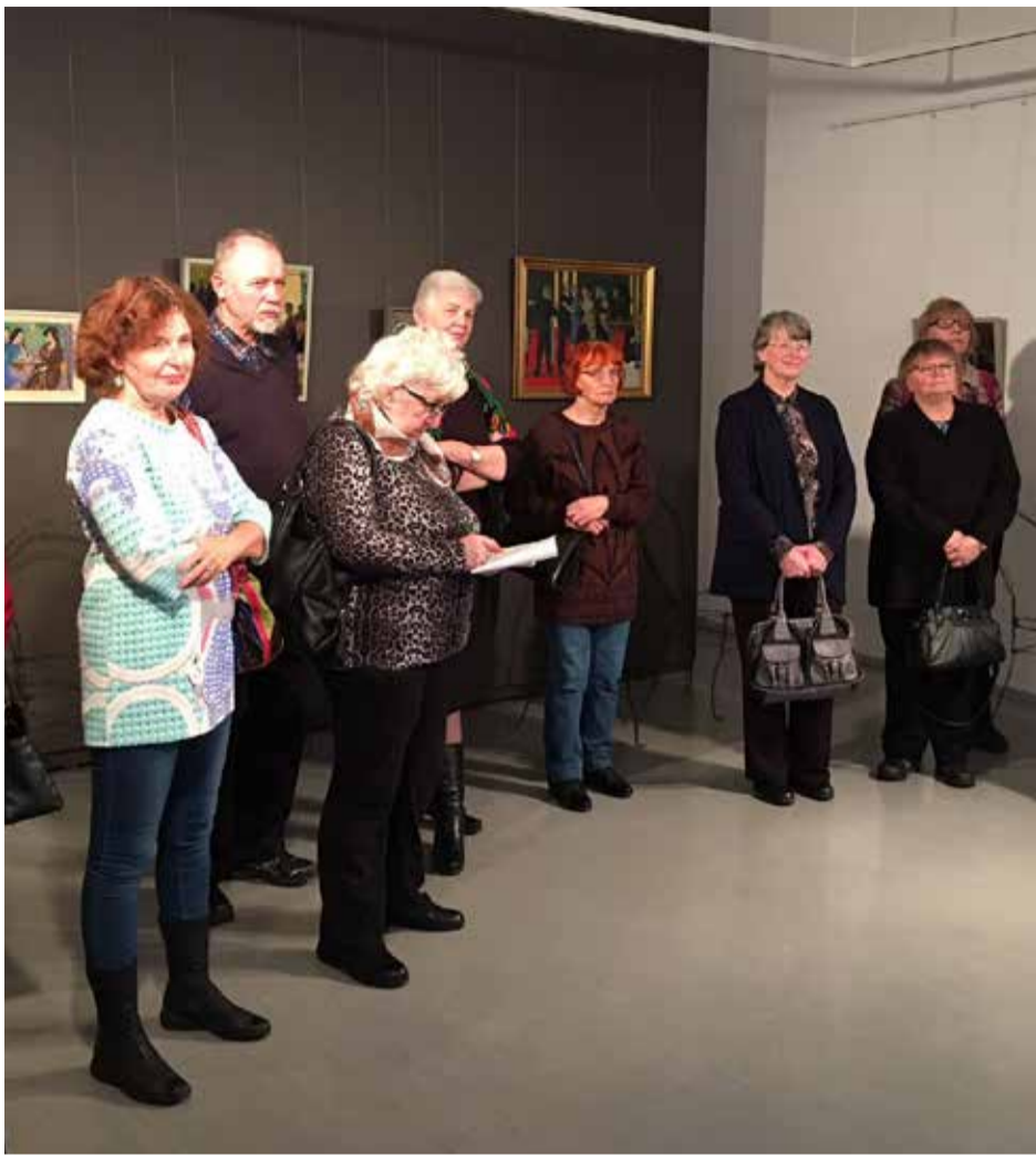
Päevakeskus viis oma tublid abilised tänuks Vilde muuseumi näitusele „Kohvist viidud“.