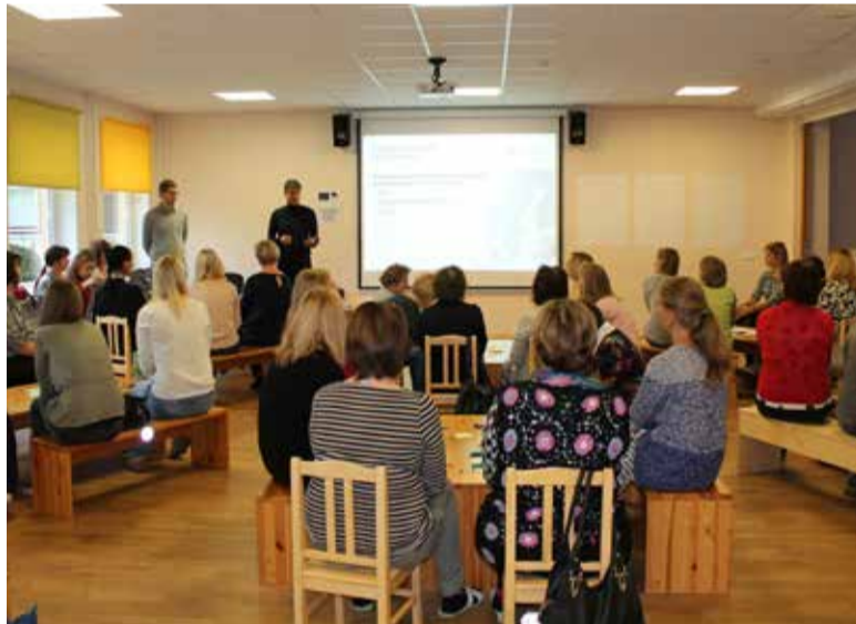
Midrimaa sai Innove Euroopa Sotsiaalfondi meetmest rahastatavale arendusprojektile, et luua uuenevat õpikäsitus toetav organisatsioonikultuur, ligi 10 000 eurot. Fotol tegeleb lasteaia meeskond ühiste väärtuste sõnastamisega.

Mööduvat aastat lasteaias ilmestasi PRIA kooliköögil ja –puuviljaprojekt kahele vanemale vanuserühmale, Rāpina Aianduskooli taimepro-