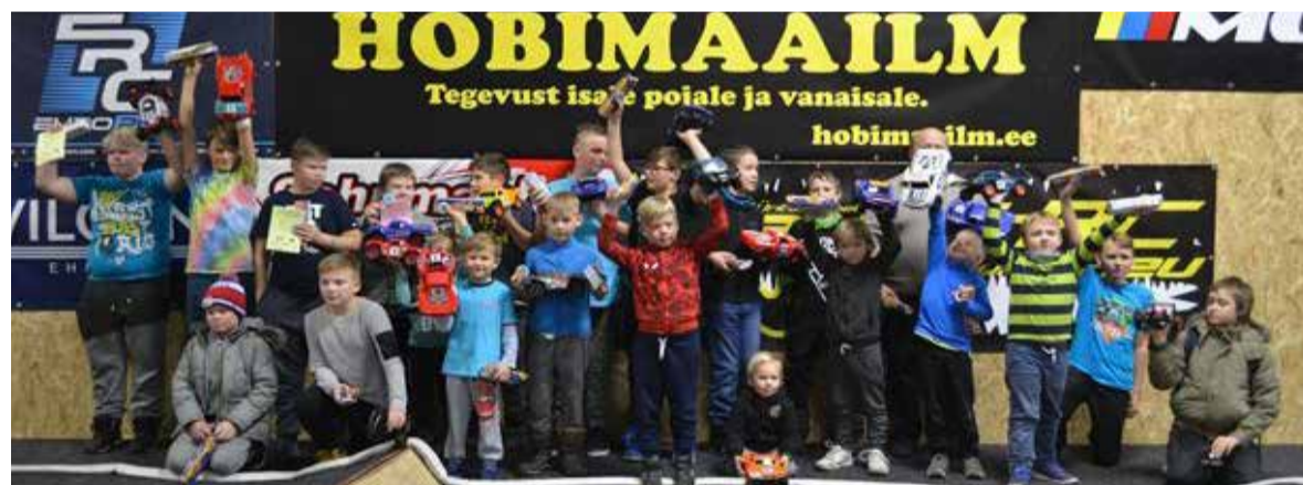
Juuniorliiga osalejad Eesti meistrivõistluste 3. etapil Väike-Maarja mudelihallis.

Kohtumiseni uuel aastal Saue Valduri veergudel. Teie mõtted, info toimuva kohta ja tagasiside on jätkuvalt väga teretulnud.