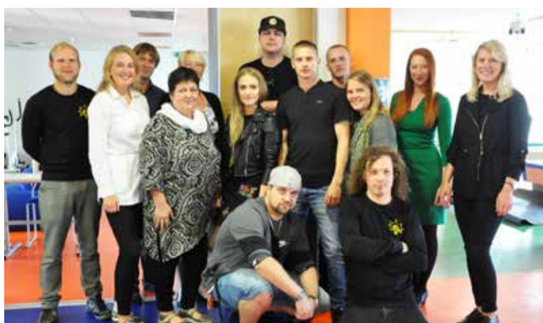
Saue Noortekeskuse pere.

◇ 22. septembril kell 17 avaneb kõigil 16+ noortel suurepärase võimaluse kohtuda Saue Noortekeskuses kohalike poliitikutega, et arutada noortele olulistel teemadel.