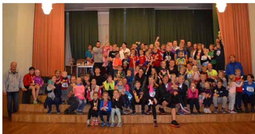
35 perekonda, kes osalesid jooksul täies koosseisus.