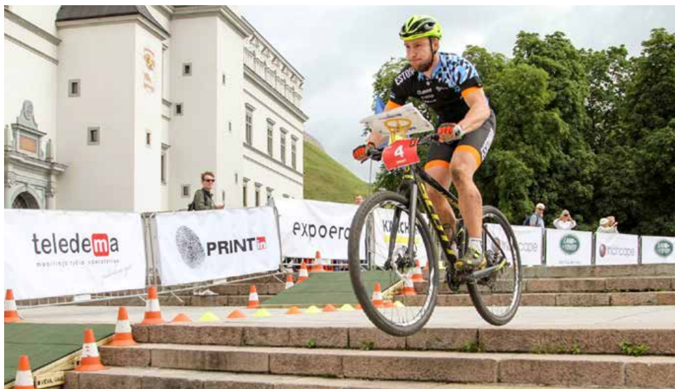
Rattaorienteerumises liigutakse vaid mööda teid ja jalgradu, aga ka treppidel, nagu näha pildil