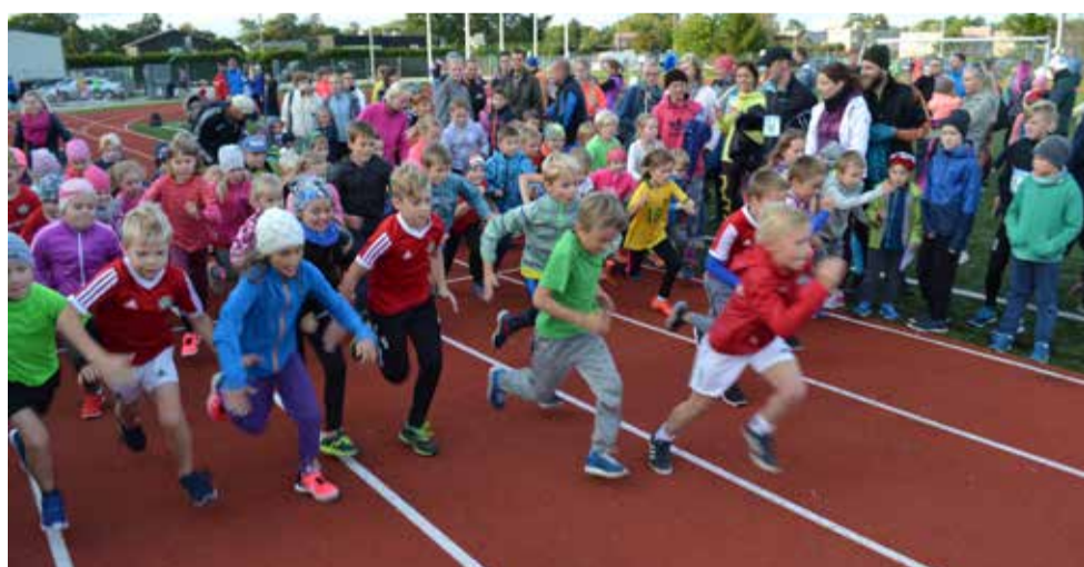
Lastejooksud staadionil, stardivad 7-8-aastased tüdrukud ja poisid

Kohtumiseni sarja „Saue-lane liikuma” orienteerumise etapil 7. oktoobril Saue staadionil algusega kell 12.