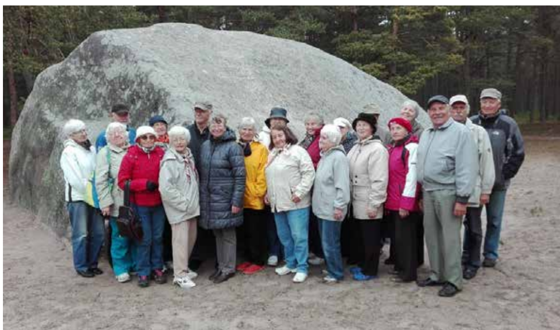
Üks Prangli vaatamisväärsusi on punane kivi saare lõunaosas.

Järgmine peatus oli Läänetsa külas Laurentsiuse kiriku juures. Kiriku alguseks loetakse 1848. aastat, aga pärast uue oreli ja ehituslike uuenduste rakendamist pühit-