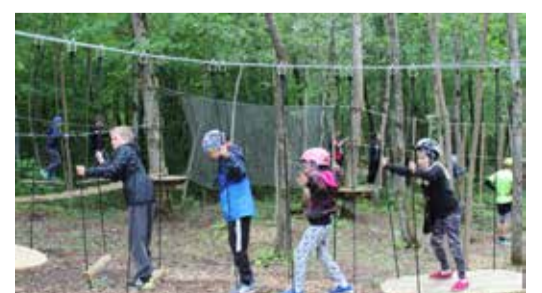
Lastele on lustimiseks redelid, võrk- ja laudsild, püstpalgid, ahviraudtee ja liikuvad platvormid.