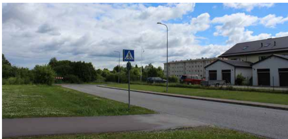
Kuuseheki tänav pikeneb Laagri suunas, sinna kerkib kolmest kolmekorruselisest kortermajast elamukompleks. Esimene on plaanitud valmima 2018. aasta teises pooles.

Saue kinnisvara on Tallinna läheduses asuvate väikelinnade ja alevikega (Keila, Saku, Jüri, Kiili) sisuliselt samas hinnaklassis ning siinsete korterite hinnatase on otseses sõltuuses pealinna üldisest hinnatase, olles alternatiiviks korteri soetamisele Tallinna äärelinna.