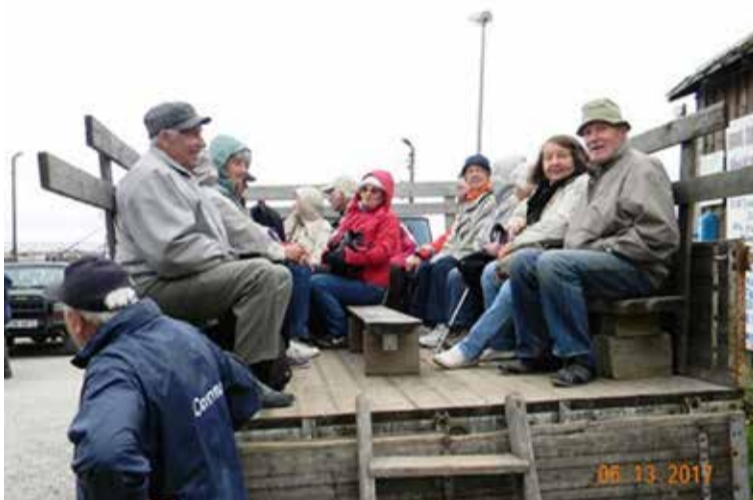
Sauelased Prangli „taksot“ kassis

seti see uuesti 1860. aastal. Mälestuste järgi on kirik ehitatud Soomes, kust see lahtivõetult Pranglile toodi. Tegelikult olnud sel kohal kabel juba varem, selle püstitanud kaks pääsenud merehädalist. Kiriku nimi tuleb sellest, et mehed pääsenud just Laurentsiuse päeval. Ümber kiriku laiub kalmistu - arvatavalt kirikuga üheaegne - ja on kasutusel tänapäevalgi.