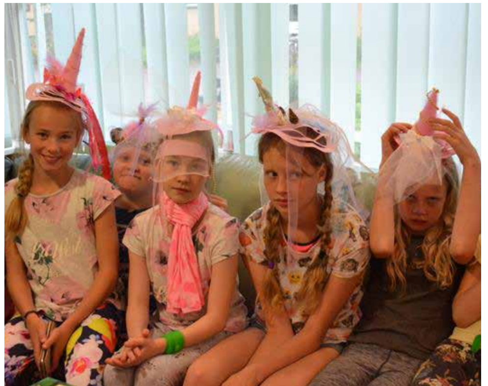
Oi, mis meil peas on!