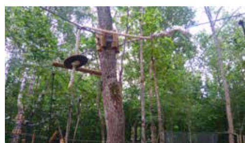
Köitest osad sõlmitud sinna, kuhu vähegi võimalik