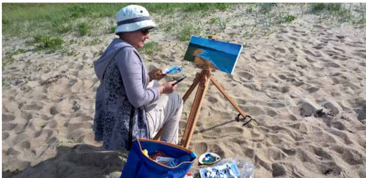
Merevaateid sai maalida päikese ja pilvedega, õhtul ja hommikul.

Ei puudunud ka õhtune jalutuskäik mere äärde päikeseloojangut vaatama. Ilmad olid küll jahedavõitu ja vihmagi rabistas sadada, kuid laagrielu see olu-