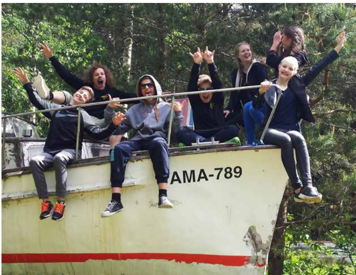
Ööbimisega välisrühm toimetab Lahemaal Pudisoo Puhkemajas, kus tehti erinevaid aia- ja koristustöid

Nagu eelpool mainitud, tähistame me sellel aastal Saue Noorte Töömaleva 20. sünnipäeva. 1. septembril plaanime lõpetada tänavuse töömaleva ja avada 20. hooaja suure peoga Saue Noortekeskuses. Kõik on oodatud!