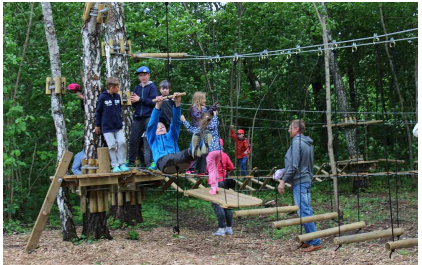
Vali sillad ja atraktsioonid enda oskustest ja võimetest lähtuvalt.

Koht aga on igati sobilik, sest lisaks seiklus- ja discgolfi pargile on jaanituleplatsi ääres rannajalgpalli ja -võrkpalli liivaplatsid ning Sarapiku terviserada.