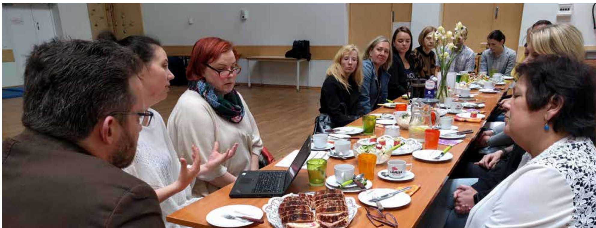
Sisehindajate, välishindajate ja asjassepuutuvate spetsialistide ühisel kohtumisel anti vastastikku tagasisidet tehtavale noorsootööle ja soovitusi edaspidiseks.