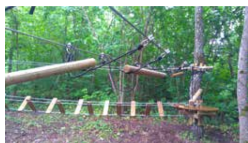
Nõõridel ripuvad atraktsioonide puidust osad olid loobitud mitmeid pidi üle trosside