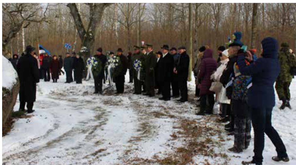
Pärjateremoonia vabakiriku juures.