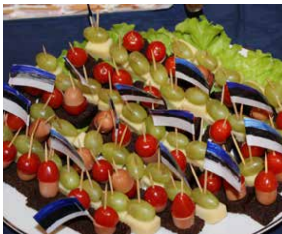
Suupisted valmisid rühmades enne vastuvõttu.