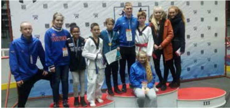
Eesti lahtistelt võitlusspordi mängudelt tuli Saue TKD koju paljude medallitega.

Pärast kõva trenni korealaste olidki käes Eesti lahtised