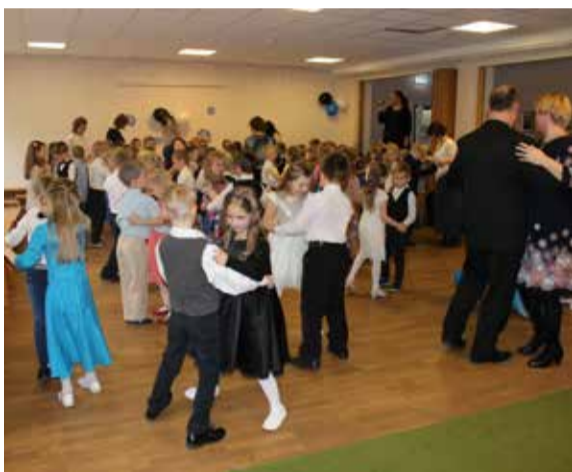
Avavass nagu päris presidendi vastuvõtul