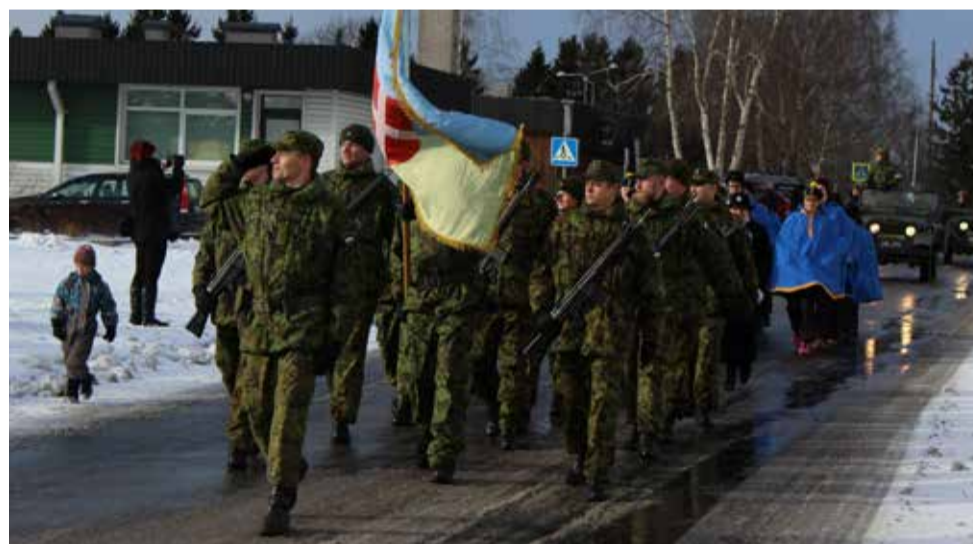
Pidulik jalutuskäik on jõudnud Keskuse parki