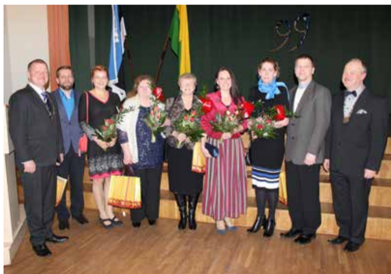
Kauni jõulukodu konkursil tunnustatud volikogu esimehe ja linnapeaga