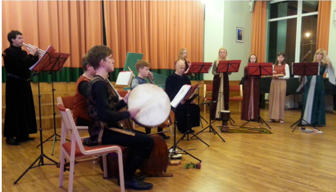
◇ Kiili vanamuusikaansambel on eriline selle poolest, et koos musitseerivad õpilased ja professionaalid.

on eriline selle poolest, et koos musitseerivad õpilased ja professionaalid. Heili Meibaumi juhendamisel on selline kooslus toimunud juba 2003. aastast. Saue kontserdil olid kaaste-