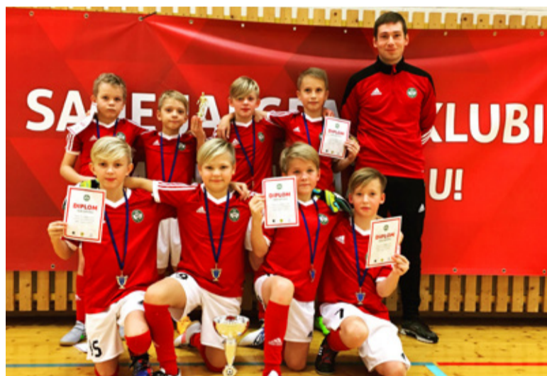
riga väga rahule ja sai palju head tagasisidet teistelt klubidelt.