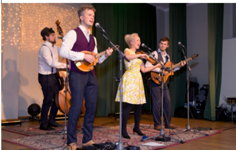
◇ Esineb Curly Strings.