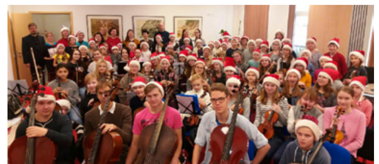
Saue viiulilapsed käisid Rakveres festivalil.

Kontserdil esines ka kaks festivali raames moodustatud projektorkestrit. Viimastest moodustus omakorda koondorkester. Uhkelt jäi festivali lõpetama koondorkestri esituses kõlanud Johan Julius Sibeliusse „Andante Festivo“. Kõikide Saue keelpilliõpilaste ja õpetajate süda on rahul ja meel hea, et esimene poolaasta nii väärrika lõpu sai. Mõnusat jõulukuud!