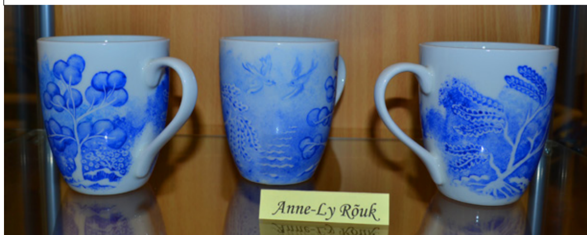
◇ Loomisrõõmu jagasid akvarellimaalijad, keraamikud, portselanimaalijad ja käsitööhuvilised