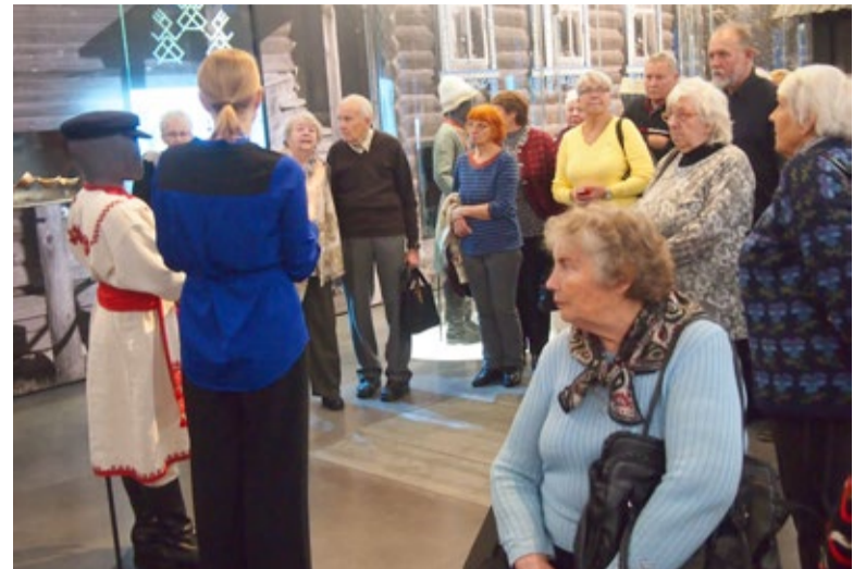
Nädala lõpetas ekskursioon ERM-i.

Viktoriin koosnes 15 küsimusest, mis olid jagatud kolme blokki. Igas viis küsimust, neist kolm kirjalikku ja