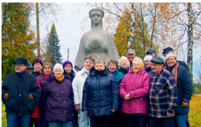
Sauelased Obinitzas Lauulumade nölval, kuhu 1986 püstitati graniidist mälestusmärk kõikidele Seto laulumadele.

Edasi külastasime Piusa liivakopaid, mis tekkisid tänu klaasiliiva kaevandamisele aastatel 1922-1976. Täna on koopad suletud. Avatud on Piusa koobaste külastuskeskus, huvitava arhitektuuriga nahkhi-