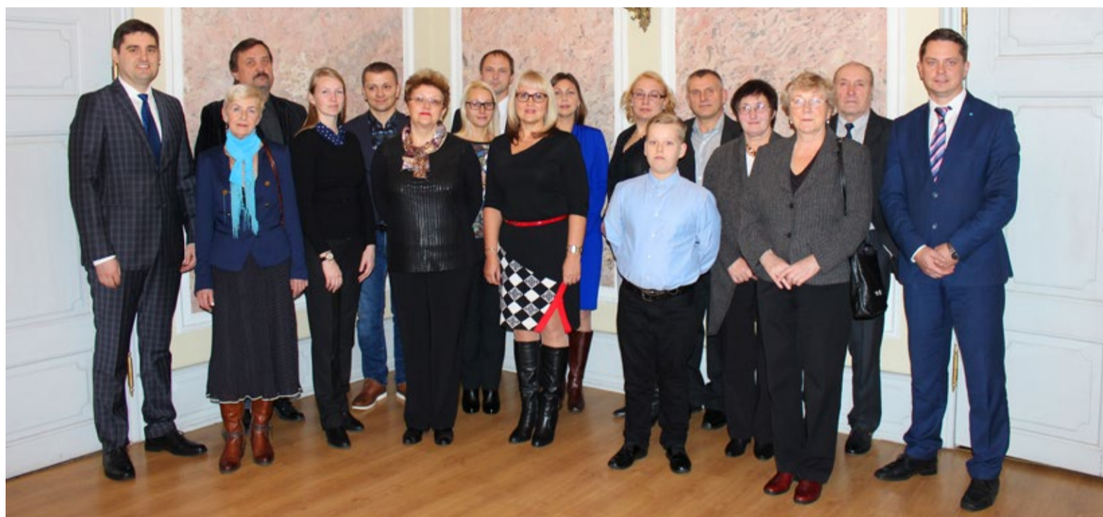
Sauelased armastavad aedadesse ilu luua ja hindavad seda.

Tänavune vastuvõtt leidis aset 9. novembril Saue mõisas ja juba neljandat korda tõstis linn esile ka need inimesed, kes pimedasse jõuluaega, mis viimasel ajal tihtipeale lumeta ja vettinult sünge on, kodu ning aia valgustamisega helgust ja rõõmu toovad.