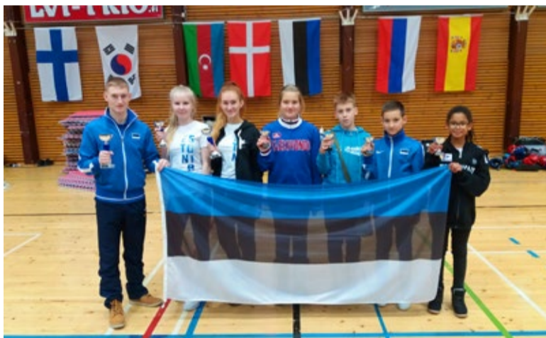
Soomest Vantaast tulid Saue Taekwondoklubi sportlased tagasi korralike tulemustega: neli kulda, kaks hõbedat ja pronks. Pildil koos treeneriga.

4.-5. novembril olid võistlused Jelgavas, osalejaid Valgevenest, Venemaalt, Lätist ja Eestist. Meie lastel õnnestus alati väga tugevate slaavi verd