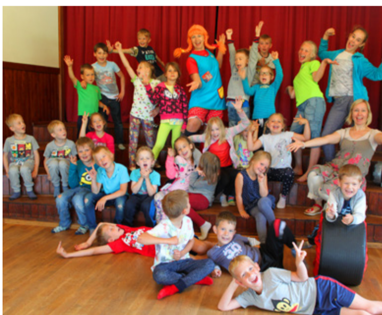
Mängukooli suvelaagrid muutsid Jõgisoo seltsimaja Kurrunurruvutisaareks, kus vahva Pipiga seigelda ja hullata.

Ja mäletada on nii mõndagi: Jõgisoo mõisapargi külastust, vaprat marssimist Metsanurme matkarajal, meremehe kitarri saatel lauldud kõigi lemmikuid Curly Strings'i repertuaarist, ponisõitu Polli loomaaias,