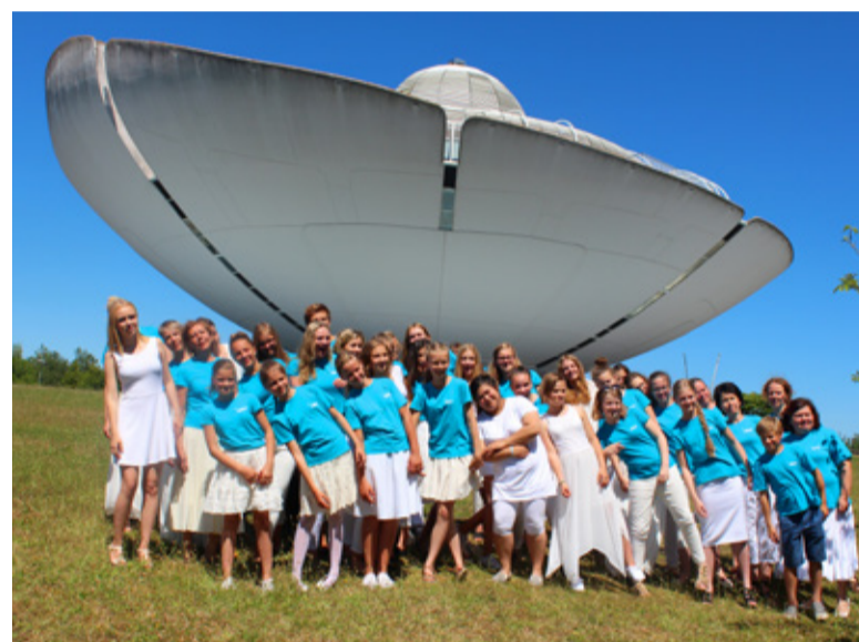
Harjumaa Keelpilliorkester (HKO) osales 8.-18. juulil rahvusvahelisel sümfooniaorkestrite festivalil Prantsusmaal.

Täname kõiki toetajaid ja lapsevanemaid, kes aitasid kaasa ettevalmistavas etapis ning festivalil osalemisel! Augustis ootab orkestrit ees juba kolmepäevane laager, mis alustab ettevalmistust uueks hooajaks.