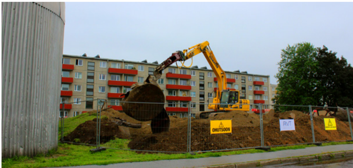
◇ Tule 6a pumpla rekonstrueerimine kaotab linnapildist maapealse plekist kattega veemahuti ja sauelaste seas pumbamäena tundud künka.

Pumpla olemasolev kivihoone saab rekonstrueerimise käigus juurdeehituse endise pumbamäe kohale. Juurdeehitus on mahult väiksem kui teh-