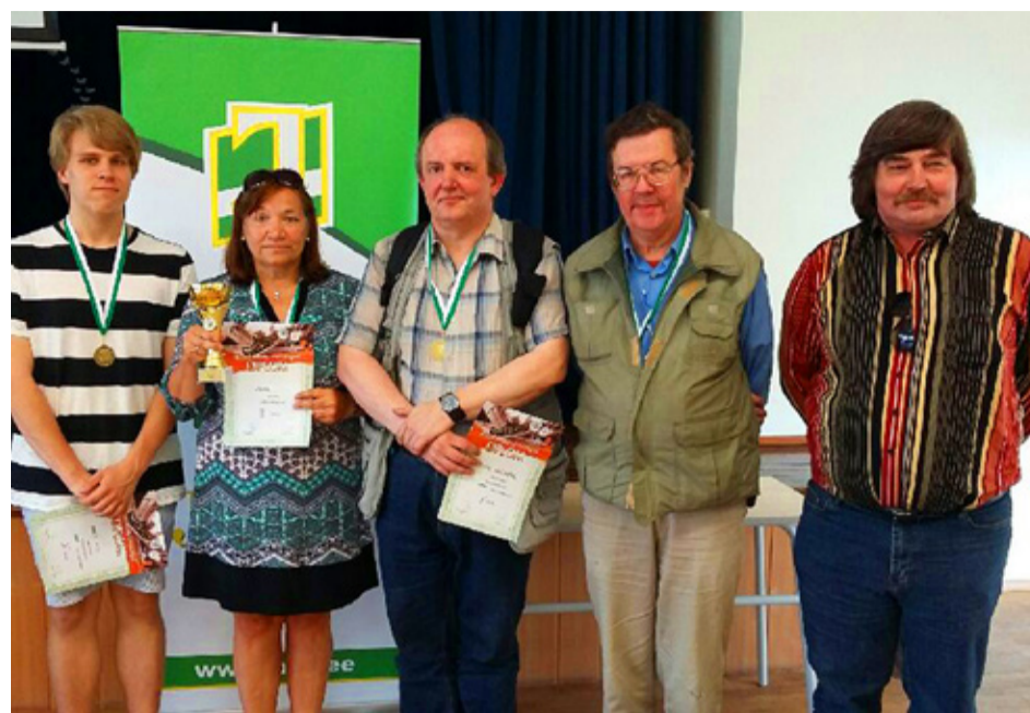
Saue mälumängurid.