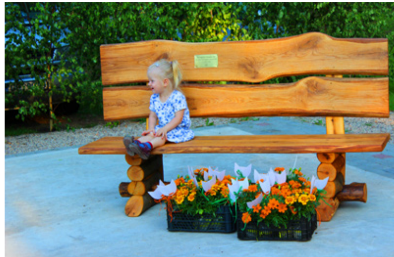
Saue linn kinkis sõpradele pöögi- ja tammepuidust pargipingi.

Tema sõnul paigaldatakse Eestis viimastel aastatel üha sagedamini nimelisi pinke. Nende auks, keda hinnatakse,