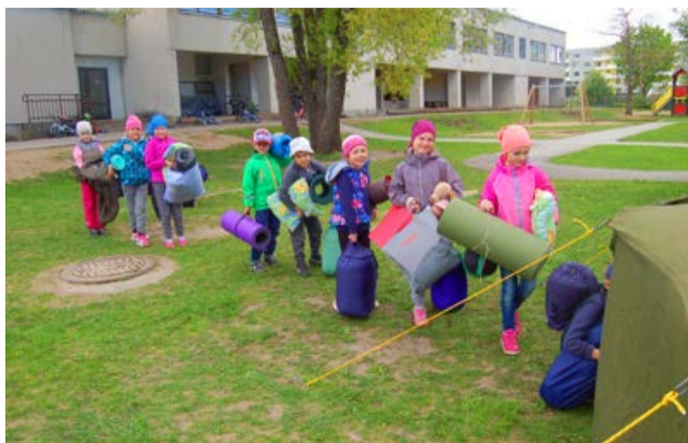
Suurde sõduritelki pugus riburada 19 last ja õpetaja ka.