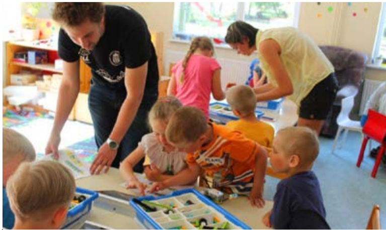
Lotte ja Trollide lapsed unustasid aja ja ruumi, kui hakkasid koostöös rühmakaaslastega Lego WeDo komplekti abil robotit kokku panema ja programmeerima

Kui üle-eestilisel lasteaedade spordipäeval osalemine on Midrimaa lastele juba traditsiooniks saanud, siis sellesse kevadesse mahutus veel tervisenädal 4.-8.aprillil. Lastel valmistatud liikumisteemalistest plakatitest valmis ühistöö, mil-