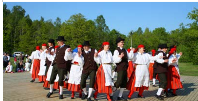
Sõlesegajad, külalised Hiiumaalt