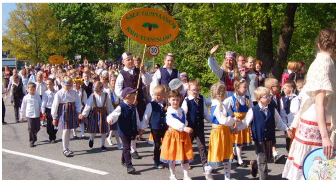
Lõbus rongkäik läbi linna teatas kõigile peo algusest ja kutsus osalema

Suur tänu kõikide kollektiivide juhtidele, peoleajatele ja pealtvaatajatele!