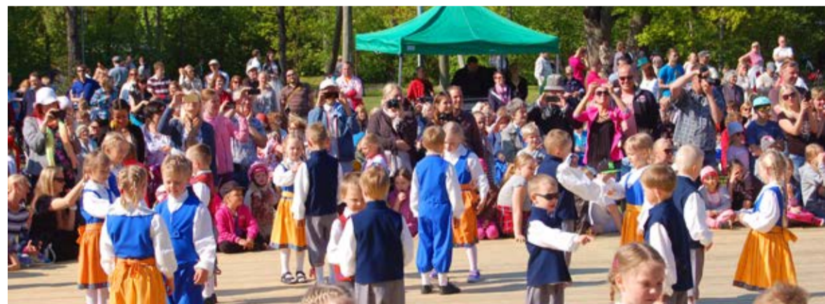
Esineb linna rahvatantsijate järelkasv lasteaiast