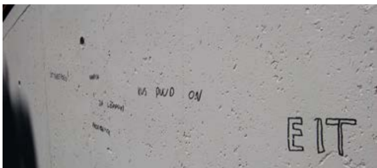
◇ Mai viimasel nädalavahetusel sodisid huligaanid värskelt remonditud laululava seinu

Saue Linnavalitsus palub muudatuse ajal jälgida liiklusmärke ning soovib kannatlikku meelt ja mõistvat suhtumist. Aitäh!