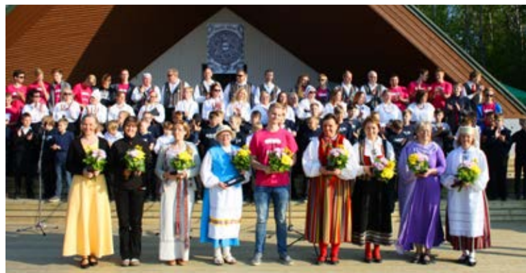
Kord iga pidu saab otsa

Saue Sõna nr 11 (464) 3. juuni 2016 Väljaandja: Saue Linnavalitsus Telefon 6790175, leht@saue.ee Kujundus: loovbüroo Kuldne Lammas Trükk: AS Printall Kojukanne: AS Ekspress Post Järgmine number ilmub 17. juuni