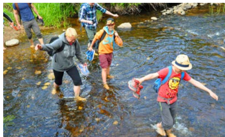
Arvata võib, et veetakistuse ületasid kõik matkajad paljajalu.

Teine motivaator on põhimõtteinadus. Kui ma juba alustasin