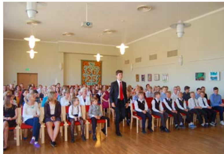
Aktusel esmakordselt viibinule jäi algsest mulje, et oi, kui tore, kui paljud on tulnud parimatele kaasa elama. Ohoo-efekt oli veelgi suurem, kui ta aru sai, et see saali täis ongi tegelikult kõik parimad.