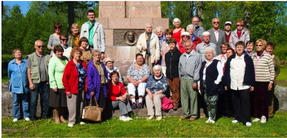
◇ Saue reisiseltskond Konstantin Pätsi monumendi juures Tahkurannas

Läbisime vapralt selle kahe kilomeetri pikkuse matkaraja. Vahepeal puhkasime jalga