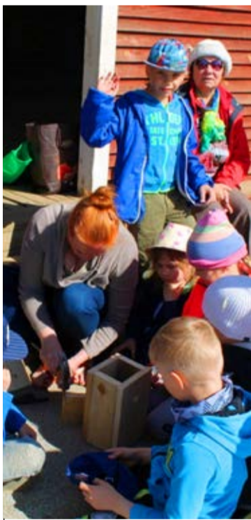
Iga rühm valmistab nädispesakasti

Mõnel rühmal läks pesakasti ülespanekuga aega - nii saavad mõned linnud uue kodu järgmisel kevadel. Programmi esimene osa oli toas