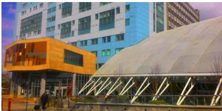
Bradfordi ülikooli peahoone Richmond building .

Oma osa ülikooli valikul mängis ka erialade valikuroh-