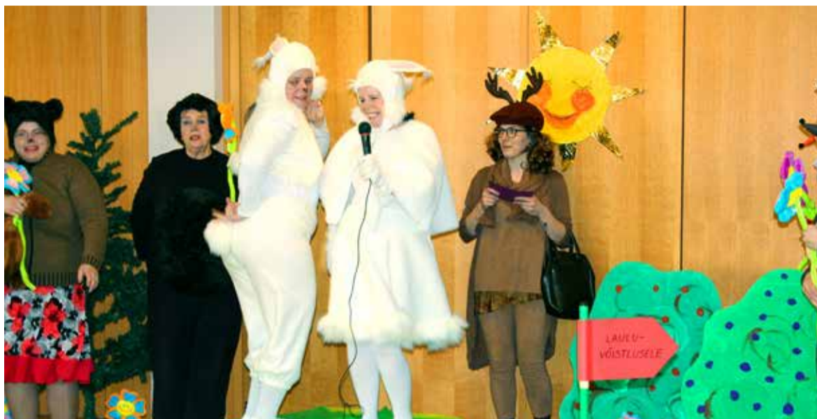
Midrimaa õpetajatest koosnev näiteseltskond astus laste ja töötajate ette lastelavastusega „Metsarahva kevadine lauluvõistlus“.

Etenduse jälgimine annab võimaluse lapse sotsiaalsete oskuste arengu toetamiseks. Nii saab laps harjutada keskendumist, kasutada esmaseid viisakusreegleid ja õppida arvestama teiste inimestega.