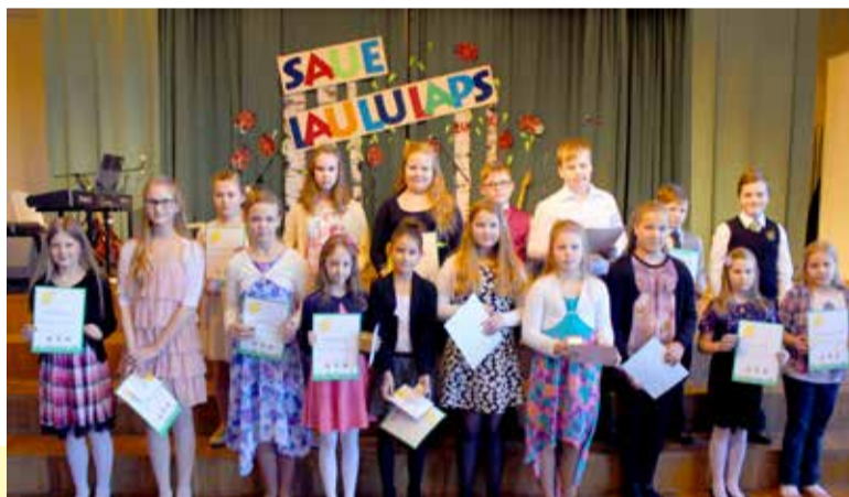
◇ 10-12-aastaste vanuserühm on alati arvukas