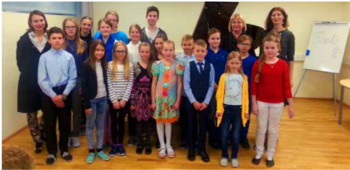
◇ Saue Muusikakooli klaveriosakonna õpilased esitasid kontserdil palasid teemal „Tants“.

laste lemmikud, tuntud muinasjututegelased: krõllid, trolid, baleriinid ja karupojad.