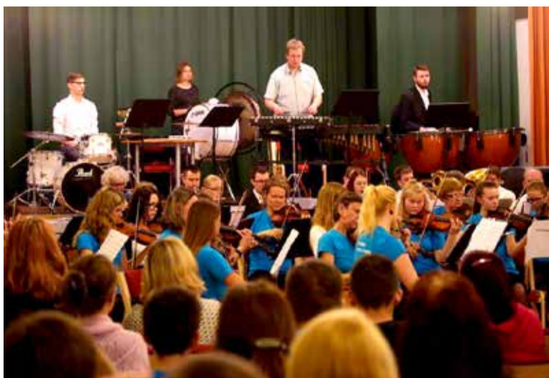
Ühendorkester. Orkestrile kahe timpani ostmist toetas projekt „Igal lapsel oma pill“

palju õpetajaid, dirigente, kes kõikides proovides kaasa mängisid ja noortele eeskujuks olid. Nad on oma ala entusiastid, kelle pühendumine suunab noored muusikamaailma.