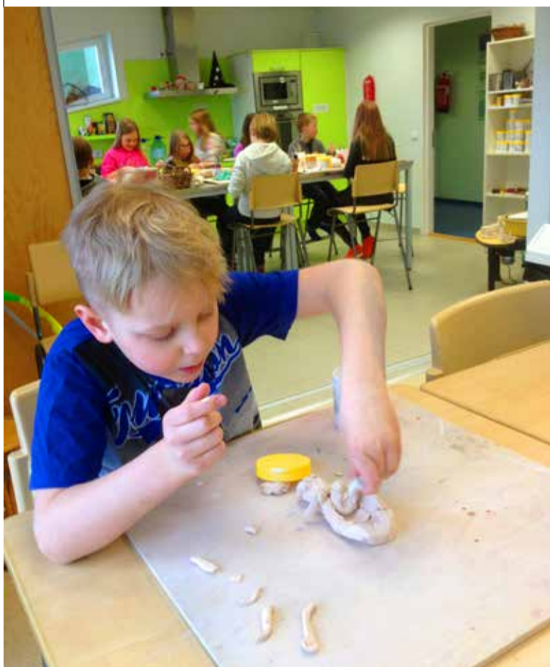
◇ Savi kui väga põneva ja teraapilise materjaliga said tegeleda väga paljud lapsed