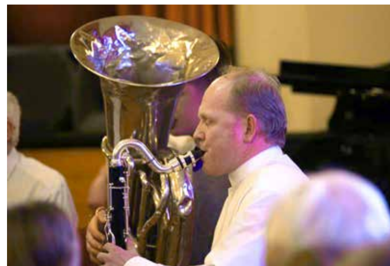
Mõni pill vajab ikka uuendamist, aga rõõm jääb!