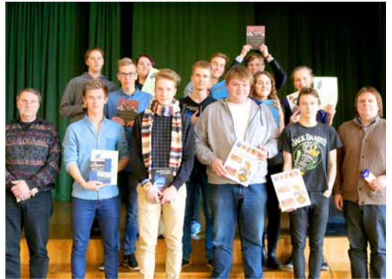
2016. aasta mõttemeistriid.

Harjumaa keskkoolide ja gümnaasiumite vahelist mälumängu „Mõttemeister“ finantseeris Harjumaa Omavalitsuste Liit.