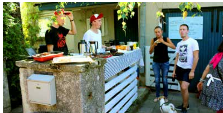
◇ Tõkke põigus tegutsenud kohvik ET Burger on lubanud ukseid taas avada ja plaanib külalistajatele valmistada vähemalt 500 burgerit.

sünnipäev kodukohvikute ja meistrihoovidega aset selgi suvel, pakkudes rõõmu ja hea-