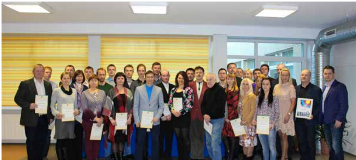
Saue Sporditähed 2015

Saue linn on uhke oma sporditähedele üle!