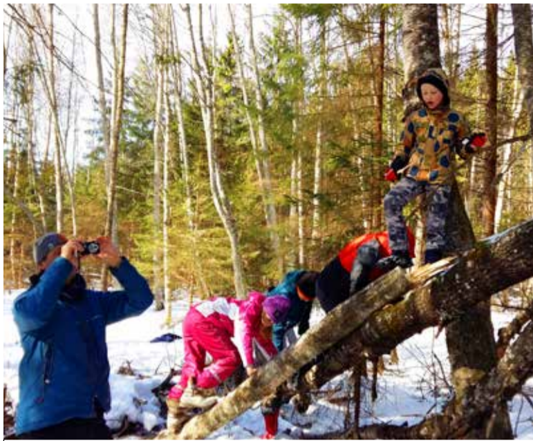
◇ Seikluslikud matkad - projekti üks osa