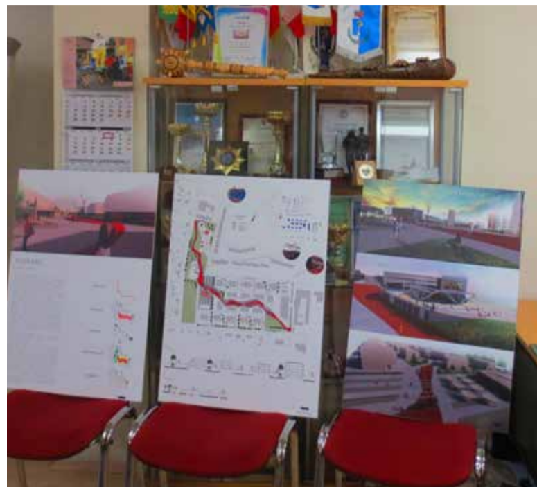
Võistlustöö „Murrang“.