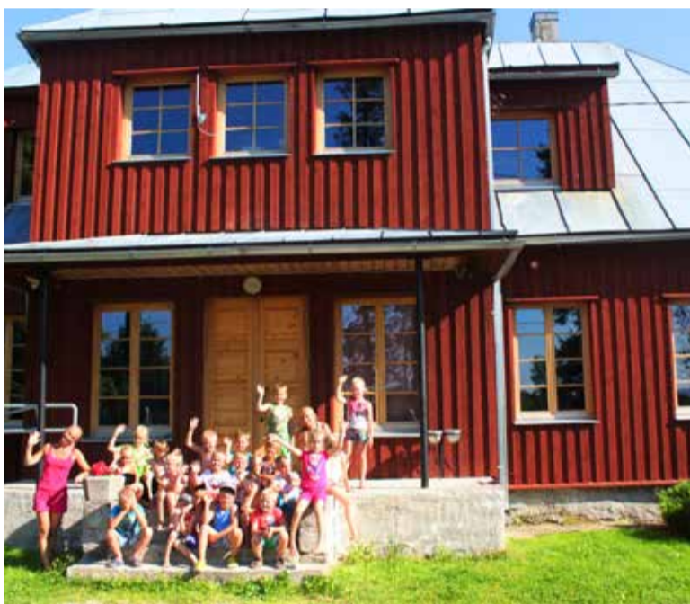
◇ Fotomeenus mõõdunud suve laagrist Jõgisool.

päevalaagritega, mis toimuvad esmaspäevast reedeni. Iga laagrivahetus on viiepäevane. Laagripäev algab hommikul kell 9. Vanemaid ootame lastele järele õhtul kell viis.