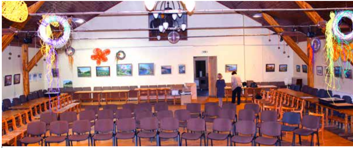
Inčukalnsis rahvamajas on avatud Saue kunstnike maalinäitus, sealsamas annavad linna kollektiivid 16. aprillil kontserdi.

16. aprillil annavad kollektiivid sõprusvallas kaks kontserti. Ühe neist Vangaži kultuurimajas, teise Inčukalnsi rahvamajas. Saue Segakooril on 17. aprillil kontsert Vangaži kirikus.