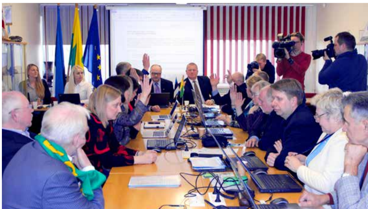
Saue Linnavolikogus hääletas ühinemise poolt 10 ja vastu oli seitse volinikku

Saue Linnavolikogus hääletas ühinemise poolt 10 volinikku ja vastu oli seitse. Kernu vallas pooldasid ühinemist kõik