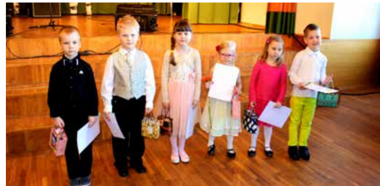
◇ Esikolmik 5-6-aastaste seas