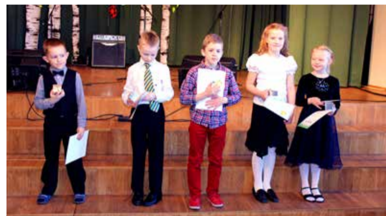
◇ Need lapsed tõstis žürii esile 7-9-aastaste hulgas