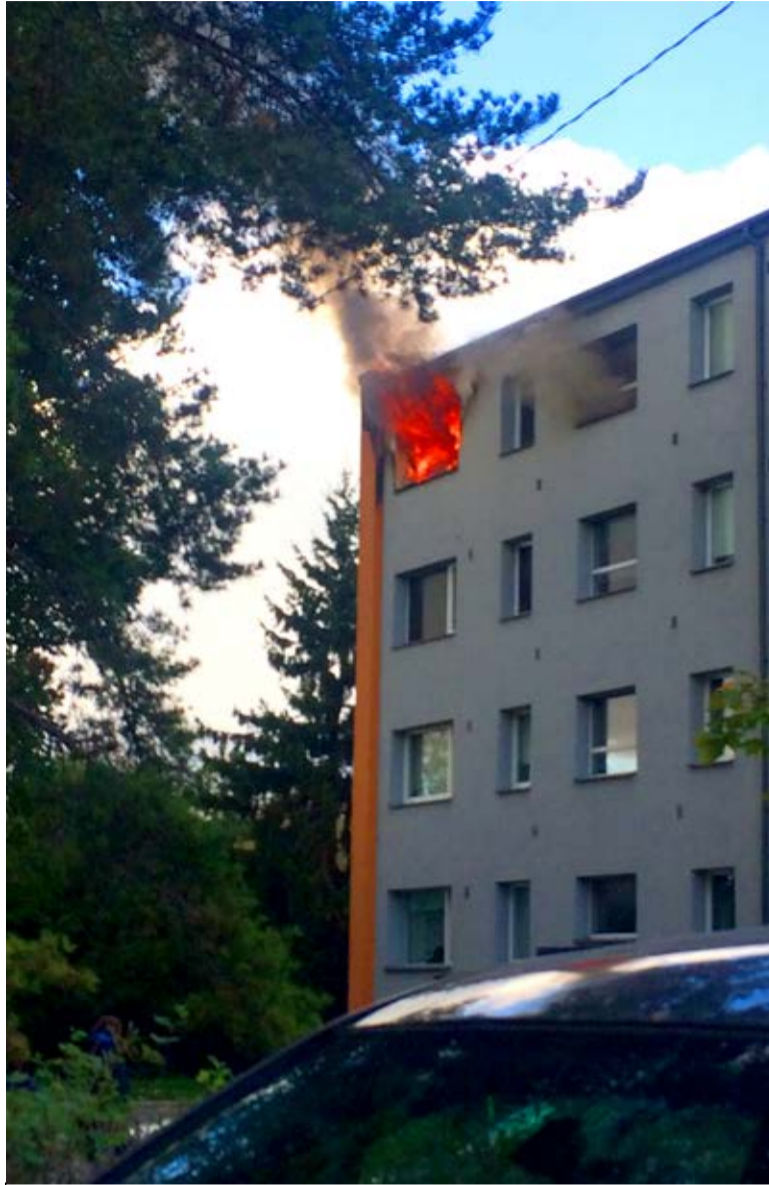
Tulekahju möödunud aasta lõpus Tule tänava korterelamus.

Lisaks maja ühiskasutatavate pindade tuleohutusele, saab palju ära teha ka koduseinte vahel.