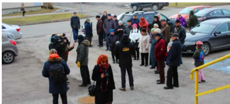
Volikogu istung äratas linnarahva seas huvi