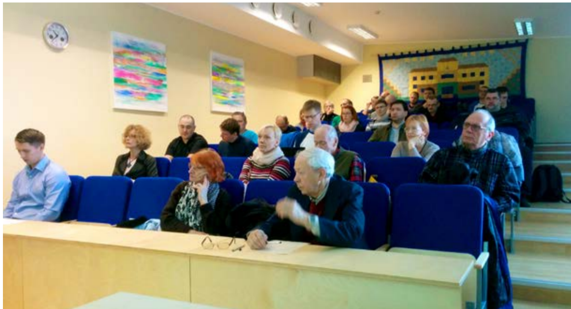
Et tutvustada korteriühistutele korterelamute rekonstrueerimist SA KredEx meetme abil, korraldas Balti Vara Fassaadid OÜ 12. märtsil Saue Gümnaasiumis seminari.

Lisainfo http://kredex.ee/korteriuhistu/korteriuhistu-toetus/rekonstrueerimise-toetus/