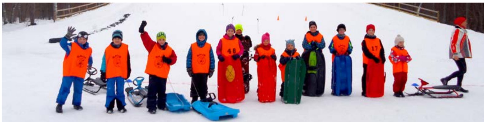
Lapsed vigursõite ootamas

Võistluste lõpuprotokolliga saate tutvuda veebiaadressil www.sauehuvikeskus.ee .