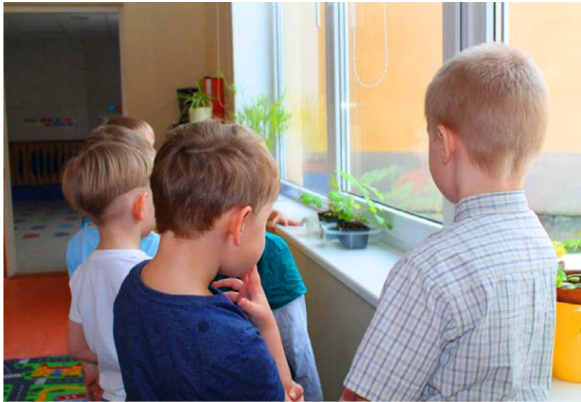
◇ Trollide rühma lapsed hooldavad oma maasikataimede eest suure pühendumisega ja ootavad esimest õit.

nimetatud rühma neli kuumaasika taim - kaks ühest ja kaks teisest sordist: kollaseviljaline `Yellow Cream` ja punaseviljaline `Regina`. Katse algas 22.