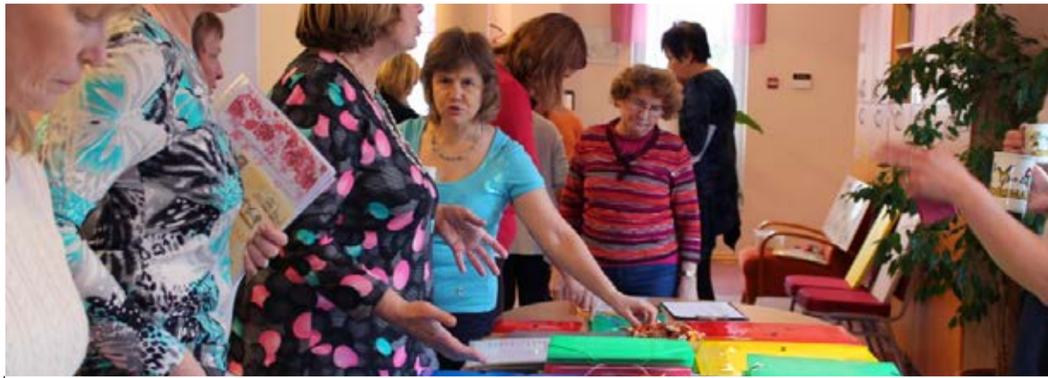
◇ Lasteaia õpetajad tutvuvad töökaaslaste loominguga

Kuna kõikide lasteaia õppegevuses käsitletavate teemade kohta ei ole lihtne leida pildimaterjali Eesti kirjastustelt, on aastate jooksul lasteaiale ostetud ka venekeelseid õppevahendeid,