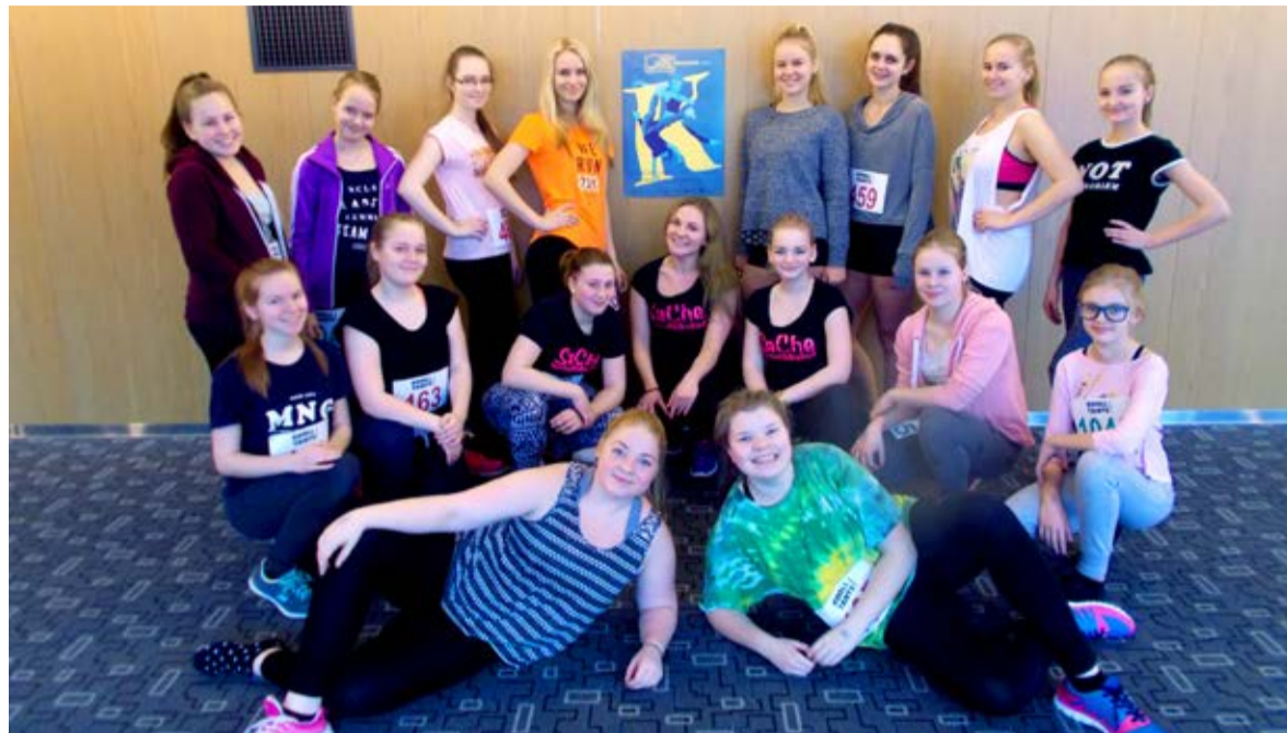
◇ Saue Noortekeskuse show- ja cheerleadingu trupp SaChe Tantsutüdrukud osales ka tänava aktiivselt Koolitantsu festivalil

Hoiame põialt ja täname kõiki tantsijaid olulise panuse andmise eest!