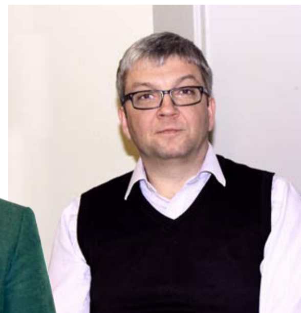
◇ Volikogu aseesimees Meelis Rõigas