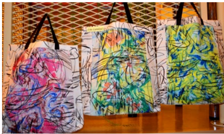
Marmoriseerimise tehnikas dekoreeritud tekstiil.

jooksul tehtust. Selleks aastaks on kursused lõppenud. Ees ootavad pühad ja aastavahetus.