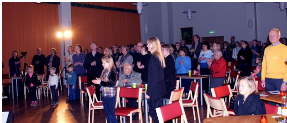
Oli esitusi, mille järel rahvas aplodeeris tormiliselt.

Uute kohtumisteni järgmisel kontserdisügisel.