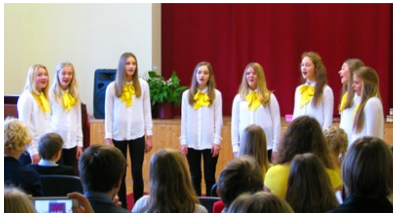
◇ 7. klassi tütarlasteansambel Ritsikad