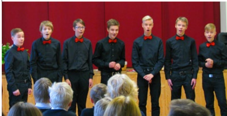
◇ Saue Noorte Meeste Koori ansambel.