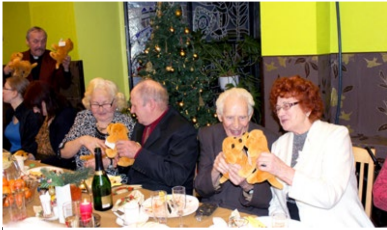
Pisike kingitus, suur rõõm. Iga invaühingu liige sai Saue vabakirikult kingiks mängukoera, mille aga päkapikud invaühingu-poolsesse jõulupakki poetasid, jäägu saladuseks