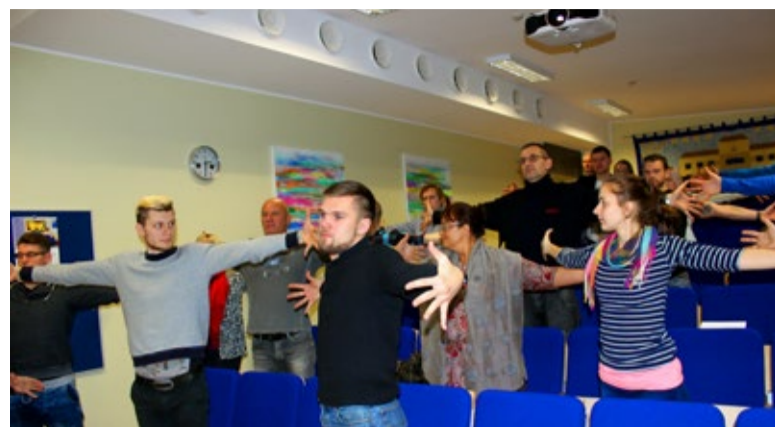
Harjutus istuva eluviisiga inimesele.

See, et meil on selja- ja kaelavalud, diabeet ja depressioon, vereringe häired ja