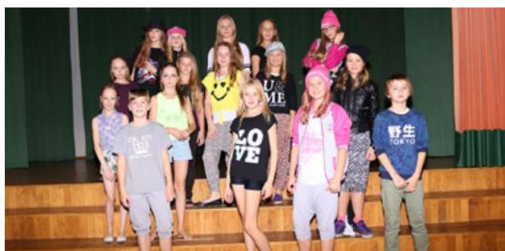
Võitjad 5.c klassist

I koht 5.c klass II koht 5.b klass III koht 5.a klass Parim lavaruumi kasutamise oskus 6.c klass Parim koreograafia 5.a klass Parim artistlikkus 5.c klass Parimad kostüümid 6.a klass