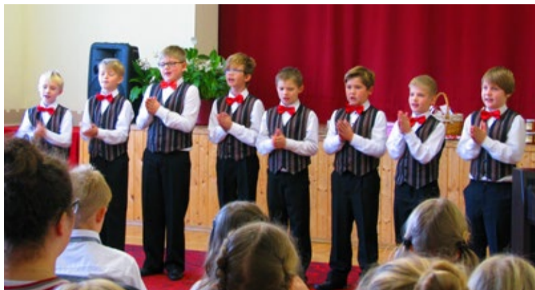
◇ Saue Poistekoori 3. klassi ansambel

6.-7. klassi vanuseastme I koht tuli taas Saue Gümnaasiumi - 7. klassi tütarlasteansamblile Ritsikad. Ansambelis