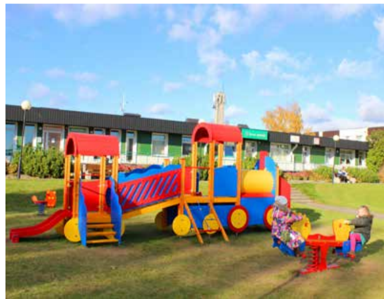
◇ Konstruktsioonilt tugevam kaalukiik sobib ka natuke vanematele lastele

Lisaks täienes mänguväljak kahe ühekohalise väike-