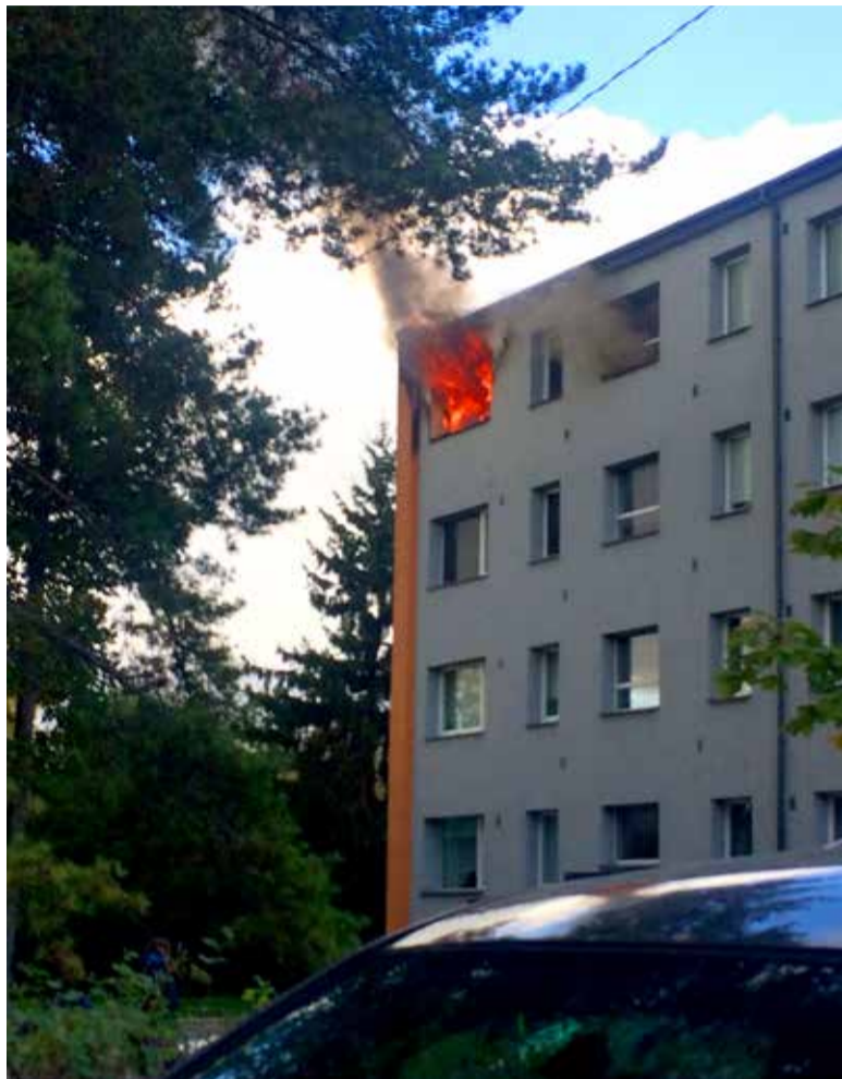
◇ Kui päästemeeskonnad sündmuskohale jõudsid, põles 4-korruselise kortermaja neljanda korruse korter

Päästjad suutsid hoida ära tule leviku teistesse korteritesse. Ülejäänud inimesed, kes