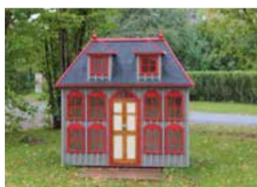
Mis küll mängumajakeses on?