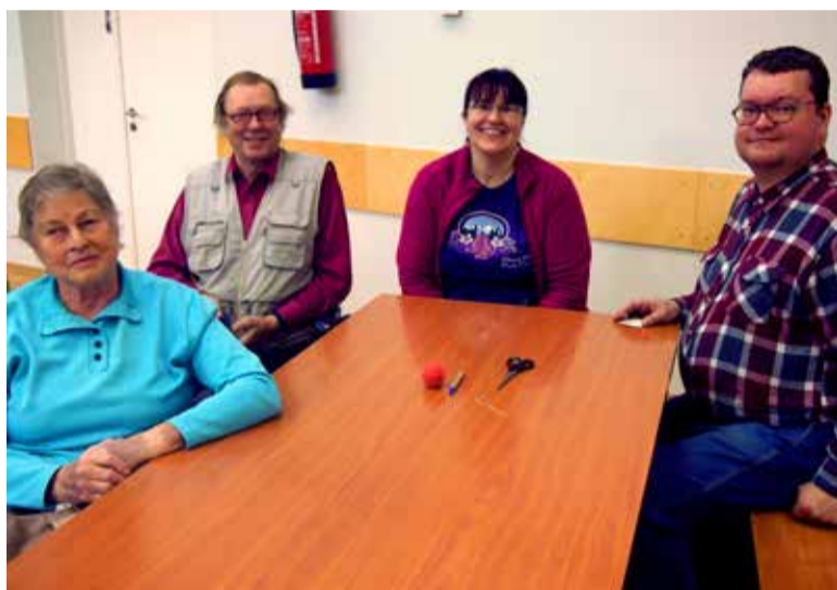
I ja II kohta jagasid võistkond Sügislehed invaühingust ja Tammetõru samanimelisest seltsingust.