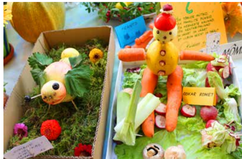
5-aastaste rühmade lapsed koos vanemate ja õpetajatega seadsid erinevad sügiseseid aiasaadused sügisnäitusel kokku põnevateks kompositsioonideks ja vahvateks tegelasteks