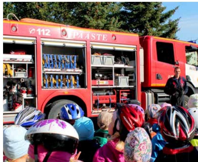
Pärast evakuatsiooniõppust tutvusid lapsed abivalmis päästemeeskonnaga ja tuletõrjeautoga

Teisedki vanuserühmad, õpetajad ja vanemad käisid vaatamas 5-aastaste laste ja vanemate koostöö vilju ning kogusid häid mõtteid ja ideesid Sügisega seotud tegevused