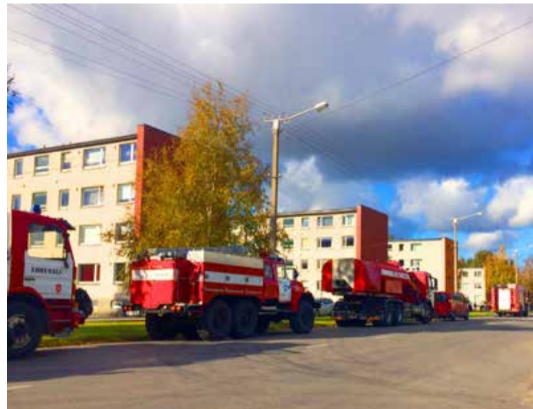
◇ Keila, Assaku, Nõmme, Kesklinna ja Lilleküla päästjad ning Hüüru, Lohusalu ja Muraste vabatahtlikud panid tulele piiri kella 12.40-ks ning kustutasid lõplikult kell 14.24.

tugevaid veekahjustusi korter, mis oli põlenud korteri all.