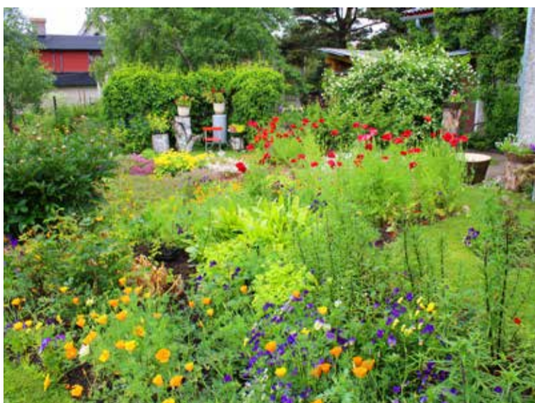
Fotomeenus üha süngemaks muutuvasse sügisesse Tiia Tähtsalu lillerohkest ja värvikirevast aiast