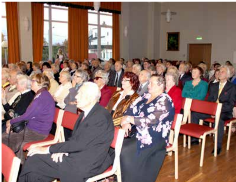
Sauelased armastavad aedadesse ilu luua ja hindavad seda, sestap on kauni kodu konkursi tänuüritusedki linlaste seas populaarsed