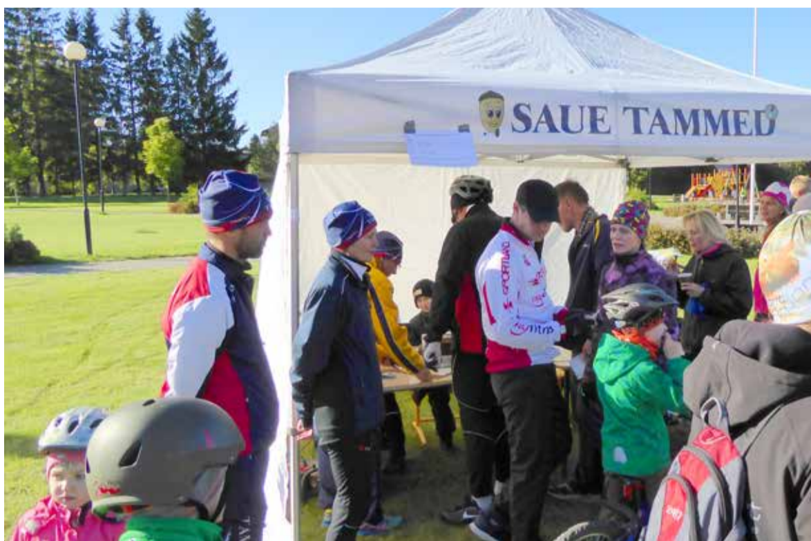
◇ Koostöös kauni sügisilma ja Saue Tammedega toimus 11. oktoobril sarja „Sauelane liikuma“ järjekordne etapp, orienteerumine.

Aitäh Saue Huvikeskusele, AS-ile Sami ja AS-ile Paulig ladusa koostöö eest ning täname kõiki, kes orienteeruma tulid!