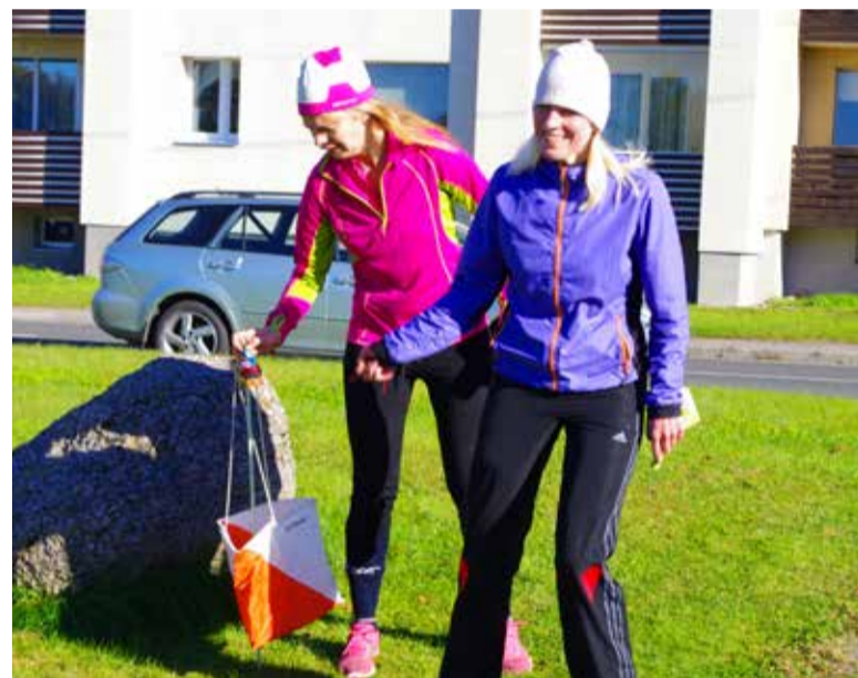
◇ Lisaks võimalusele orienteeruda rattaga oli uuendusi veelgi. Kasutusel oli SI (Sport Ident) kontrollpunktide läbimise- ja ajavõtustusüsteem.