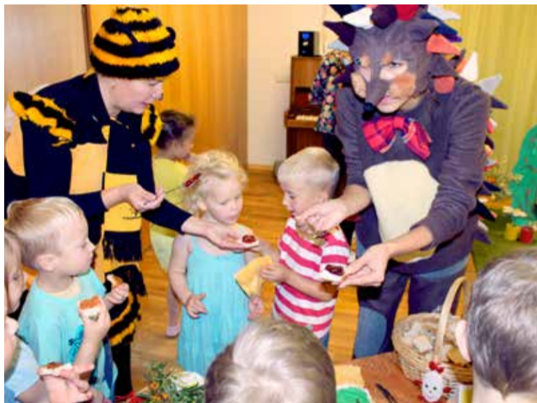
Moosipesas said lapsed ühiselt marjamaiusega sõbraks