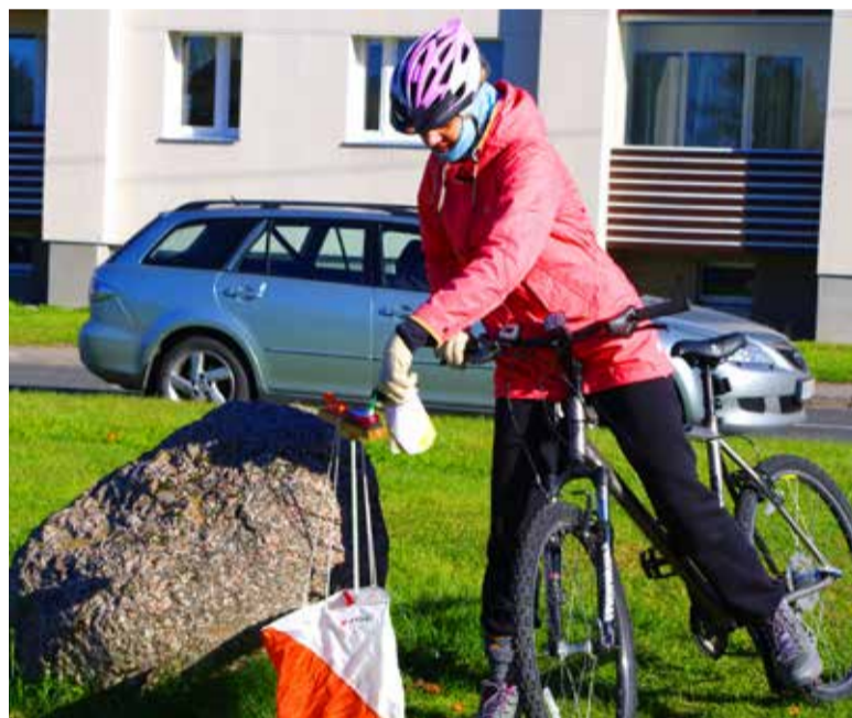
◇ Rattaorienteerumise võtsid osalejad üllatavalt hästi vastu ja seda on kavas pakkuda tulevikuski.