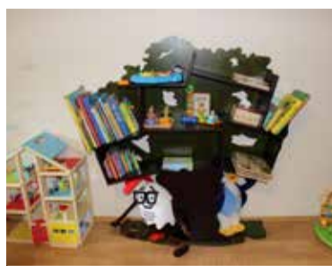
Omanäoline riiv valmis majamomaniku mööblifirmas

las asuv kohvik, mis teenindab teisi Saue linna päevahoides.