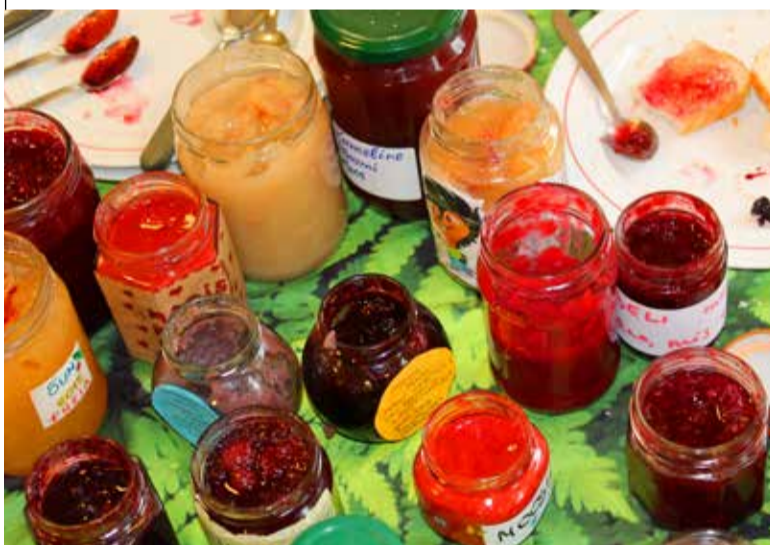
Rikkalik moosivalik näitas, et Saue laste kodudes on moosikeetmine jätkuvalt populaarne.

peaks teinud tõsiselt ettevalmistusi ja lastel olid kaasas vahvad väiksed kodused moosipurgid.