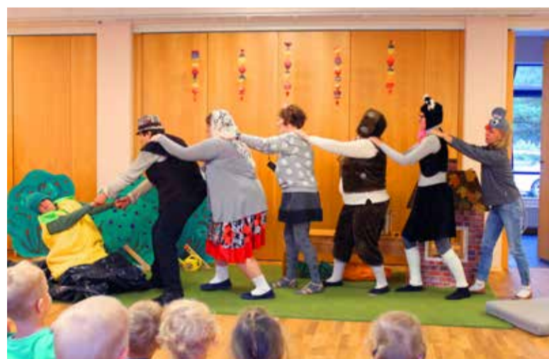
Sügispidude hooaja lõpetas 3-aastaste laste õpetajate ettevalmistatud lavastus „Naeris“, mille õpetajad taaskord lastele paremaks mõistmiseks „Kaalikaks“ kohandasid