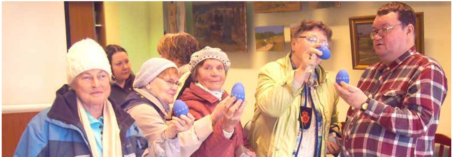
Meil kõigil on nüüd tulekahju ennetav vahend olemas