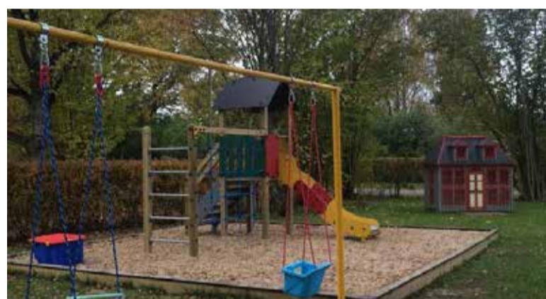
On kiiged ja liumägi, liivakast ja vahva mängumajake

Lapsehoidusid ei rajata ärilises mõttes kasusaamise eesmärgil. Esmalt peavad