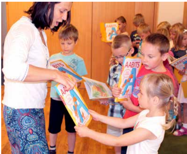
Igaüks saab õppides targemaks ja nutikamaks