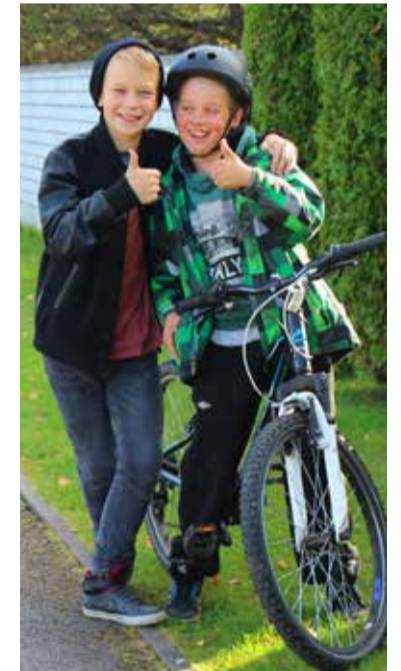
◇ Koolist koduteel olevad sõbrad leidsid, et järgmisena võiks linn Keskuse parki rajada midagi ka nende vanusele sobivat.

kursile esitada suurepäraselt armsa põhjendusega: „Kui minu laps on rõõmus ja õnnelik, siis olen ka mina rõõmus ja õnnelik.“