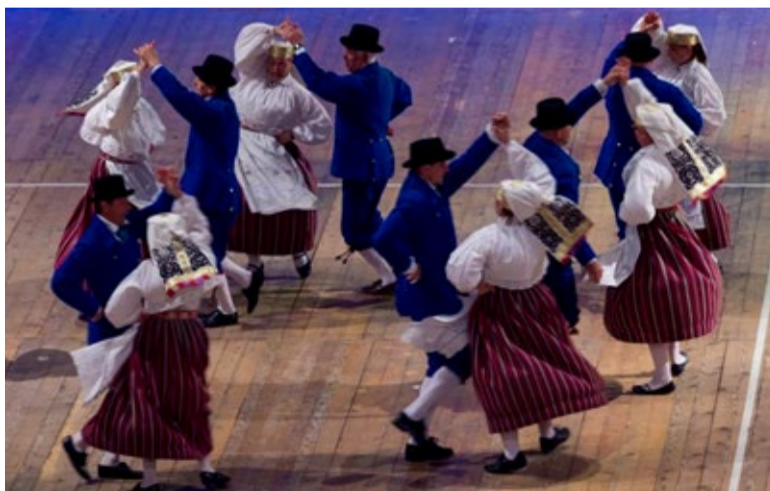
Saue Simmajate segarühm osales Europeadel, suurimal rändfestivalil, kuhu tulevad üle kogu Euroopa kokku rahvatantsu-, rahvamuusika- ja teised rahvakultuurigrupid.

4. augusti pärastlõunal oli Tallinna sadamas sagimist palju. Hansabusse sõitis parklatesse Eestimaa erinevatest paikadest. Nende seas Saue Simmajate segarühm, kes oli osake 900-liikmelisest Eesti delegatsioonist. Võib öelda, et festival algas juba laevas, sest tantsupõrandad olid täis tuttavaid inimesi varsematest