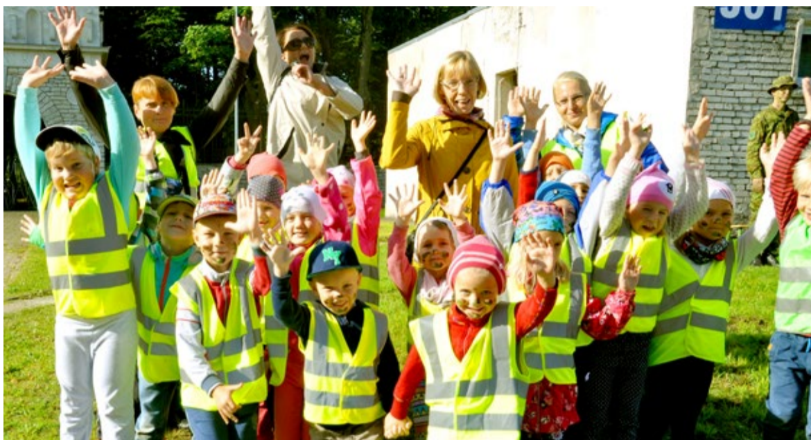
Laskime endale uhked sõjamaalingud näole joonistada, et siis üheskoos rühmapilt teha

Varustusega tutvus tehtud, laskime endale uhked sõjamaalingud näole joonistada, et siis üheskoos rühmapilt teha. Maalingutega koos läbisime mõned elemendid takistusrajal, milletaoline on olemas vaid meil siin Eestis, ja joonistasime sõjaväele oma nägemuse lahtiste uste päevast.