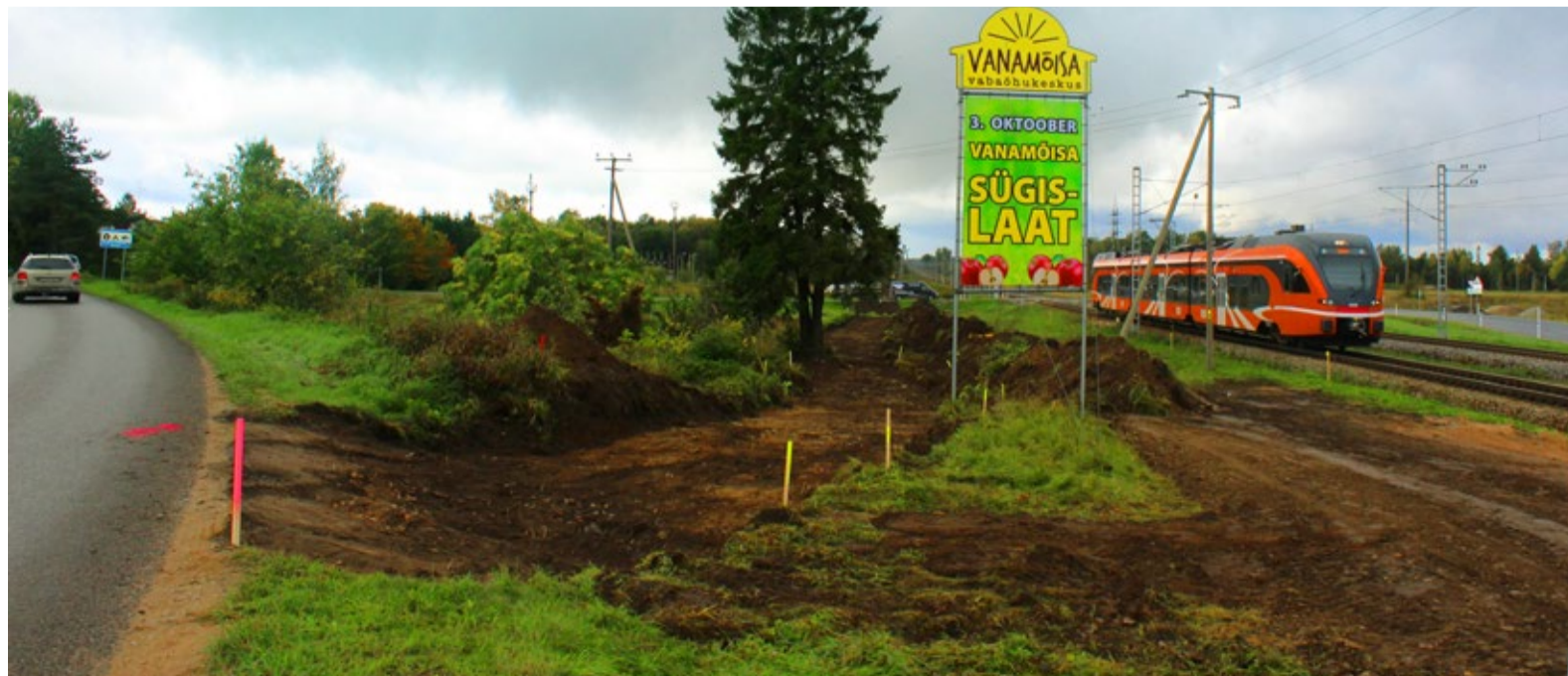
Kergliiklustee saab alguse Tõkke tänava kurvist Saue raudteejaama juures ja kulgeb Saue linna osas paralleelselt raudteega.

Saue Sõna NR 17 (447) 25. september 2015 Väljaandja: Saue Linnavalitsus Telefon 6790175, leht@saue.ee Kujundus: loovbüroo Kuldne Lammas Trükk: AS Printall Kojukanne: AS Ekspress Post järgmine number ilmub 9. oktoober