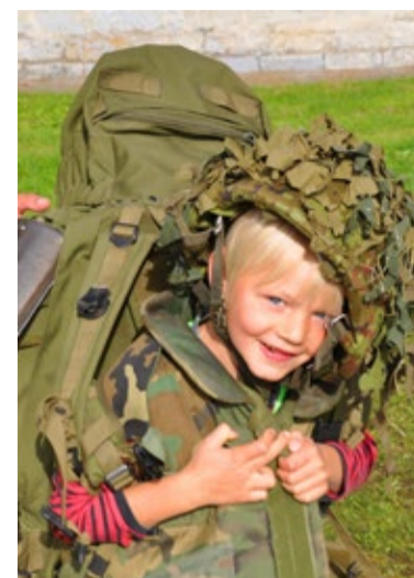
Sõduri varustust proovimas: kiiver pähe, rakmed ümber ja seljakott selga.