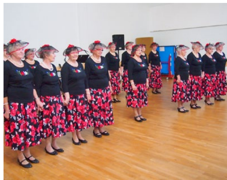
Päevakeskuse seeniortantsijad Senjoriitad olid imekaunid ja nende tantsu oli ilus vaadata.

Palju õnne kõikidele seekordsetele sünnipäevalastele, tänud esinejatele ja tordimeistritele.