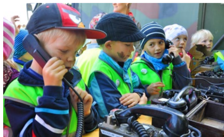
Saime „helistada“ ka suurte raadiotelefonidega

Enne veel, kui päev päris õhtusse jõudis ja pataljon meid mõnusa sõdurisupiga kostitas, näidati meile erinevaid masinad soomukitest meditsiinautoni välja. Kui kõik lapsed olid kõikidest autodest läbi käinud ja