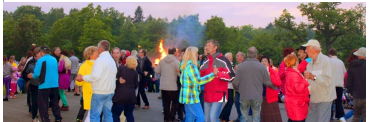
Parvepoiste hoogsad rahvalikud viisid töid tantsuplatsi rahvast täis.