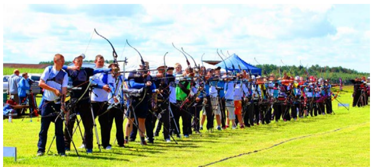
Vibuklubi Sagittarius sportlased on esindanud Saue linna välihooaja esimesel poolel päris edukalt.

Hooaja edasine tähelepanuväärsem sündmus oli