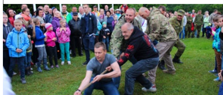
Köieveo võitsid taas mehised mehed Saue kompaniist

Saue Sõna NR 13 (443) 3. juuli 2015 Väljaandja: Saue Linnavalitsus Telefon 6790175, leht@saue.ee Kujundus: loovbüroo Kuldne Lammas Trükk: AS Printall Kojukanne: AS Ekspress Post Järgmine number ilmub 14. augustil