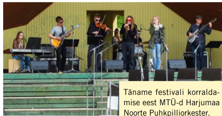
Ansambel Mental Floss oli menukas nii Tallinnas kui Saues