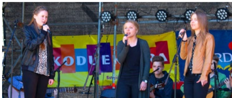
Vokaaltrio astus üles koos kitarristide ansambliga