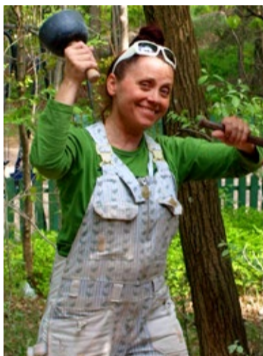
Skulptorist ja kiviraidurist abielupaar tegutseb Hurda küüni töökojas aastaringselt.