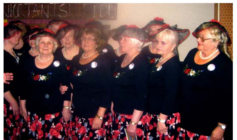
◇ Saue Senjoriitad, vastvalminud imeilusad kostüümid üll, võtsid osa Harjumaa VII seniortantsupeost Arukülas.

Järgmine suurpidu - juba VIII - toimub Randveres.