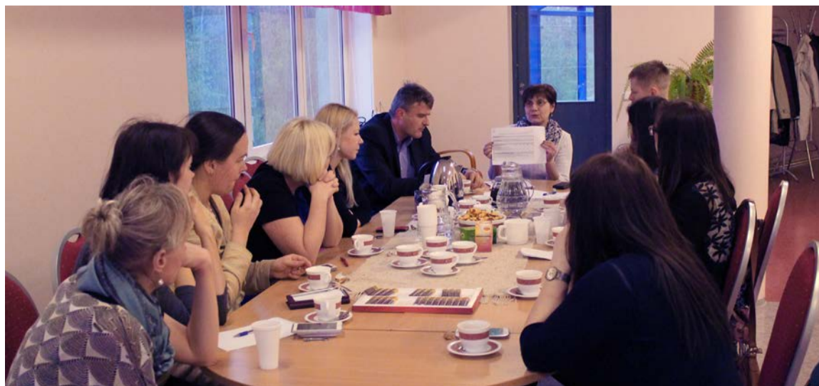
Saue lasteaia Midrimaa 21-liikmelises hoolekogus on lastevanemate koosolekutel valitud 18 rühma, õpetajate, Saue Linnavalitsuse ja Saue Linnavolikogu esindajad.