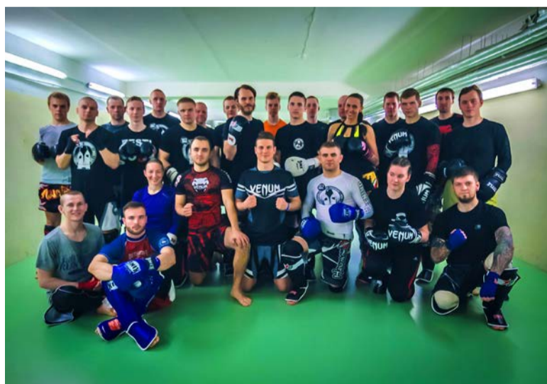
Osalejaid tuli kohale 26, see on spordiklubi treening-seminaride rekord.

Soovime tänada ürituse korraldamisel abiks olnud koostööpartnereid Kema Film, Fitshop ja Võitluspood.