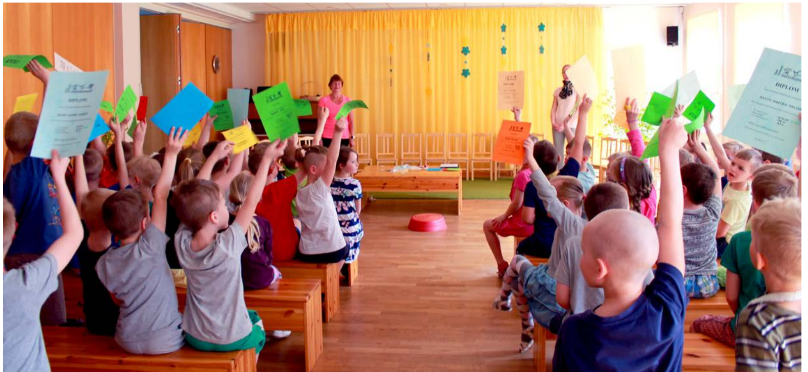
Saue lasteaia Midrimaa meistrivõistlustel osalejate autasustamine.

Et tagada lastele pidev liikumisvõimalus, kasutame põhiharjutuste sooritamisel sageli ringmeetodit, et kõik lapsed oleksid korraga aktiivses tegevuses. Võimlemissaalis on lapsed pidevalt liikvel, vererõhk kiireneb ja jahtumine ei ole tõenäoline.