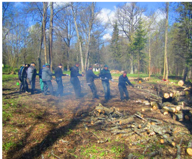
Piltlik näide sellest, et kui kõik veavad ühes suunas, on jõud suur ja asjad edenevad väga hästi.