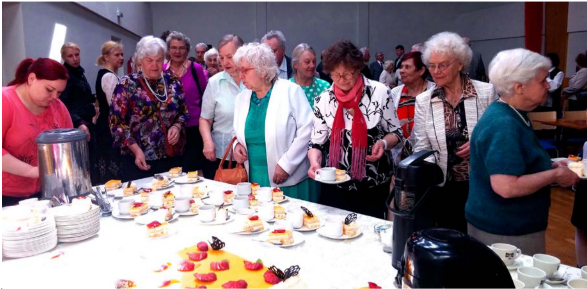
◇ Pidu lõppes suure tordiga