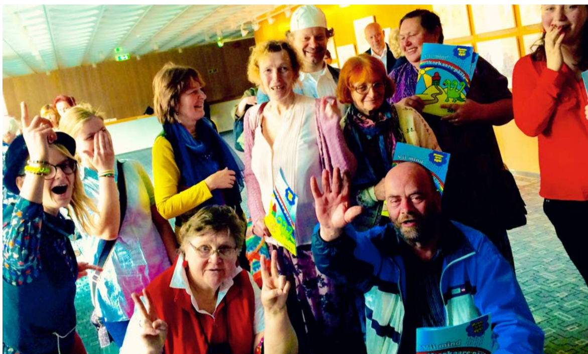
◇ Saue Päevakeskuse näitemänguring sattus muinasjutuvestjate festivalile Haapsalus.

Janika Kronberg viitas Ernst Enno eraklikkusele ja erakordsusele. Oma kaasaegsetega Enno ei klappinud: Tuglas kipus ta luuletusi „parandama“. Õnneks küll parandusi sisse ei viidud. Noor Eesti pürgis Euroopasse, Enno vaatas pigem itta. Kui palju Ernst Enno ida-