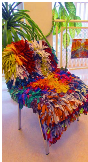
Värvikas toolikate, mis valminud taaskasutuse ringile kohaselt trikotaažiribadest

Raamatukogu „trepigaleeris“ võib näha väljapanekut rõivaesemetest, millele on tekstiili ja taaskasutuse kursusel aplikatsioonide ja masintekandiga uus ilme antud.