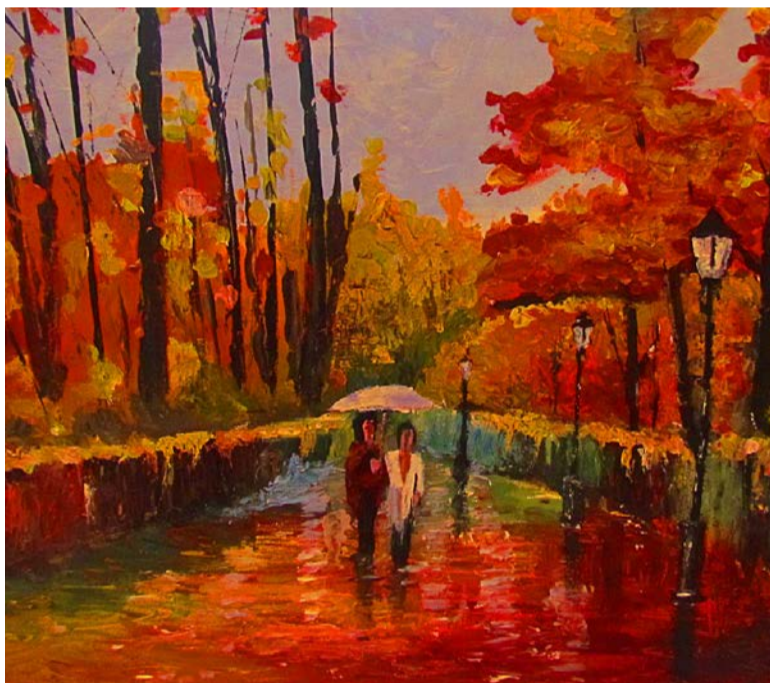
Raamatukogu esimese ja teise korruse seintel on maastikumaalid, natüürmordid, portreed ja koopiad tuntud kunstnike tödest.

Kevadnäitusel on eksponeeritud valik kolmel kunsti- ja käsitöökursusel tehtud tödest. Raamatukogu esimese ja teise korruse seintel on maastikumaalid, natüürmordid, portreed ja koopiad tuntud kunstnike tödest.