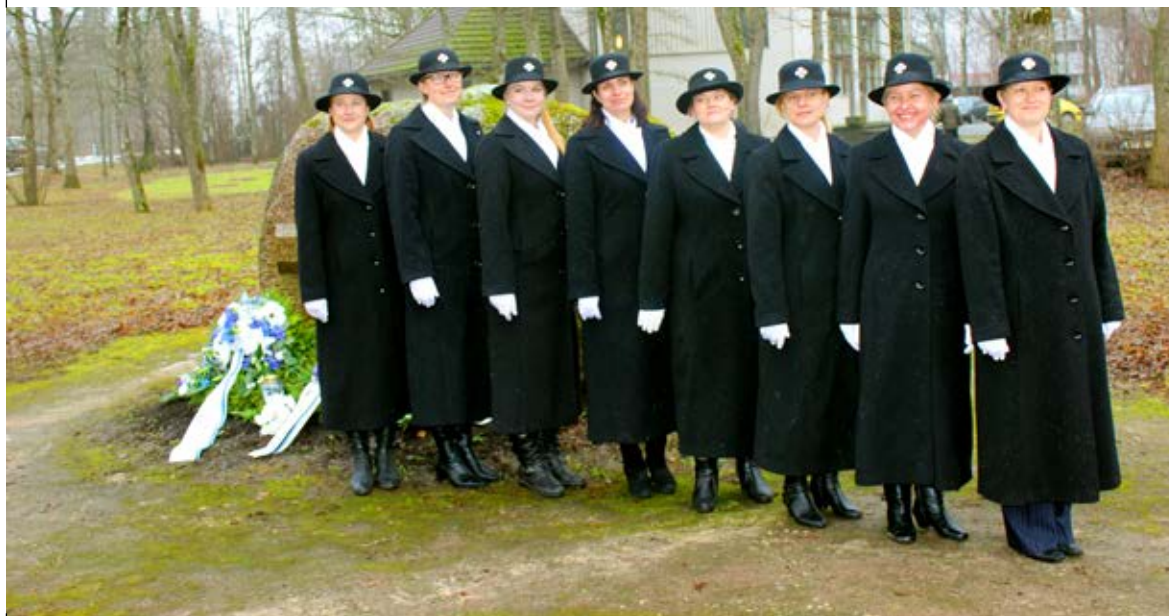
◇ Saue naiskodukaitsjad

suhtutakse tõsiselt nii riigi kui vabatahtlikkuse tasemel Kaitseväe näol. Ka Saue linnas