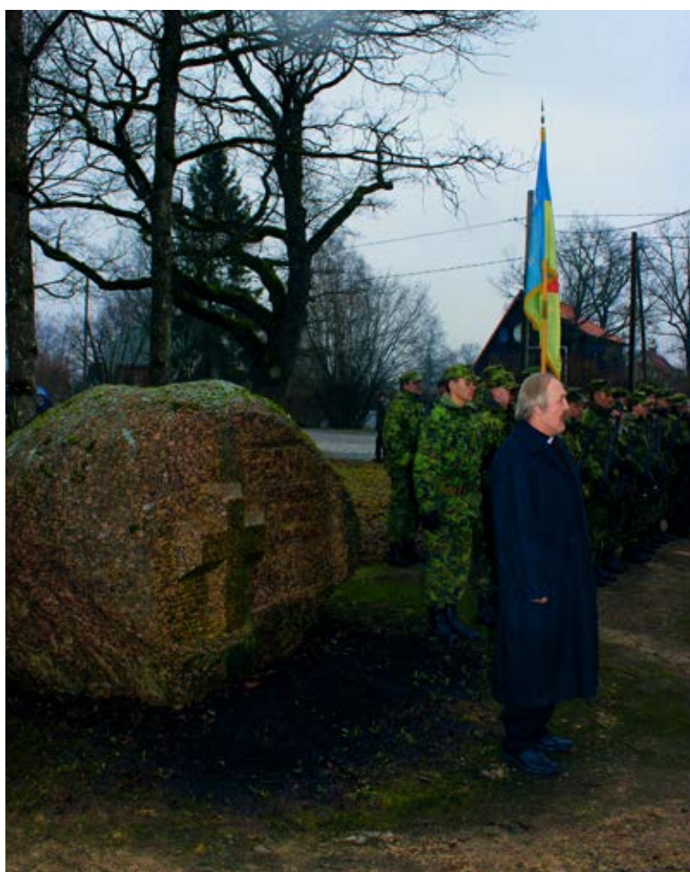
Tseremoonia mälestuskivi juures juhatas sisse Saue kristliku vabakoguduse pastor Vahur Utno: Fotod: Sirje Piirsoo

Ilusat vabariigi aastapäeva meile kõigile!