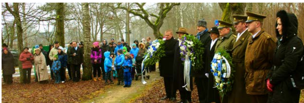
Paraadile järgnes pargade asetamine Eesti vabaduse eest langenute mälestuskivi jalamile ja jumalateenistus: Fotod: Sirje Piirsoo