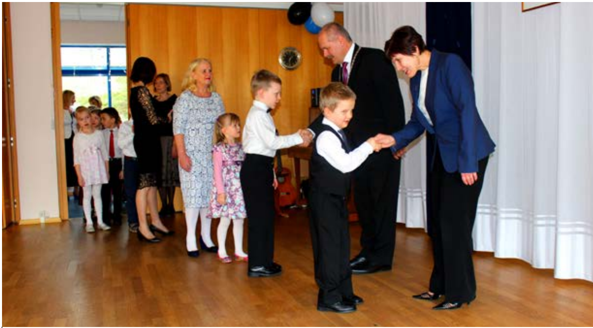
„Head vabariigi aastapäeva!“ soovis iga väike peoline linnapeale ja lasteaia direktorile