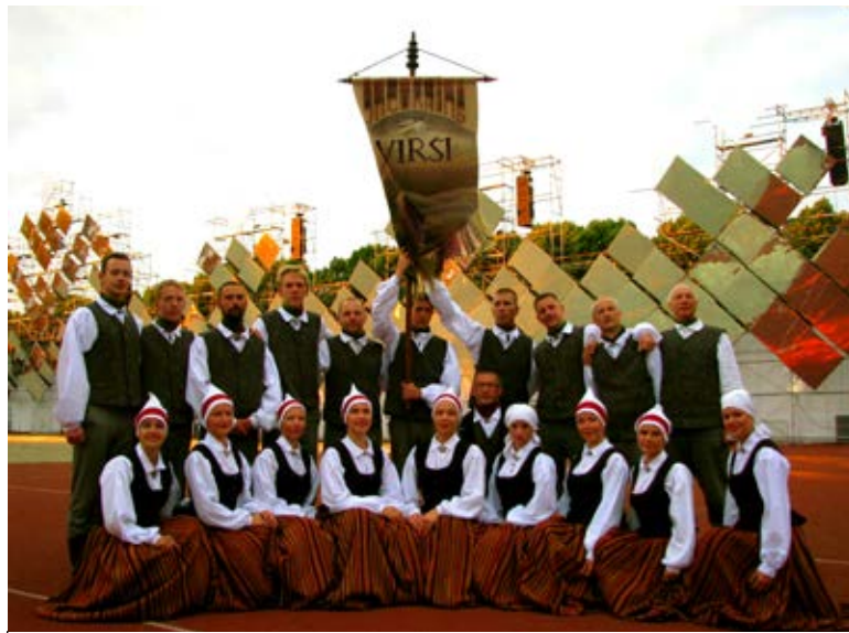
◇ Rahvatantsurühm Virši

Teine liitunud osapool, Vangaži sai linna staatuse 1991. Väikese ja noore linna