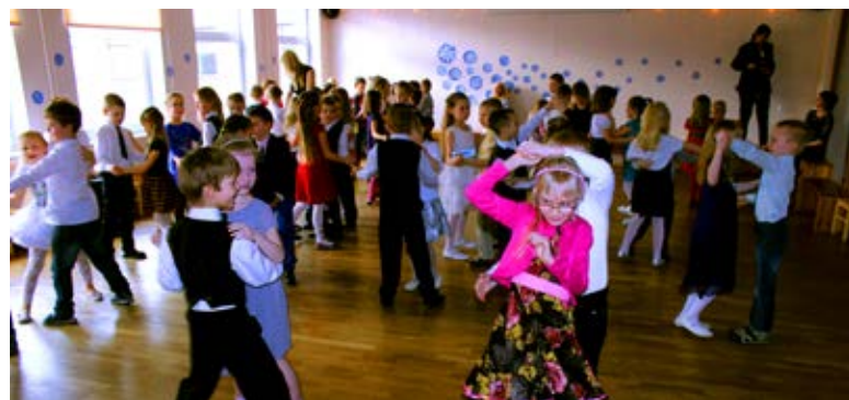
Ühine valsitantsimine tuli vahvalt välja.