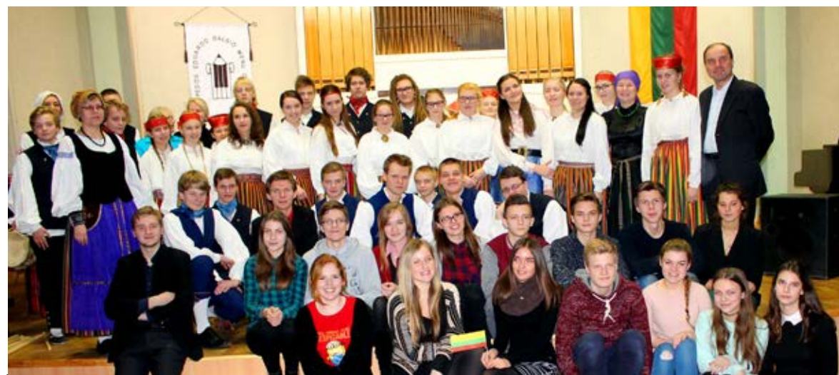
Saue Gümnaasiumi noortekoori lauljad ning 8. ja 11. klassist moodustunud rahvatantsu grupp oma heade uute sõpradega Eduardo Balsio kunstigümnaasiumist.

Eduardo Balsio kunstigümnaasium võttis meid vastu väikeste Eesti lippudega lehvitates ja väga külalislahkelt. Esimesel õhtul, kui õhtusöök oli söödud, saime kohalikega rohkem tuttavaks. Koolis on oma ühikas, kus elavad väga paljud õpilased. Nii saime ka meie paariks ööks sinna jääda. Teine päev algas hommiku-