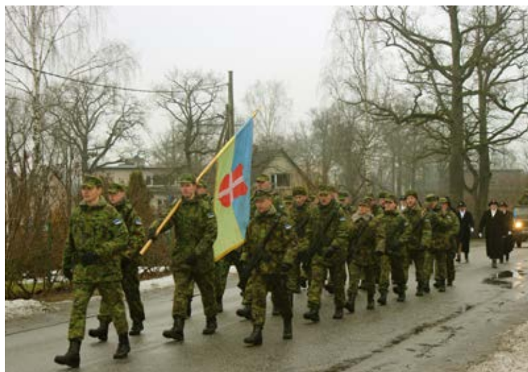
Kaitseliidu Saue kompanii ja Naiskodukaitse Saue jaoskonna pidulik jalutuskäik kulges Ladva tänavalt läbi Saue kiriku juurde

Fotosid ja lugusid vabariigi aastapäevast Saue leiata kogu lehest.