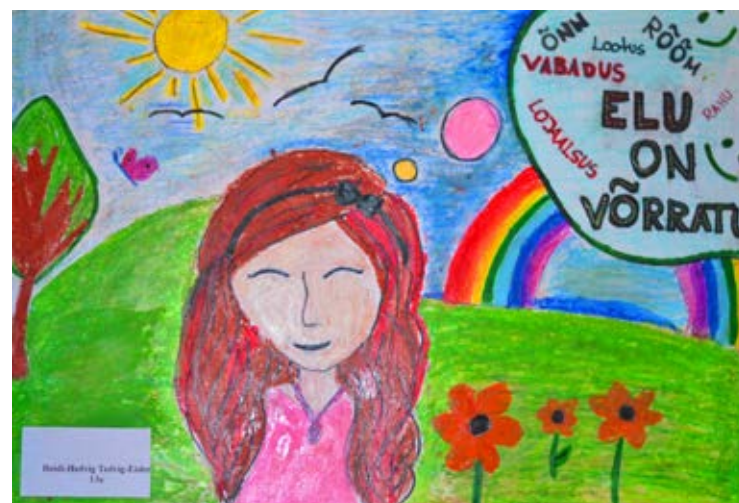
◊ Heidi-Hedvig Tedvig-Eisleri võistlustöö.