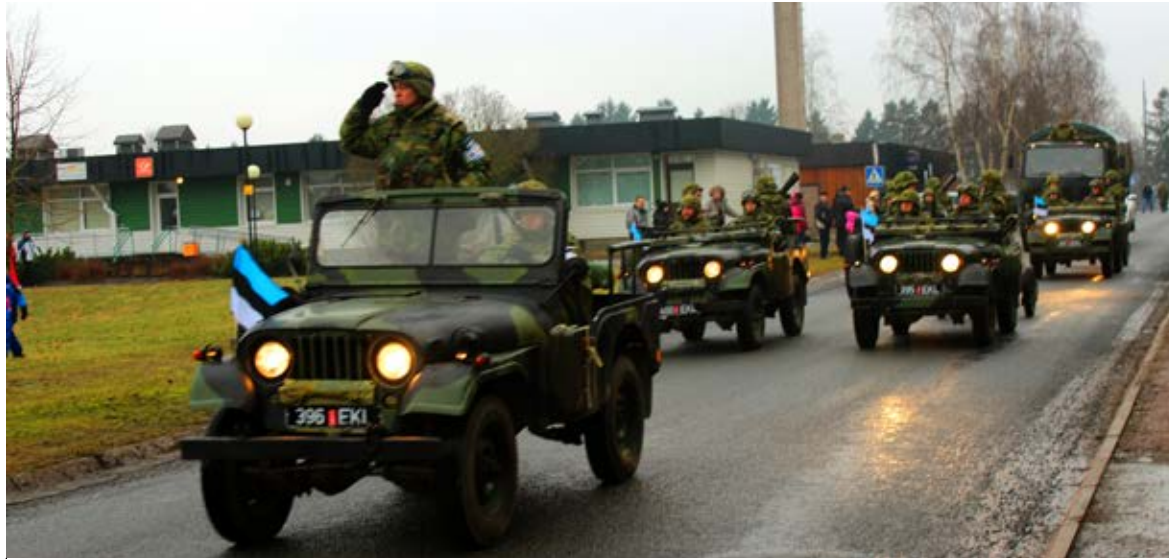
◇ Saue kompanii tehnika pidulikult jalutuskäigul

Täna, kus Venemaa on agressiivselt näidanud oma kohalolekut ja võimu Ukrainas, on hea näha, et valmisolekusse võimaliku agressiooni vastu