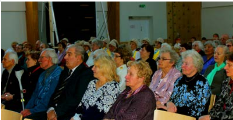
◇ Sünnilapsed on kohal, pidu võib alata