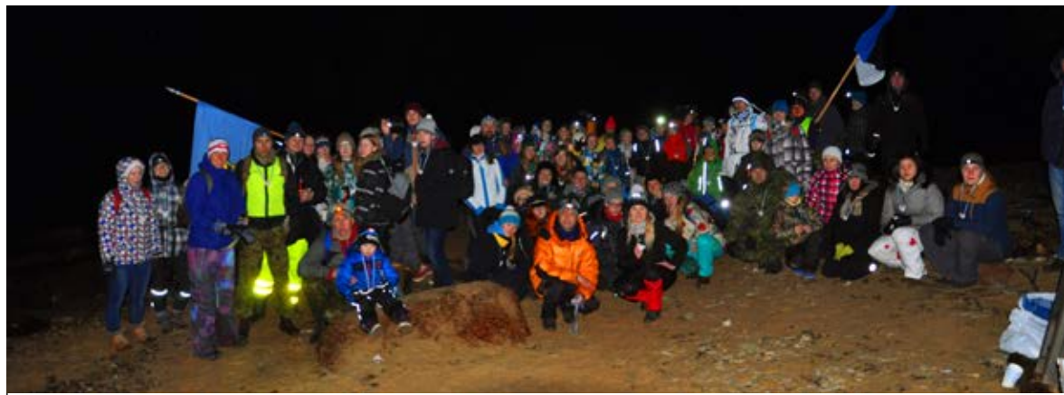
◊ Öömatkal osalejad mererannas