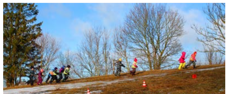
Hoogne „hobusesõit“ üle mäe.