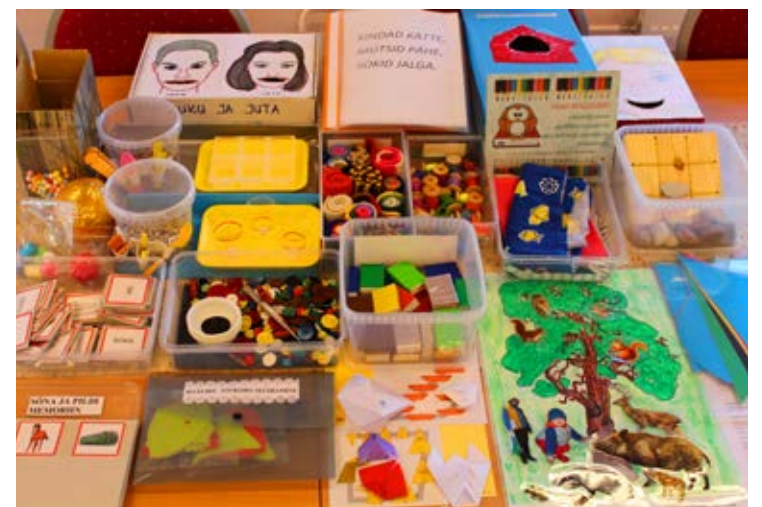
Lasteaed korraldas omavalmistatud õppemängude näituse, et hinnata õpetajate ettevõtlikkust ja toetada omanõolisust, algatusvõimet ning mängulisust.

Kui näitusel osalemine oli õpetajate soovil anonüümne, siis pärast selle lõppu lasteaia kodulehel kajastatud kokkuvõttes täname nimeliselt kõiki näitusel osalenud õpetajaid.