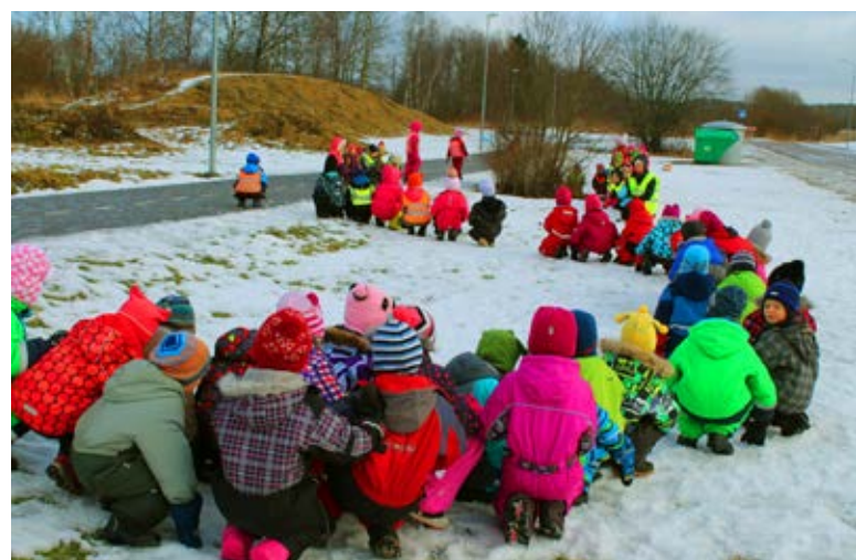
Mägi juba paistab, et trallima minna

Kõige lõpuks tehti kaaslasega koos hoogne „hobusesõit“