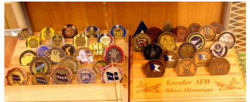
Omamoodi väärtuslikud on kõik eksponeeritavad meenemündid. Iga kogujale on südamelähedaseim vast tema oma väeosa või malevkonna münt.

Varsti pärast medaljonide valmistamist sai piloodi lennuk lahingus tugevalt kannatada. Ta oli sunnitud maanduma vaenlase territooriumil ja Saksa patrull võttis ta kohe vangiks. Vältimaks põgenemist, võtsid sakslased talt ära kõik isikut tõendava. Piloodile jäi kaela vaid väikene