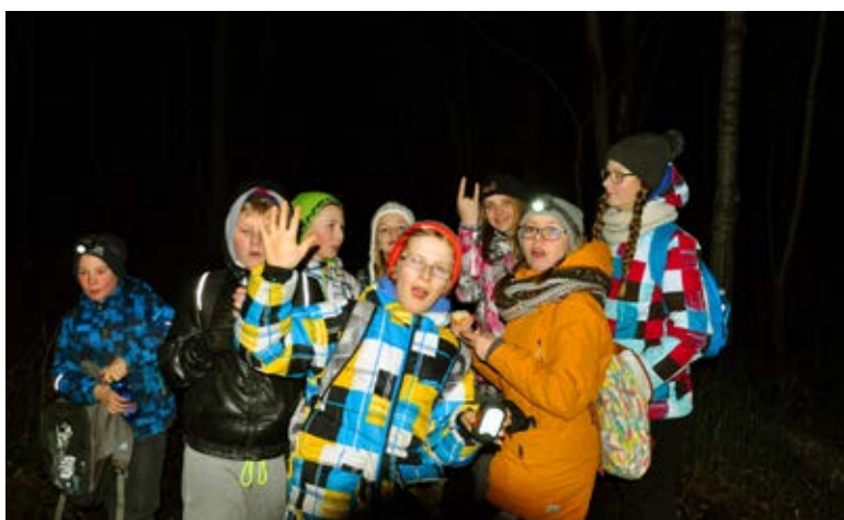
◊ Õige öömatkaja varustuses on pealamp omal kohal.

pikkus oli orienteeruvalt viisteist kilomeetrit.