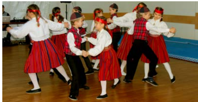
◇ Esineb rahvatantsurühm Tõrukesed gümnaasiumist.

Idee üheskoos sünnipäevi tähistada tuli 2012. aasta kevadel võimule tulnud koalitsioonilt, et nii Saue vanemat generatsiooni meeles pidada ja väärtustada.