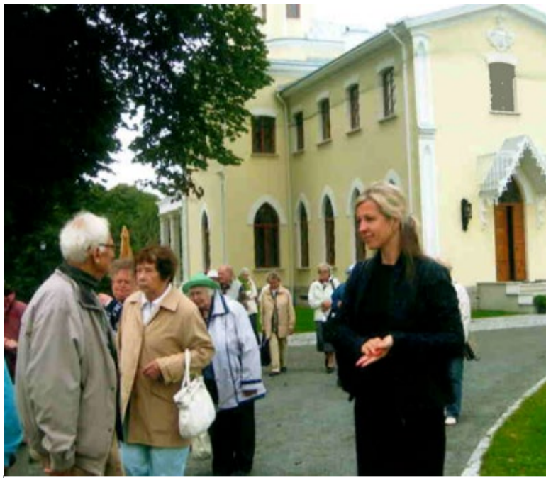
◇ Saue linna invaühing käis hilissuvisel reisiril Keila-Joal ja Paldiskis.

Alles hiljuti lõppenud restaureerimistööde käigus taastati endine hiilgus, mida meiegi nägime. Et Benckendorff oli