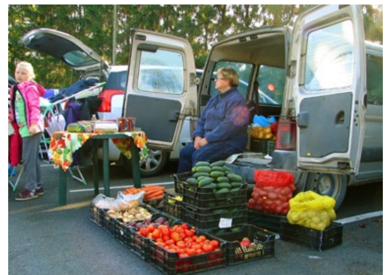
Laadal olid müügil ka värsked aiasaadused.

Kui aga on soe ja päikeseline, siis võime ju veelgi kokku saada. Sestap ei hakka korraldajad liialt kaugeleulatuvaid plaane pidama ja asuvad ilmavaatlusi tegema. Värske info saamiseks tasub edaspidigi aeg-ajalt kiigata Facebookis Saue garaazimüügi leheküljele: www.facebook.com/sauegaraazimuuk .