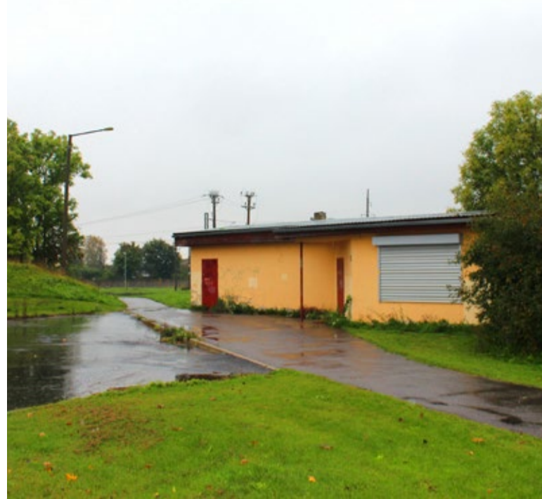
Kuuseheki tänav 5a kuulub nüüdsest linnale.

Kuuseheki 5a piirneb ühelt poolt Saue linnale kuuluva raudteeäärse maaüksusega ja teiselt poolt raudteemaaga, mille osas on linn pidanud läbirääkimisi, et võtta see kasutusse pargi- ja reisi-parklana.