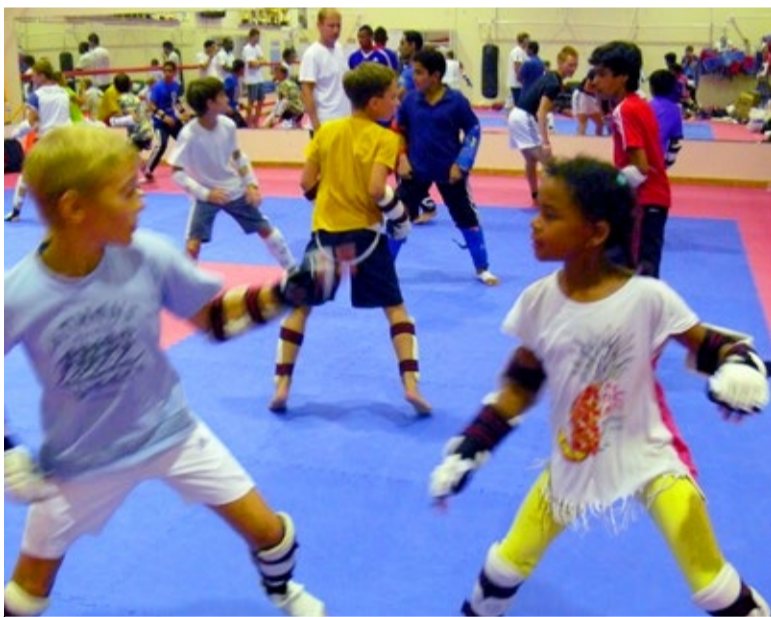
◊ Eloura vastane on noorsportlane Venemaalt.

klubi sportlastel jätkus 40-kraadine palav kliima, viibides 10. kuni 20. augustini kolmandat korda Araabia Ühendemiraatides Sarjah's