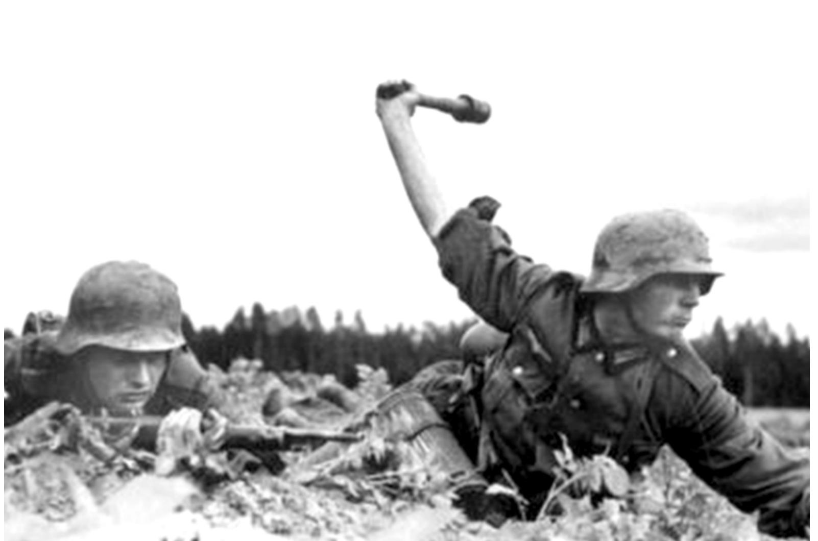
◇ - Eestlased kaitsesid vaenlase eest iga küla, iga silda, iga jalatäit maad.

Viimase kaitselahingu Tallinna eest pidas grupp soome- ja pitkapoisse koos Eesti Diviisi meestega - kokku umbes 20 võitlejat - maha Pääskülas, tänase raudteede-