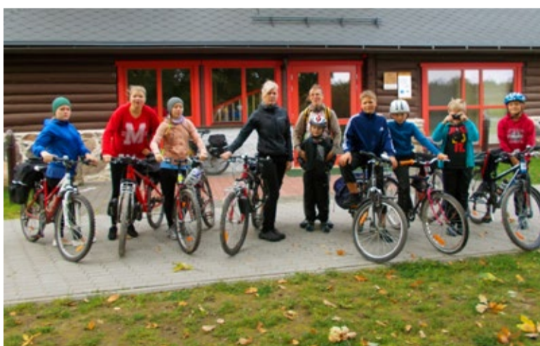
Ootus RMK Simisalu Looduskeskuses

Projekti „Targalt läbi Eesti 2“ tegevused ongi planeeritud sellised vesised ja tumedad: süstaga mere peal sõitmine, vihmaga telkimine, lumes