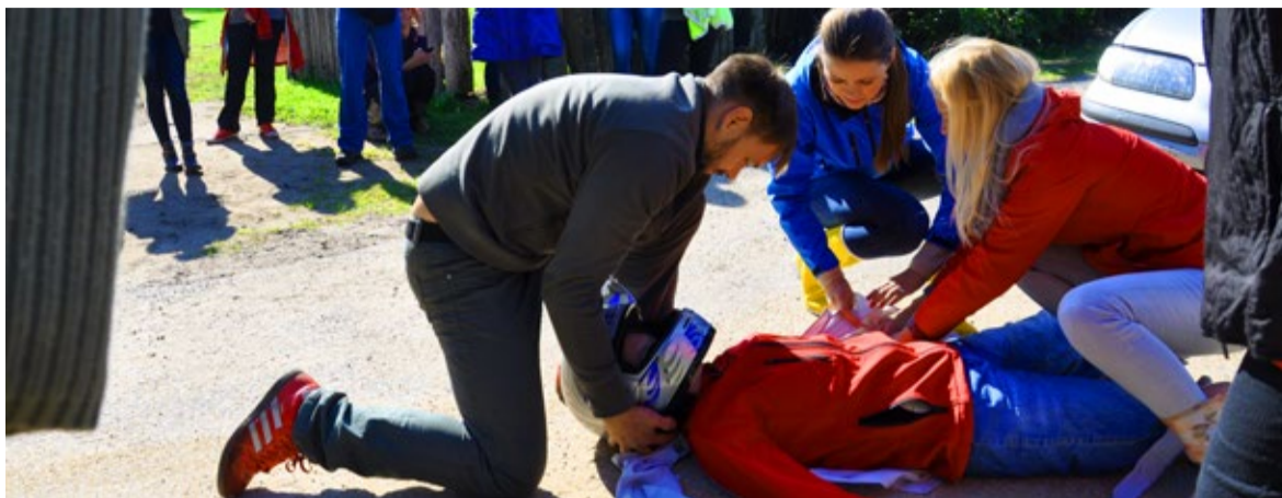
Kutsevõistluse üks osa oli eluliste õnnetusjuhtumite lahendamine õigeid esmaabivõtteid kasutades

Lõpuks tundsid noorsootöötajad, et midagi peab muutuma. Ja kes muu peaks