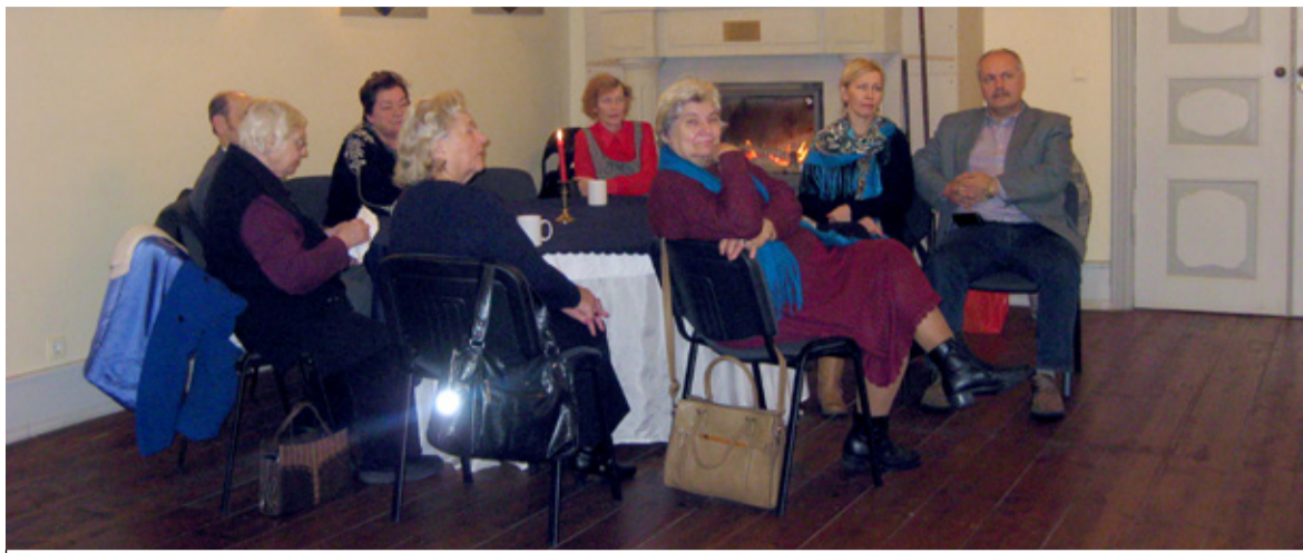
◊ Detsembris külastas 15 inimest Saue klubist Tammetõru Suure-Lähtru mõisa.

Linnapea andis ülevaate 2014. aasta saavutustest ja eesseisvatest ülesannetest. Ühtlasi kerkis üles küsimus, kas Eestis on veel selliseid tublisid peresid, kes on võtnud oma südameasjaks lagunema kipuvate ajalooliste kultuurimälestiste säilitamise.