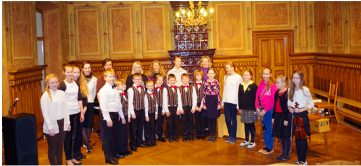
◇ Saue Muusikakooli õpilased pakkusid Vasalemma mõisakooli saalis vallarahvale muusikalise elamuse. I Foto: Kristiina Liivik

on algupäraseks renoveeritud ja suurepärase akustikaga kontsertikoht, kus on esinenud Arsise kellade ansambel,