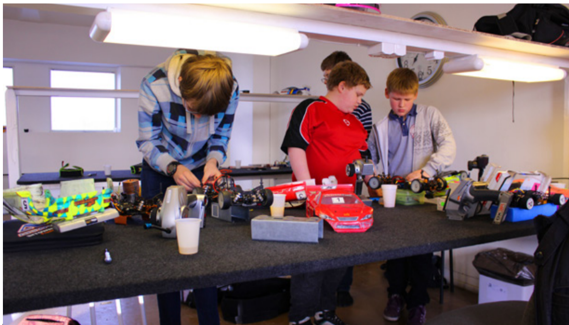
◇ Saue HOBIZones alustas jaanuari alul tööd noorte mudeliringi.

Ringi, mille maksumus on 30 eurot kuus ja mis toimub neljapäeviti kell 15.00-17.00, ootame osalema kõiki tehnikahuvilisi vanuses 10-21