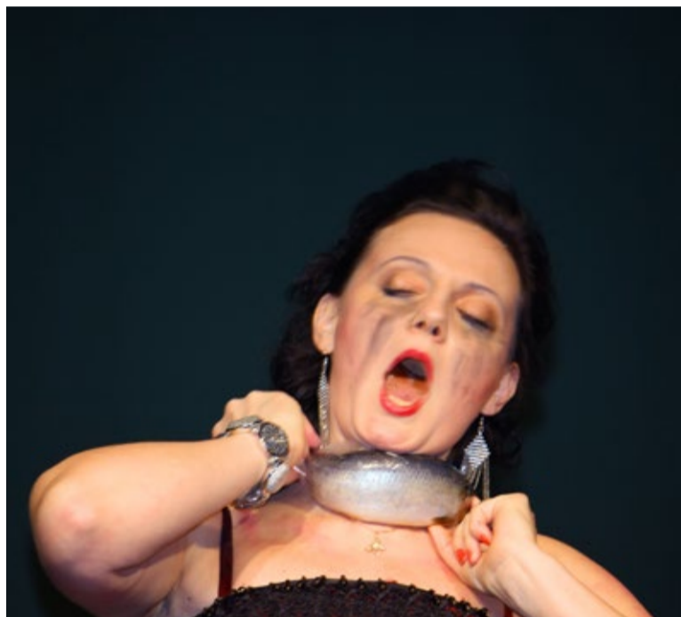
Kratsimine kurgus nõuab viivitamatut esmaabi - miks mitte suruda kurgule soolaheeringas

Publik, kes end mõnusalt küünaldes laudade taha sät-