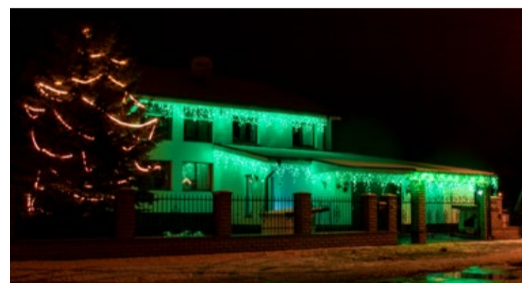
◇ Möödunud aasta jõulukonkursil paistis Vana-Keila mnt 98 silma rikkaliku valguslahendusega.

Korraldatud jäätmeveoga mitteliitunud jäätmevaldajad, kes ei esita nimetatud tähtjaks kinnitust, loetakse alates 21. jaanuarist 2015 korraldatud jäätmeveoga automaatselt liitunuks.