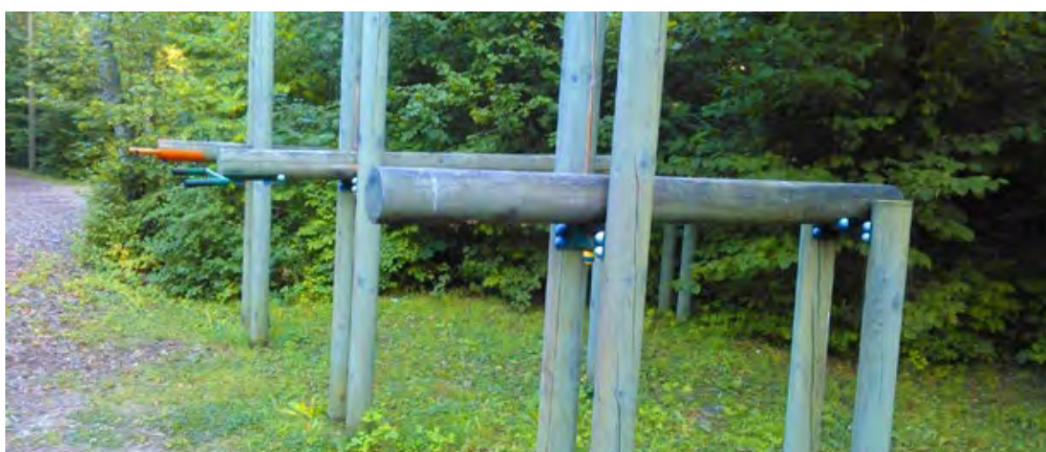
◇ Tõstepoomi käepide varastati 4. või 5. augustil.