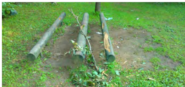
◇ Pildil olevad poomid lõiguti puruks 2. või 3. augustil

Palume inimestel, kes nägid või teavad midagi, sellest teada anda Saue Linnavaralduse telefonil 6595611 või politseile.