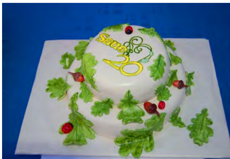
Kõige kallimalt, 60 euro eest müüdi mullu oksjonil maha Saue naiskodukaitsete valmistatud tort.

Et tee äärde on pargitud ka osalejate ja müüjate autod, siis soovime Saue elanikel autod hoopis koju jätta ja tulla peole jalgsi. Parkimine jaanituleplatsi parklas on ainult lubade alusel. Sünnipäevapeo korraldustoimkond loodab sauelaste mõistvale suhtumisele ja palub vabandust võimalike ebamugavuste tekitamise pärast.