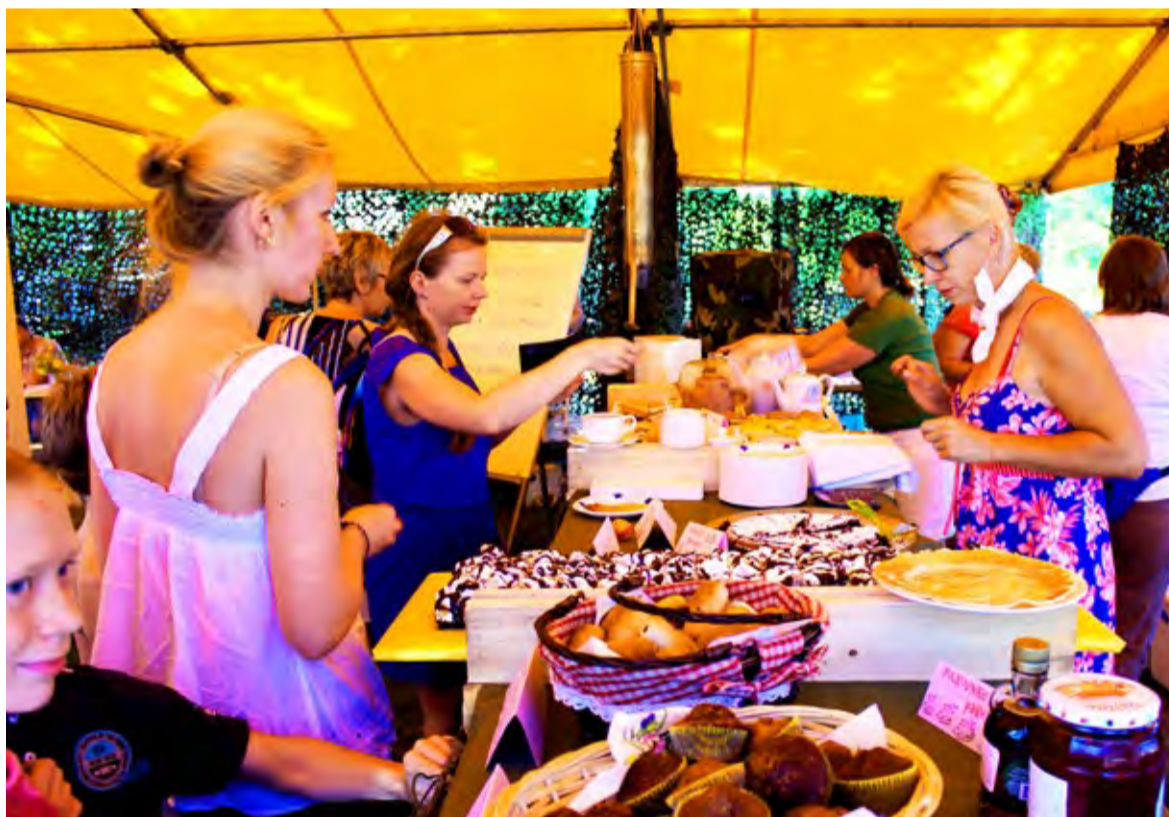
◆ Kompanii teemaja pakkus polkovniku päikest, kapteni kalaampsu, nekruti ninaesist, ohvitseri oodet, kaprali kana ja muud põnevanimelist, mis lõppes otsa kiiremini, kui oodatud