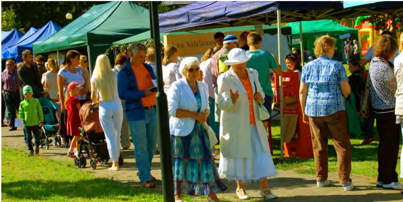
Linna möödunud aasta sünnipäevapidu täitis Keskuse pargi meluga, tänavu kohtume 20. augustil jaanituleplatsil