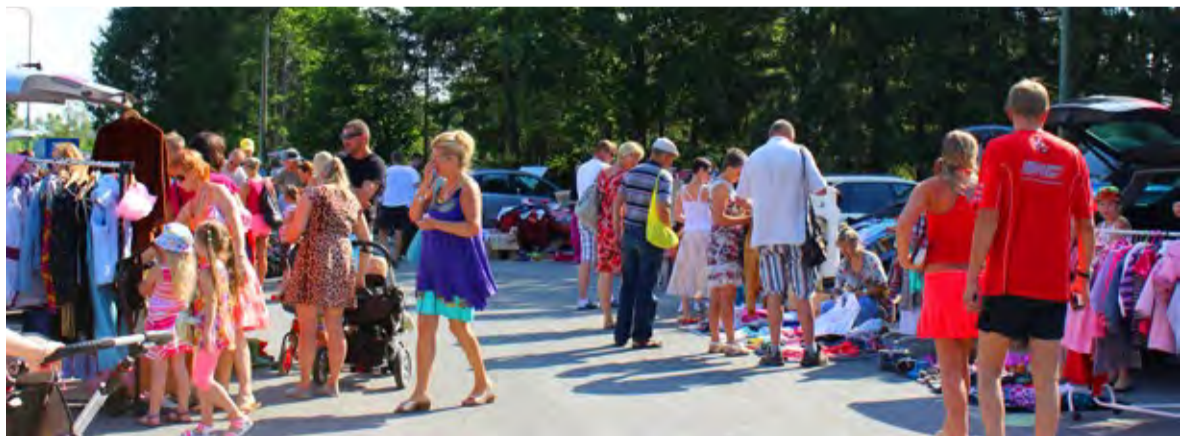
◆ Regulaarsed taaskasutuslaadad koos rohevahetusega ja garaažimüügid käivitused juba tänavu mais ning on võitnud suvega sauelaste poolehoidu. Järjekorras neljas 10. augustil oli rahvarohkeim kui kunagi varem.

Regulaarsed taaskasutus- laadad koos rohevahetusega ja garaažimüügid käivitused