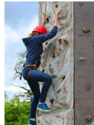
Oli võimalik ronida ka roniseinal.