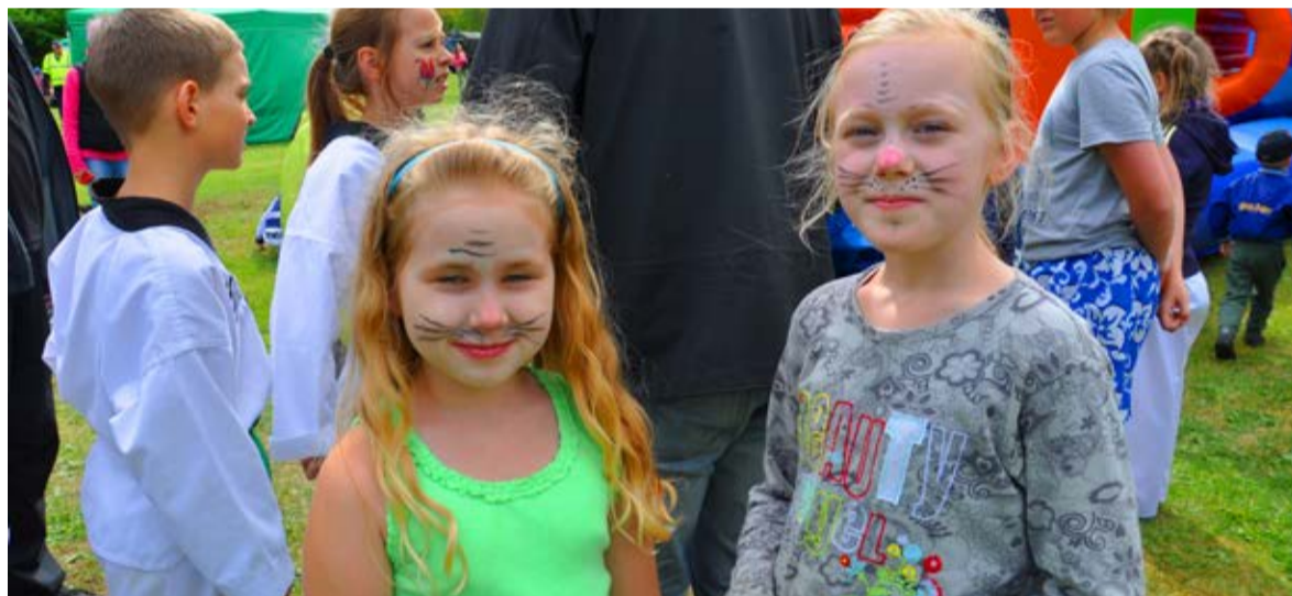
Need tüdrukud on juba noortekeskuse näomaalingute telgis olnud