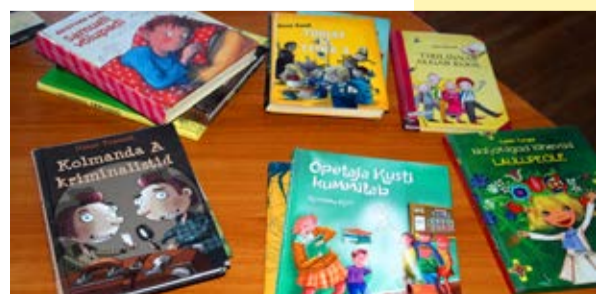
Eesti Lastekirjanduse Keskuse lugemissoovitused 8-12-aastastele lastele.

tee raamatuteni. Kohaletunud lastel kulub aeg lõbusalt ja märkamatu. Jagame ka lastevanematega Anne Kõrge soovitusi, milliseid uusi eesti kirjanike kirjutatud raamatuid 8-12-aastaselt lapsed võiksid lugeda. Kohtumiseni raamatukogus iga ilmaga.