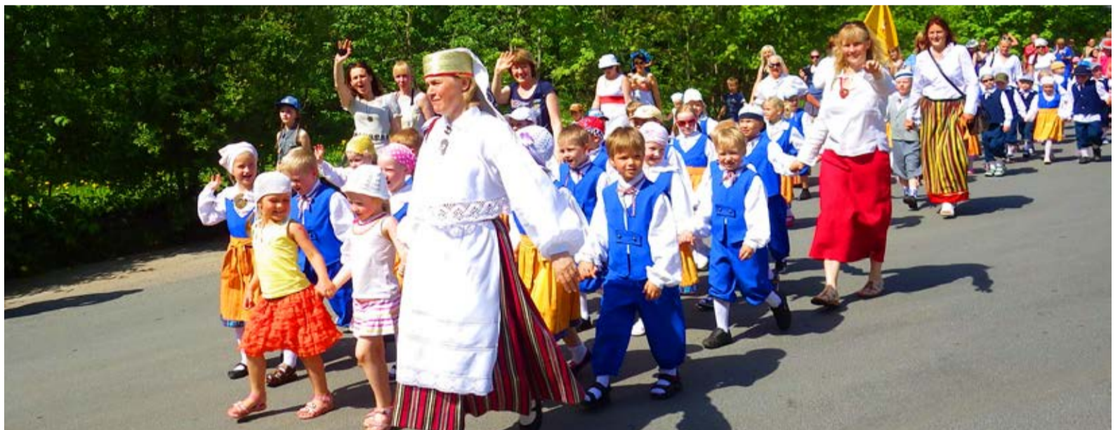
Lõbus rongkäik läbi linna teatas kõigile peo algusest ja kutsus osalema.