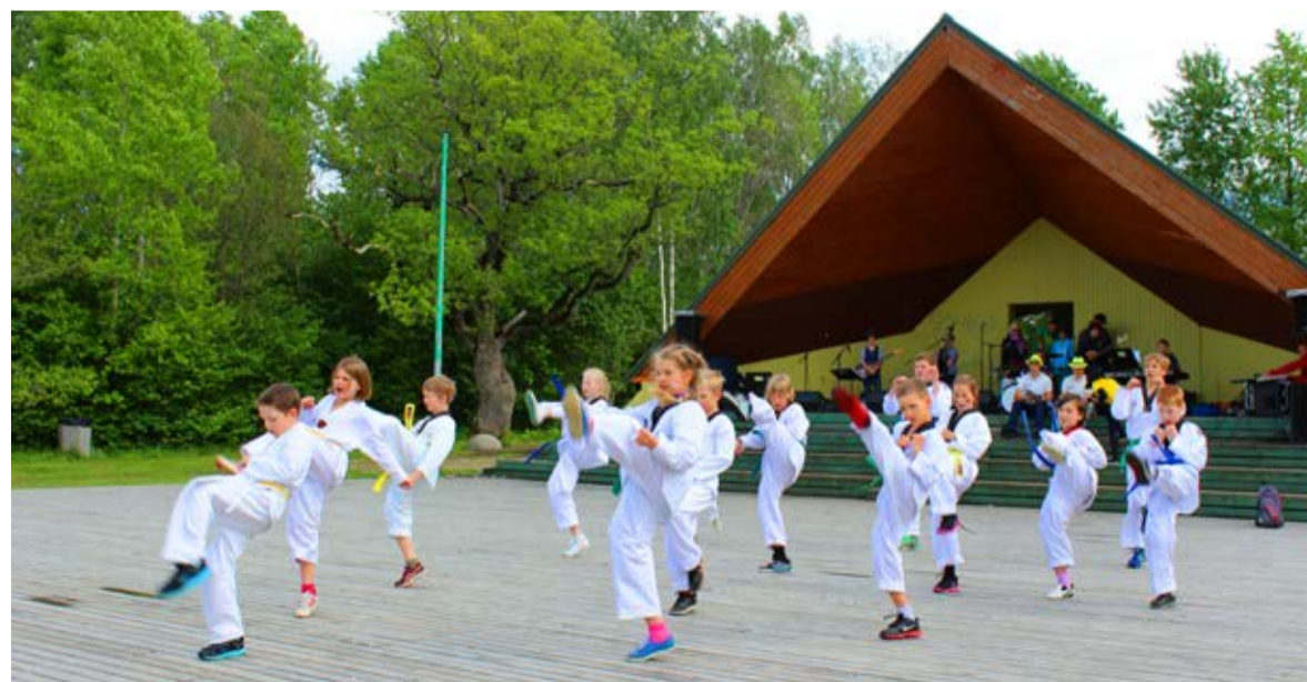
Põnevust pakkusid Saue Taekwondoklubi sportlased