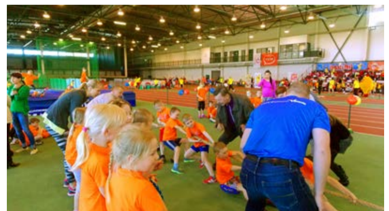
Kõieveo finaalis saavutas meie Midrimaa teise koha Kiili lasteaia järel.