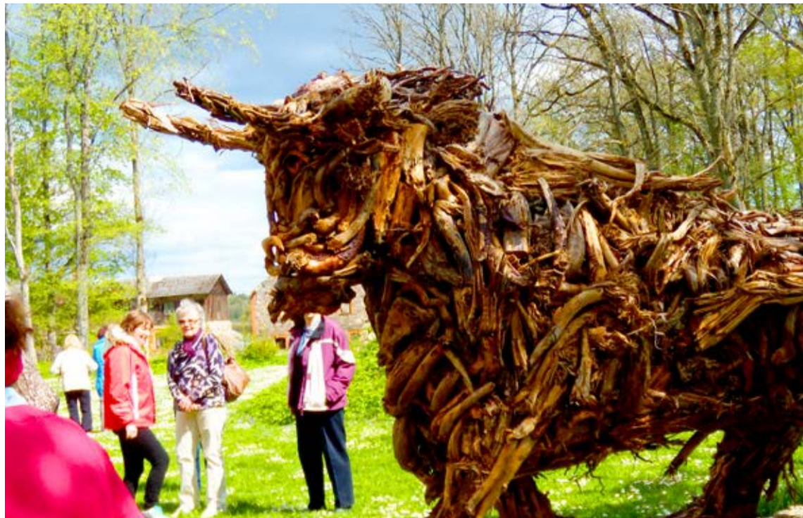
Salla mõisaparki, mis on Põhja-Eesti okaspuurikkamaid, on püstitatud puujuurikatest piisoni kuju.