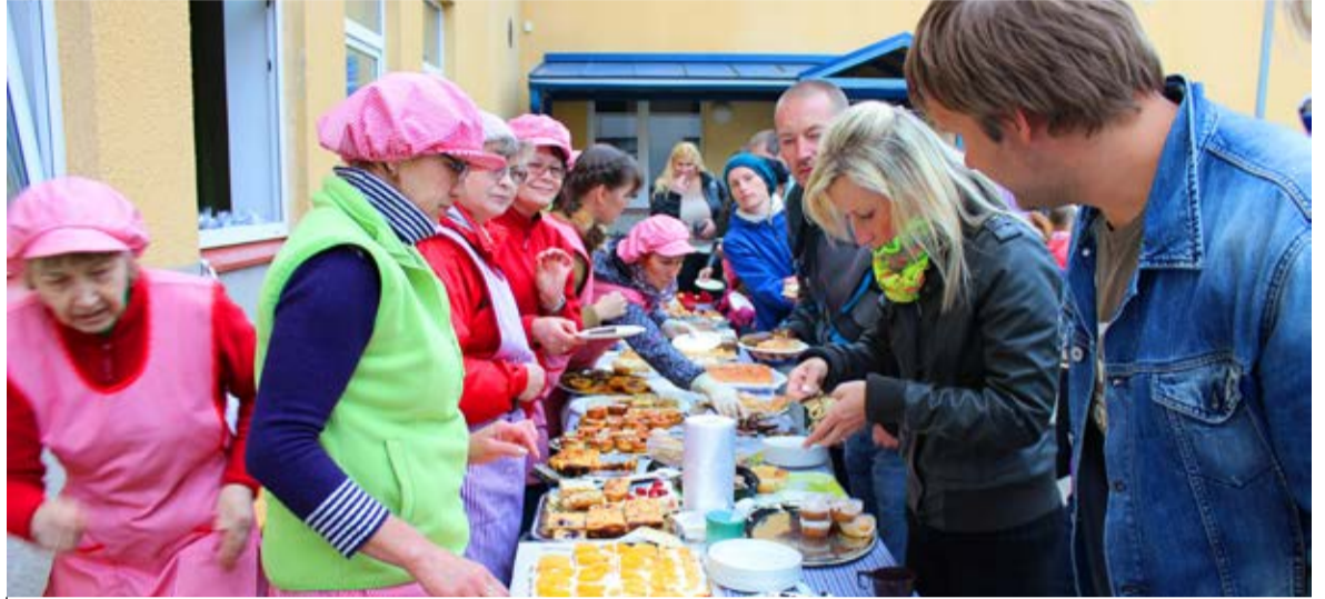
Ostjaid oli rohkesti ja kõik kookid said müüdnud

Et Saue lasteaia käib enam kui 400 last, oli kookegi palju. Enamasti müüdi ime-maitsvaid soolaseid ja magusaid küpsetisi tüki kaupa, aga eriti ilusaid tervetena. Ostjaid oli rohkesti ja kõik kookid said müüdnud. Lisaks läks kaubaks morss ja kohv.