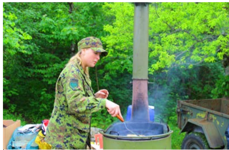
Kõik ristsõna lahendajad said võimaluse süüa Naiskodukaitse Saue jaoskonna naiste küpsetatud maitsvaid pannkooke