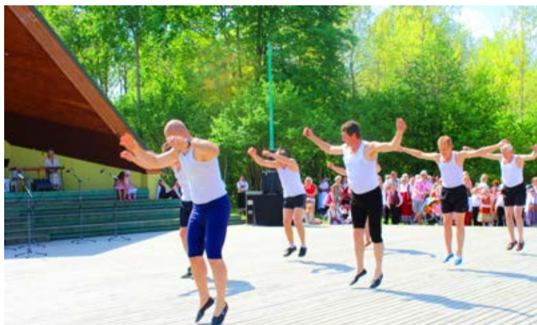
Saue Simmajate segarühma mehed tõid rahva ette meeleoluka võimlemiskava „Terves kehas terve vaim”