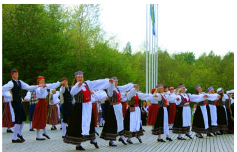
Pidu hakkab lõppema, kõik tantsijad on juba laval