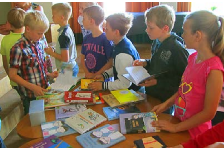
◇ Uued lasteraamatud pakkusid Saue õpilastele huvi