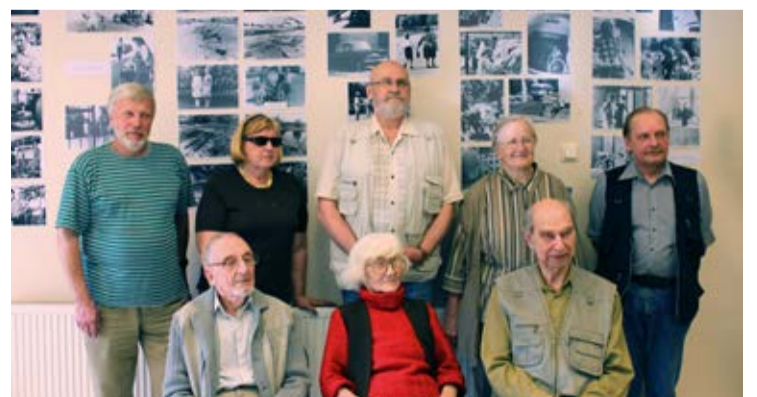
Näituse avamisele 20. mail tulid kutsutud külalistena ka toonased fotograafid.

Fotoklubide sõpruskohtumistest 1980. aastatel ja tänavusest Saue pildistamise päevast saab lähemalt lugeda sügise poole. Toonased ja tänased fotod, aga ka vaatajate äratundmisrõõm ning tähelepanekud on väljas Facebooki leheküljel Saue: aeg ja lugu ( www.facebook.com/saueaegjalugu/ ).