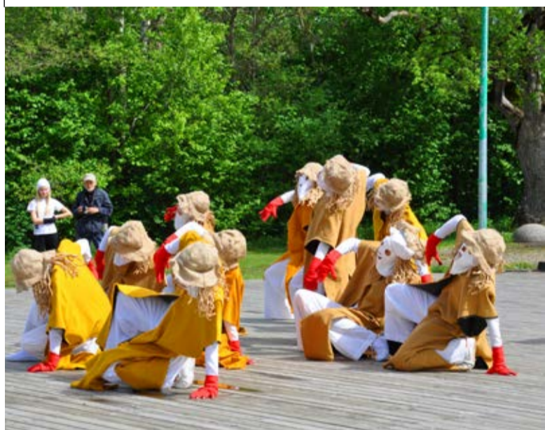
Esineb Showgrupp Vikerkaar