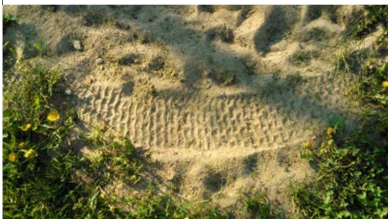
Jäljed maapinnal viitavad mootorrattale.