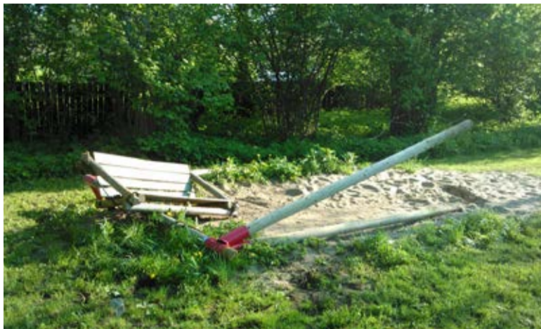
See on kõik, mis laste kiigest jaanituleplatsil alles jäi

Kui keegi nägi või teab, kes laste mänguplatsi hävitas, olge head ja andke teada kas politseile või Saue Linnavalitsusele. Heategu ei jää märkamata ja üheskoos on kergem kaakidest jagu saada.