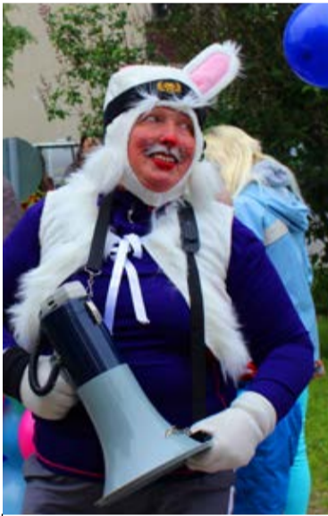
Kevadpeo juht oli vallatult sportlik Jänes

Midrimaa-pere tänab südamest kõiki kookiküpsetajaid ja -ostjaid ning soovib lastele ja vanematele ilusat suve, täis päikest, meelelahutust ja puhkust.