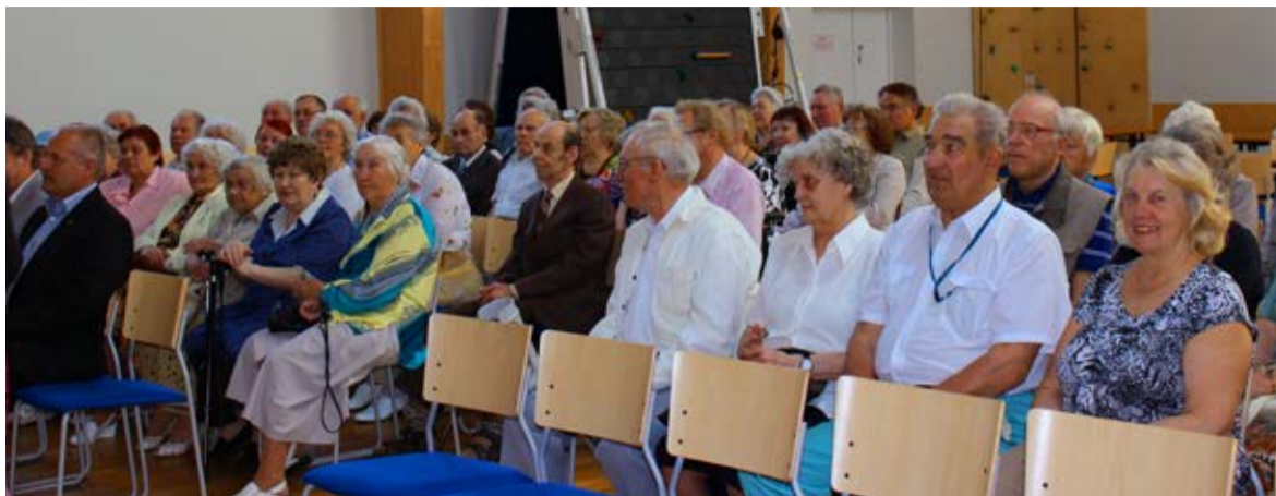
Maikuu kolmanda teisipäeva hommikupoolikul oli Saue Noortekeskus taaskord sünnipäevalaste päralt.

Sünnipäevalapsi tervitasid ning jagasid neile häid soove linnapea Henn Põlluas , abilin-