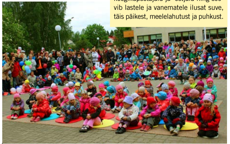
Pisut veel ja tants võib alata.