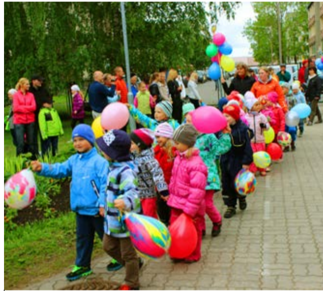
Rongkäik suundub lipuväljakule