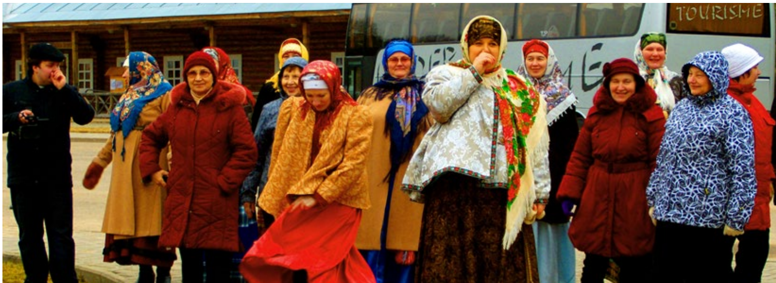
Vastlad on vene kultuuris tähtsal kohal. Endistel aegadel keetsid need terve nädala, igale päevale oli ette nähtud kindel tegevus. Mihhailovskoje talurahvamuseumis kaasasid võõrustajad Saue reisiseltskonna ulatuslikku vastlaprogrammi.

Pihkva on kindluslinn ja kirikute linn: seal on 27 kirikut ja neli kloostri. Algselt olid kloostriid ehitatud kivist ja puidust, hiljem üksnes kivist.