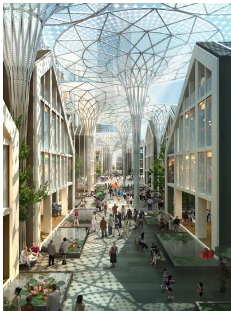
◊ Kolme rühma kollaažidel kattuv pilt, arhitektuurne visand linnatänavast.

Järgmisena saate keskusala uuendamisel kaasa lüüa 5. aprillil, mil esitleme kõigi töötubade, arutelude ja väljakäidud ideede põhjal koostatud keskusala visiooni.