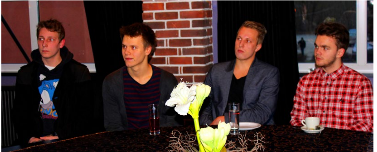
Üks osa Saue pauerist. Vasakult alates on unistuste kohaselt pildil tulevane ajakirjanik (juba õpib), visioonilooja, linnapea (õpib riigiteadust) ja arhitekt.