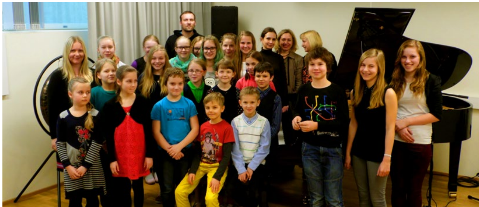
◇ Saue Muusikakool võttis osa üle-eestilisest noorte klaveripäevast „Kodumaine viis“. Pildil on nii need, kes pühendunult musitseerisid, kui need, kes hinge kinni hoides kuulasid.

Sellist erakordset koostegemise võimalust ei saanud kuidagi kasutamata jätta, seega ühineski suure simultaanmängimisega Saue Muusikakooli klaveriosakond. Kuigi üleskutse tuli suhteliselt lühikese etteatamisega ja valmistumise aega jäi väheseks, mängis meie kontserdil lausa 13 tubli noort pianisti. Kavas oli nii varasemat