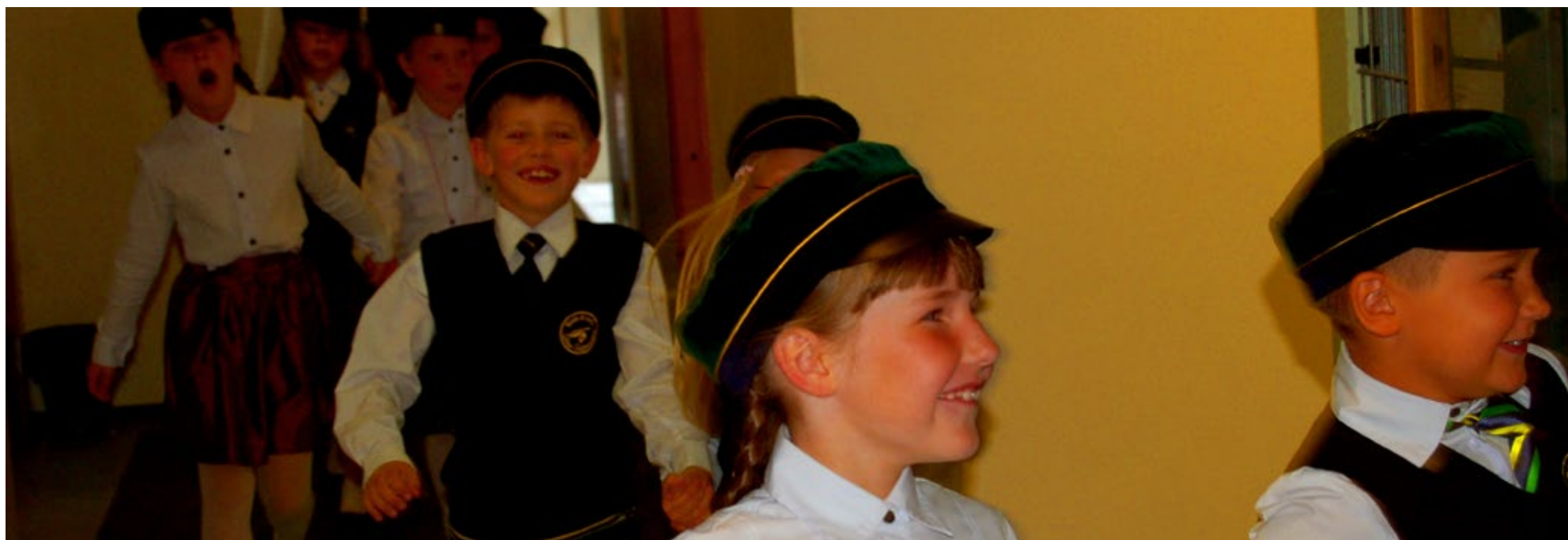
◇ Kindlasti alustavad sügisel Saue Gümnaasiumis õppetööd sama rõõmsad ja õpihimulised uued õpilased koos positiivsete ning koostöövalmis õpetajate ja lastevanematega nagu möödunud aasta sügisel.