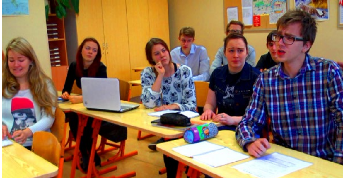
◊ Talendikonkursi reklaamid olid vaimukad. Hetk inglise keele tunnist, kõlab hitt „Words don't come easy to me“.

Gümnaasiumi võõrkeele-suuna õpilastel olid viktoriinid inglise keelt kõnelevate maade tundmises, samuti tegid kõik gümnaasiumiklassid sõnavara suuruse testi. Selle põhjal võib välja tuua keskmise sõnavara suuruse, näiteks 10. klassides umbes 7500 sõnaperet, 11. klassides