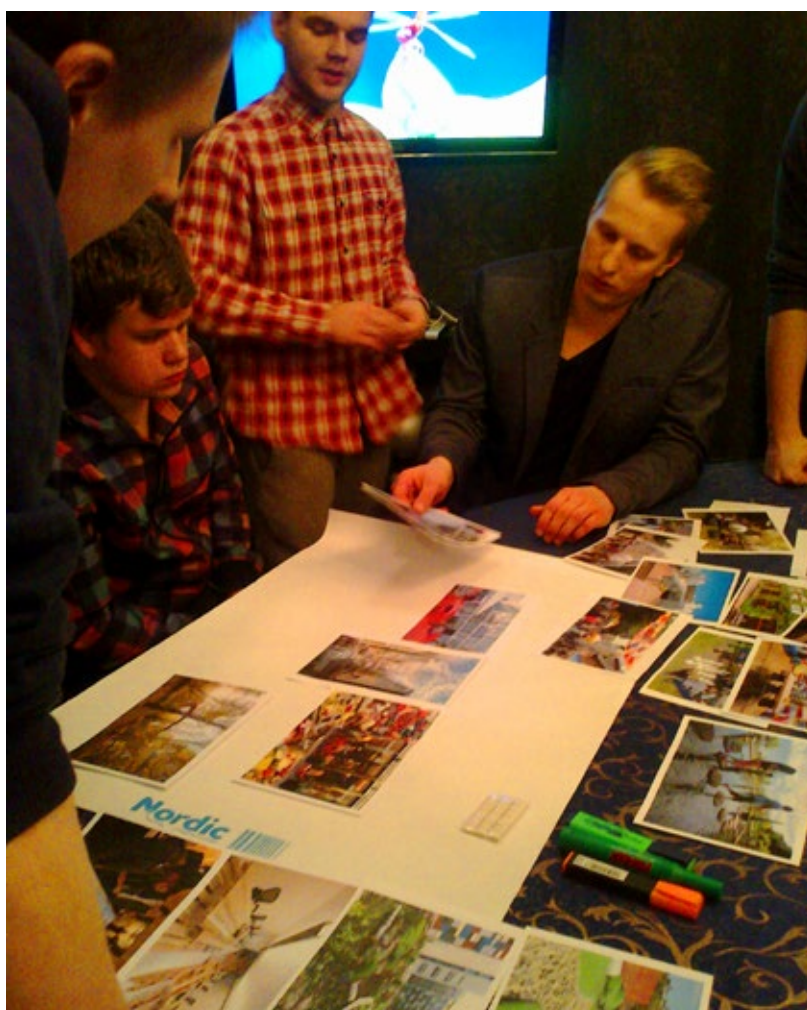
Valmib volikogulasteks ümberkehtastunud noorte kollaaž.