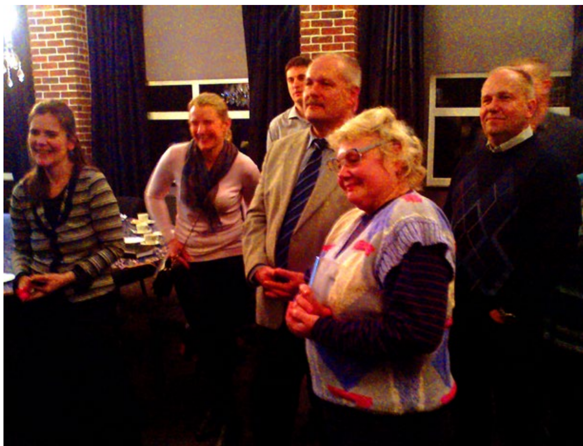
◊ Noorteks ümberkehtunud volikogulased lähtusid kollaaži luues just 18-23-aastaste vajadustest.

ajuragistamisi enne visioonidokumendi kokkukirjutamist. Töötoa korraldajatenal palusime noortel volikogu liikmeteks ümber kehtastada ning volikogulastel jällegi ajas tagasi minna ja end gümnaasiumi lõpetavateks noorteks kehtastada.