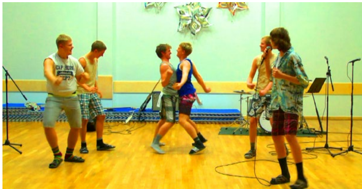
◊ 9.a klassi poisid astusid talendikonkursil üles venekeelse lauluga šokolaadist jänese-st, mille on siinmail kuulsaks laulnud Meie Mees