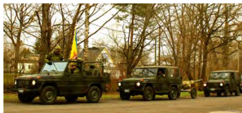
Et kaitseväge paraad Pärnus edasi lükkus, jõudis Saue kompanii lahingu- tehnika jalutuskäigule viivitusega.