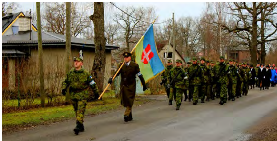
◇ Rahvas annab sõjaväele oma hinge, oma elumõtte, aated ja eesmärgid. Saue kaitseleitlased, naiskodukaitsjad ja noorkotkad Eesti Vabariigi 96. sünnipäeva auks korraldatud pidulikul jalutuskäigul.