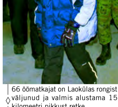
◇ 66 öömatkajat on Laokülas rongist väljunud ja valmis alustama 15 kilomeetri pikkust retke