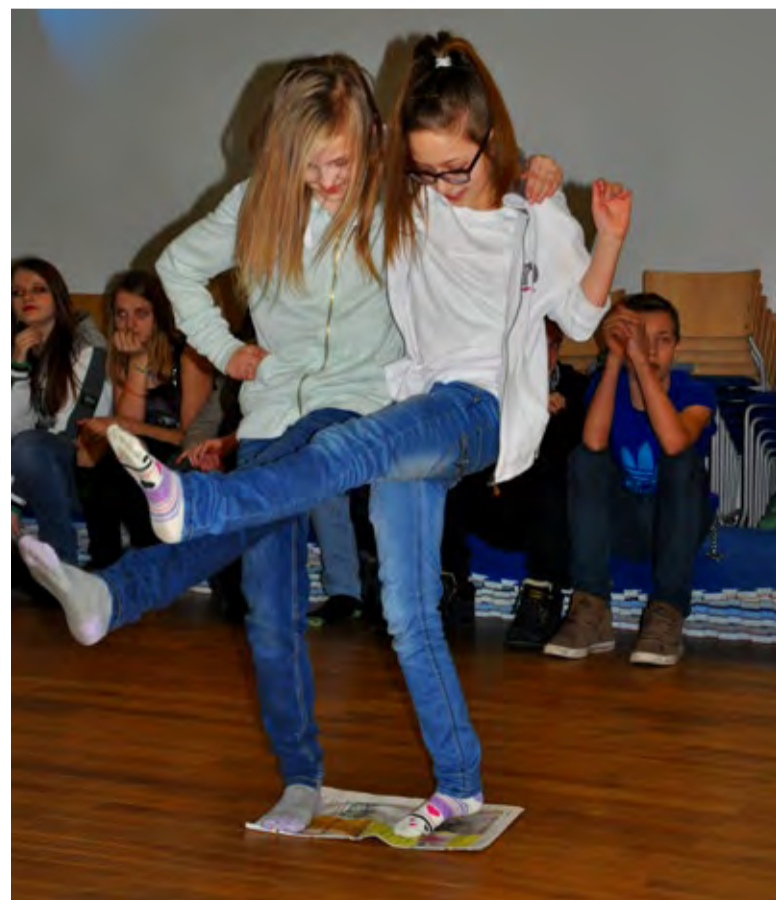
Noorteka sõbrapäevadiskolt ei puudunud ajalehetants