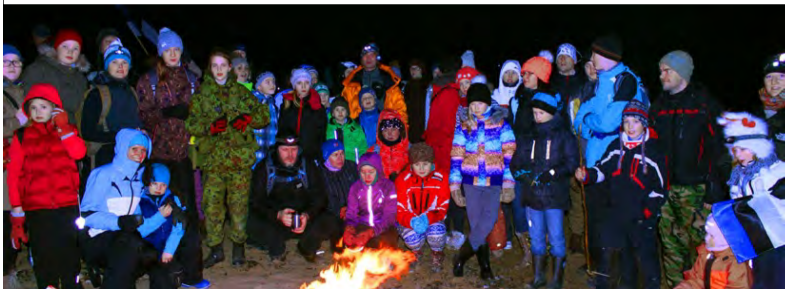
Öömatkajad on jõudnud vahepeatusesse, kus kosutasid keha hernesupi ja teega ning hinge Eesti hümniga