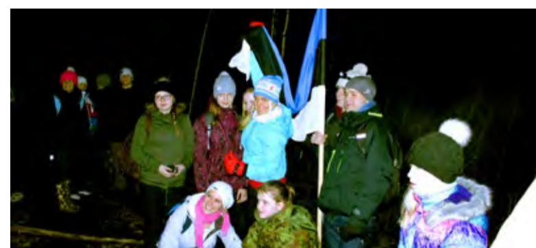
◇ Vahepeatus kottipimedas metsas, et viimaseid järele oodata