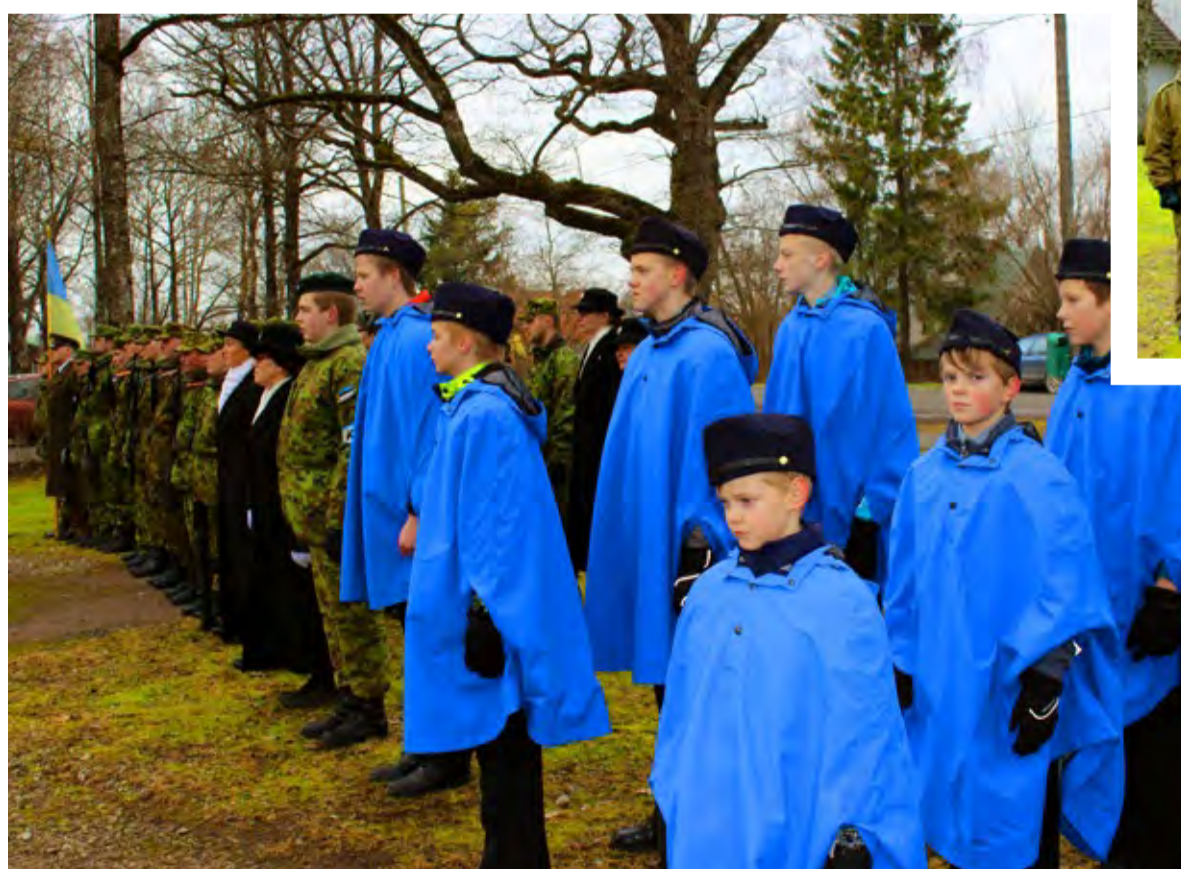
Tänavu osalesid pidulikul jalutuskäigul ka Saue noorkotkad