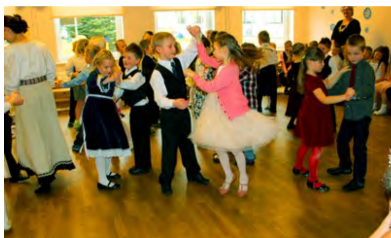
◇ Lastel endilgi tulid peotantsud toredasti välja