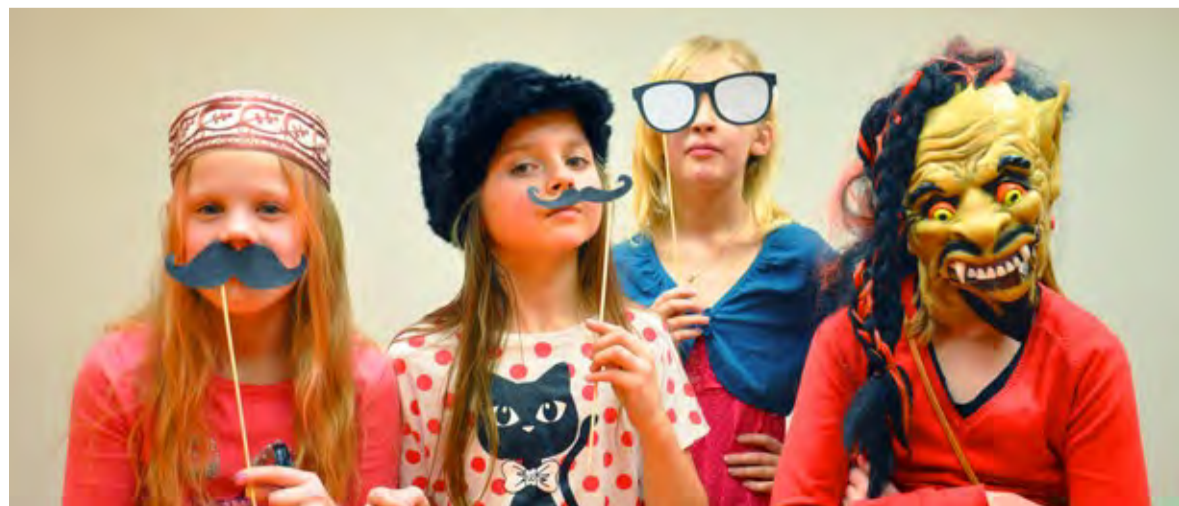
Kes soovis, tegi sõpradega lahedaid fotosid.

Teisel korrusel tegi Mari sõbradest professionaalseid sõbrafotosid ning Maria ja Kirke juhendamisel punuti sõbrale lemmikvärvides sõbrapaelu.