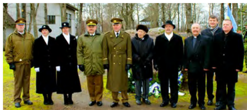
◇ Kaitseliidu, naiskodukaitse ja linnajuhid mälestuskivi juures