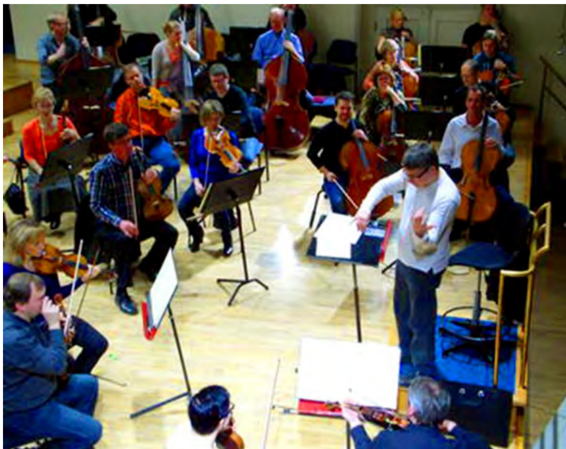
◇ Saue Muusikakooli õpilased käisid Estonia kontserdisaalis ERSO proovi vaatamas, dirigeeris Olari Elts.

Veel tuleb palju muusikat kuulata ja erinevaid teoseid tundma õppima. Suure tööta ei oleks ka Olari Elts sellisele tasemele jõudnud. Lõppeks tutvustas ta lastele esitatavat Viini klassiku Ludwig van Beethoveni 1. sümfoonia C-duur.