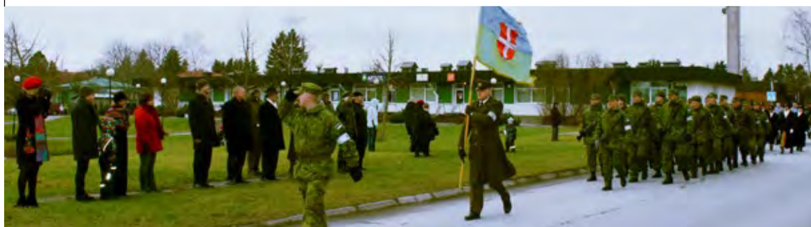
Linna- ja Kaitseliidu Saue kompanii juhid tervitasid paraadi Keskuse pargis.