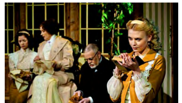
Hetk etendusest.

Piletid hinnaga 8 või 10 eurot on müügil Piletimaailmas ja Saue Huvikeskuses Saue koolimajas ruum 124 E-N 15.00-18.00 ja tund enne algust kohapeal.