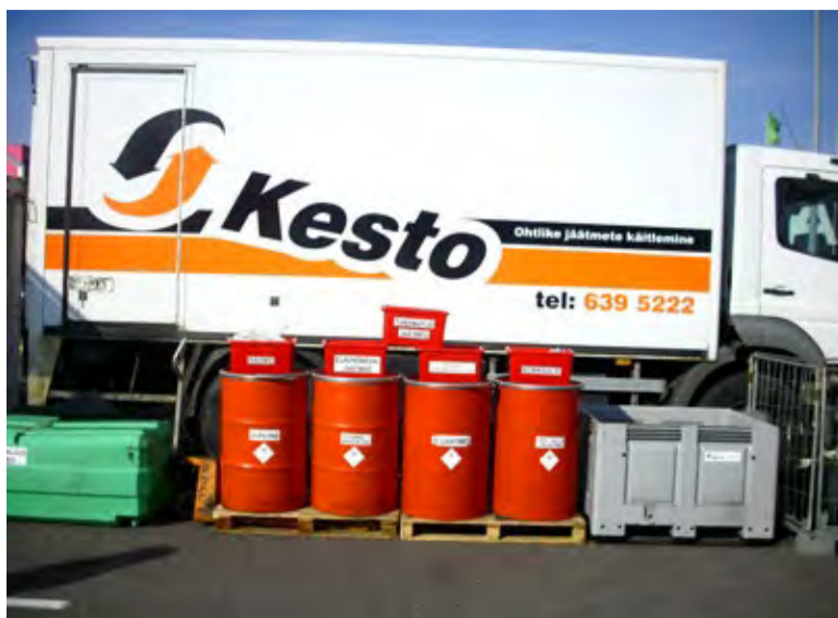
◇ Kesto OÜ põhitegevus on ohtlike jäätmete käitlemine.

Iga päev tekkivad kodumajapidamises jäätmed, mis kahjuliku toime tõttu võivad olla ohtlikud tervisele, varale ja keskkonnale. Teiste jäätmete hulka sattununa muudavad ohtlikud jäätmed kõik jäätmed ohtlikuks ja teevad jäätmete sorteerimise võimatuks. Lisaks jõuavad