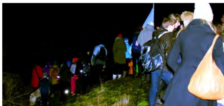
◇ Enne kui matkajad merekaldale jõudsid, tuli pankrannikust alla laskuda