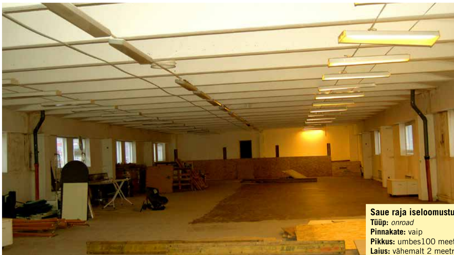
Siia, esialgu veel üsna kõledasse saali Saue onroad siserada tulebki.