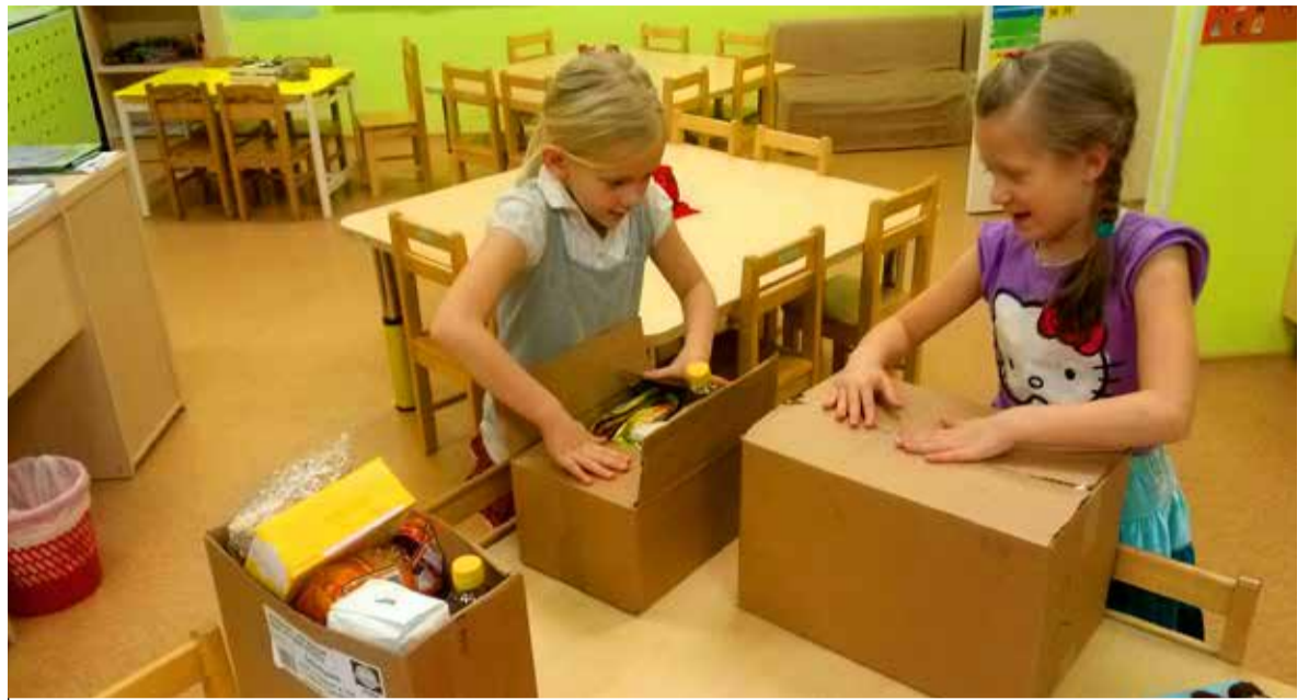
◇ Muumipere tublid tüdrukud toiduaineid jagamas.

Pooled toodud toiduainetest jagasid Muumipere lapsed kolme kasti ja need sai viidud soojade jõulutervitustega Saue Linnavalitsusse, kust need toimetati edasi