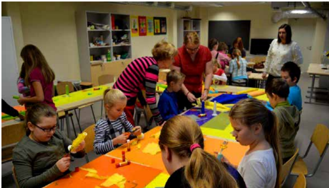
◊ Niimoodi need rütmipillid valmisid