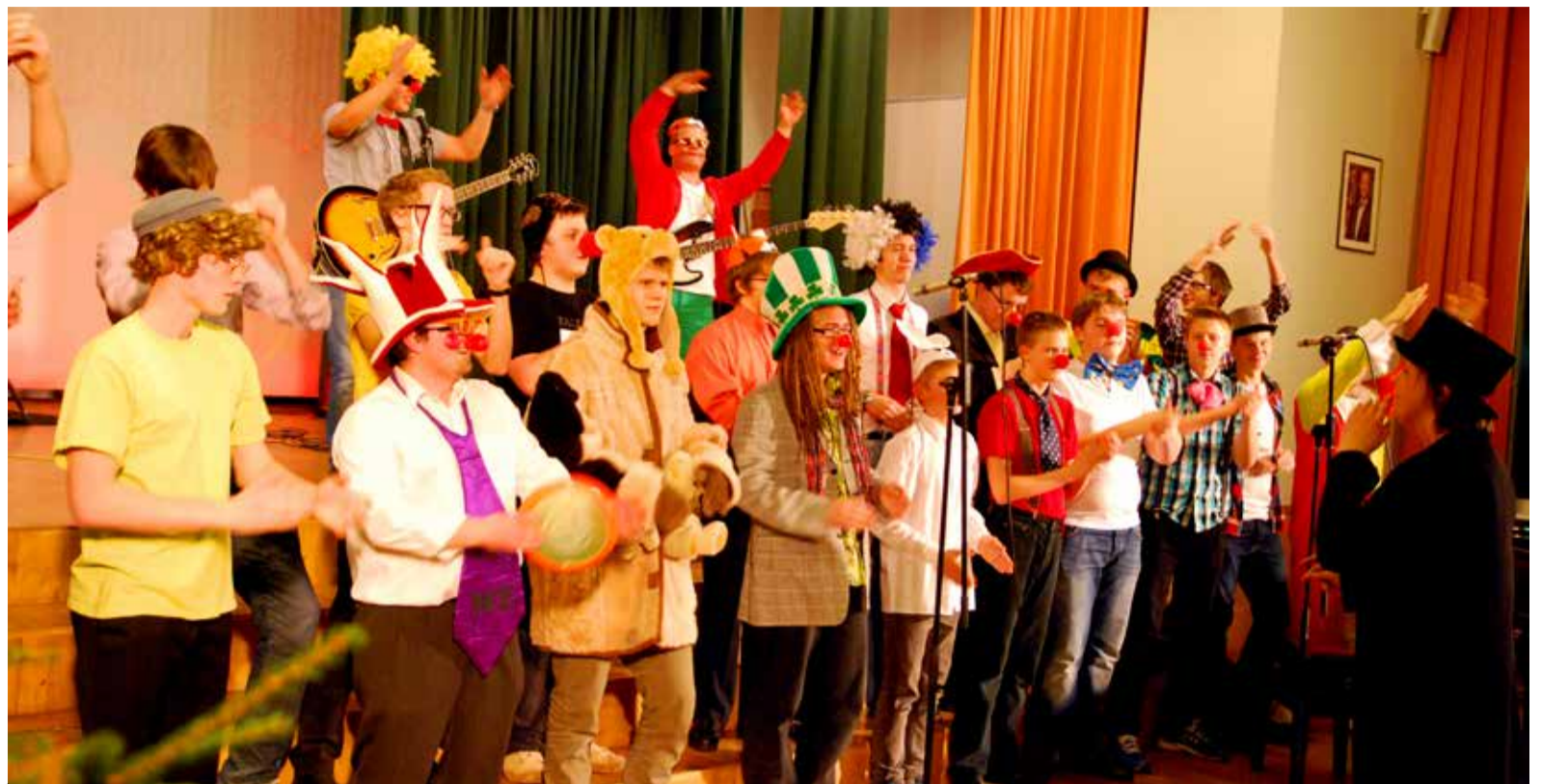
Kontserdile pani vahva punkti Saue Noorte Meeste Koor, kellega oli liidetud Saue Muusikakooli pop-jazz osakonna bänd

Ei puudunud Saue Poistekoor, kes esitas Elviira