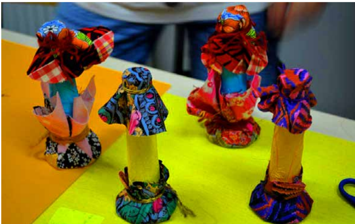
Ja sellised need rütmipillid välja kukkusid.

6. jaanuarist algas meil ringitöö juba sügisest tuttava tunniplaani alusel. Soovin uuel aastal kõigile õpilastele innukat huviringides osalemist!