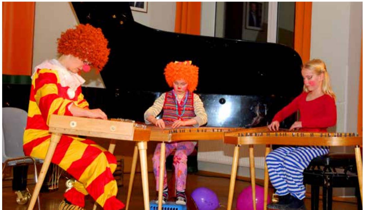
Laval võis näha värviliste parukatega kloune.

Lisaks kõrva paitava muusika mängimisele olid esitajate välimusedki erakordsed. Tundus, et tsirkusetemaatika sobis õpilastele ja ka õpetajatele. Pea kõik, kes laval üles astusid, olid kostüümid selga