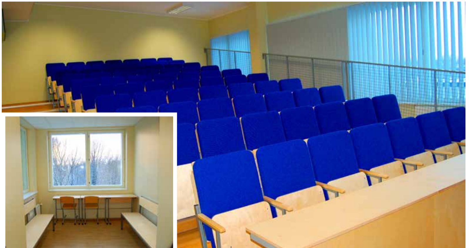
Mõlema korruse lõpetab hubane puhkenurk.

Kooli söökla laiendus ja huvikeskuse ruumid valmisid eelmise aasta 30. augustil, garderoobi-fuajee pealisehituse klassiruumides algas õppetöö 7. oktoobril. Lõpusirgele on jõudnud muusikakooli osa, selle avamine toimub 20. jaanuaril.