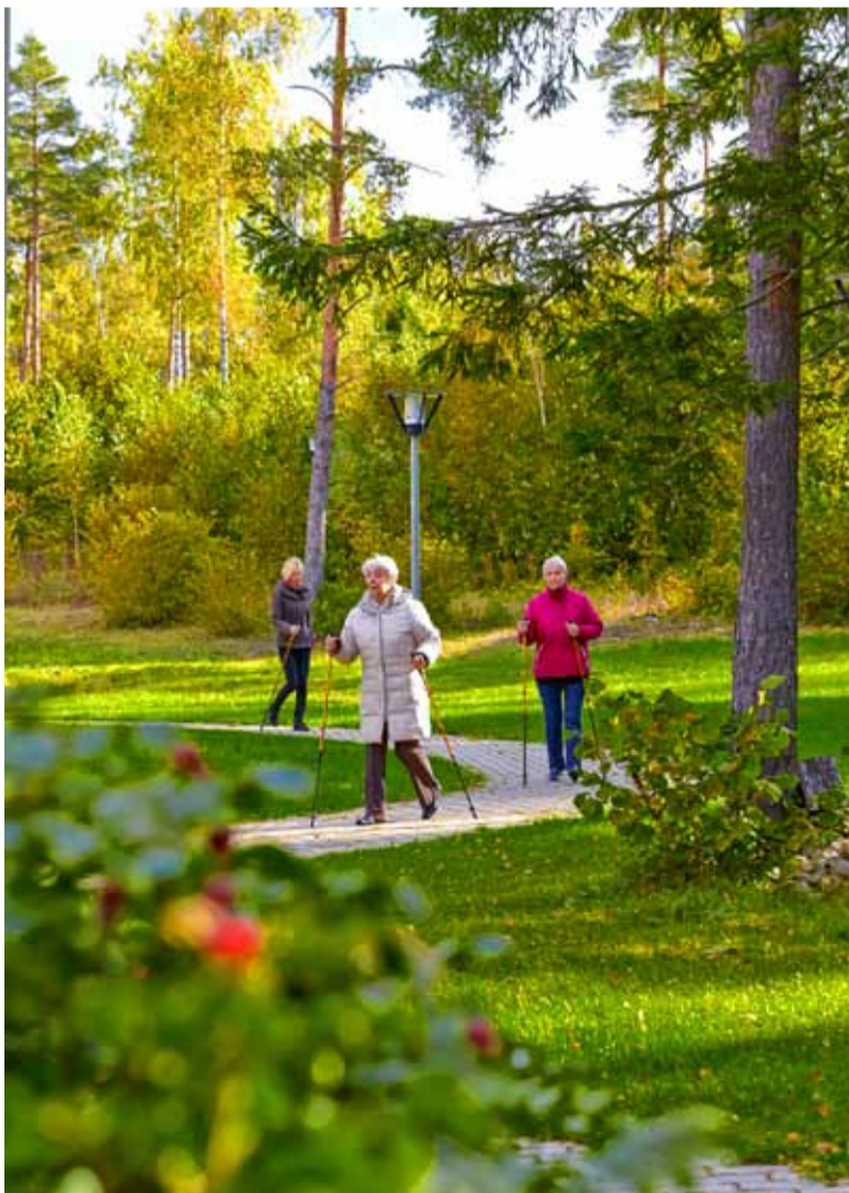
Looduskaunis ümbruses on hea muretut vanaduspõlve veeta.

Benita on moodsa sisustuse ja kõrgetasemelise teenindusega mitmekülgne majutus- ja tervishoiuteenuste keskus. Benitas tegutseb eakate kodu, taastusravi- ja rehabilitatsioonikeskus, hooldushaigla ja Eesti ainus invahotell. Benita asub Tallinnast 25 kilomeetri kaugusel Keila vallas Valkse külas kauni männimetsa keskel. Benita ning Pärnus asuv Wasa hotell ja taastusravikeskus kuuluvad MMG Ravikeskuse OÜ alla.