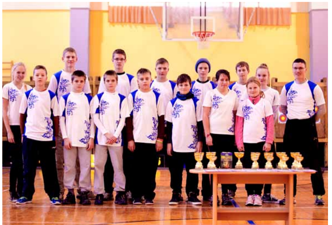
Vibuklubi Sagittarius noored edukad vibulaskjad: Foto: Maris Krünvald

Juba veebruaris 2014 toome Eesti vibulaskjad kokku Saue linna. Saue Gümnaasiumi võimlas toimub 2014. aasta esimene vibulaskmise tiitlivõistlus - Eesti sisemeistrivõistlused. Kahe päeva jooksul käib eeldatavasti võistlemas erinevates vibuklassides ja vanusegruppides kokku 150 osalejat.