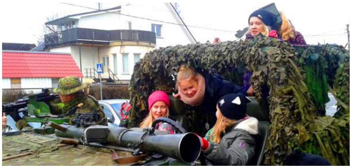
Pärast pakkide üleandmist oli lastel võimalus tutvuda kaitseväe tehnikaga.

Jääb vaid üle loota, et samamoodi vaimustavad meie kingipakid Afganistanis viibivaid sõdureid.