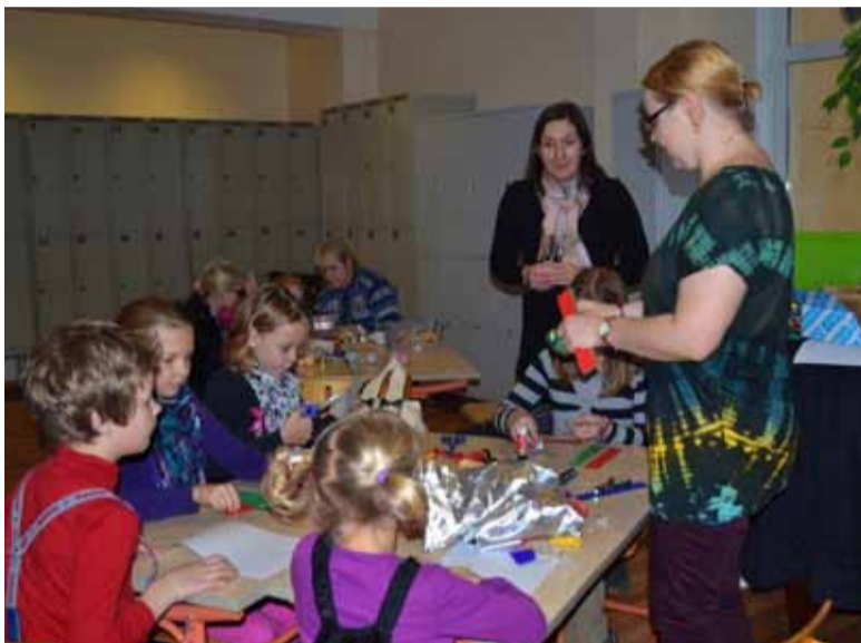
◇ Päkapiiku töötoas meisterdasid huvilised kaarte ja jõuluehteid.

Teadushuviharidus aga ei ole laste valikute hulgas. Selles osas leidsime Sollentunaga kiiresti ühise arusaamise, et selleks, et meil oleks piisavalt insenere ja teadlasi, peaks panustama ka teadushuviharidusse. Tõdesin, et meil on palju üksteiselt õppida ja koostöös areneda.