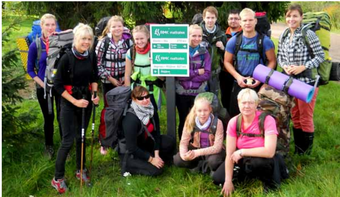
Seljaketid selga, koju jäägu sumadan ...

matkamine, kõndimine, väntamine või sport iseenesest. Selle eesmärk on tuua kokku erinevad inimesed, anda võimalus end proovile panna, õppida uusi teadmisi ja kogeda uusi elamusi. See on looduses ole-