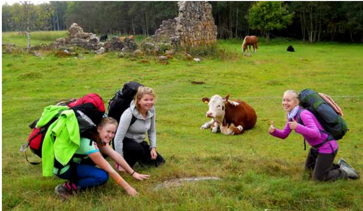
Teekonnal läbi Eesti tuli ette igasuguseid kohtumisi. Sel korral ei olnud õnneks paksu metsa ja vastu ei tulnud karusid, seljas mesitarusid, piibutobid suus