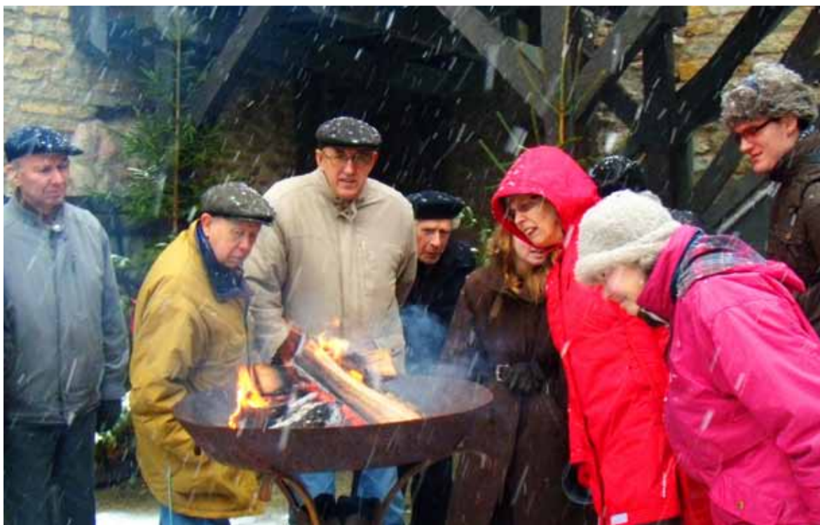
◇ Päevakeskuse reisseltskond jälgib Rakvere linnuse hoovil püüsirohu põlemist.

Esimesena külastasime Kolmainu kirikut, kus võttis meid vastu õpetaja Tauno Toompuu , kes rääkis kiriku saamise loost. Kiriku alguseks loetakse aastat 1400, see hävis Põhjasõja ajal ning ehitati taas üles. Praegu on koguduses liikmeid 300