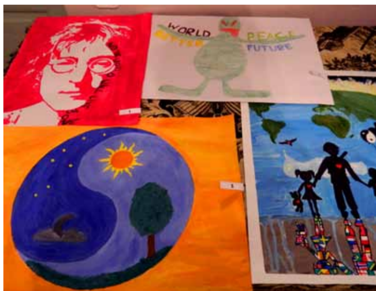
Osa LC Saue rahuplakatite konkursile esitatud töödest.

Aidu Ots LC Saue pressisekretär 2013/2014