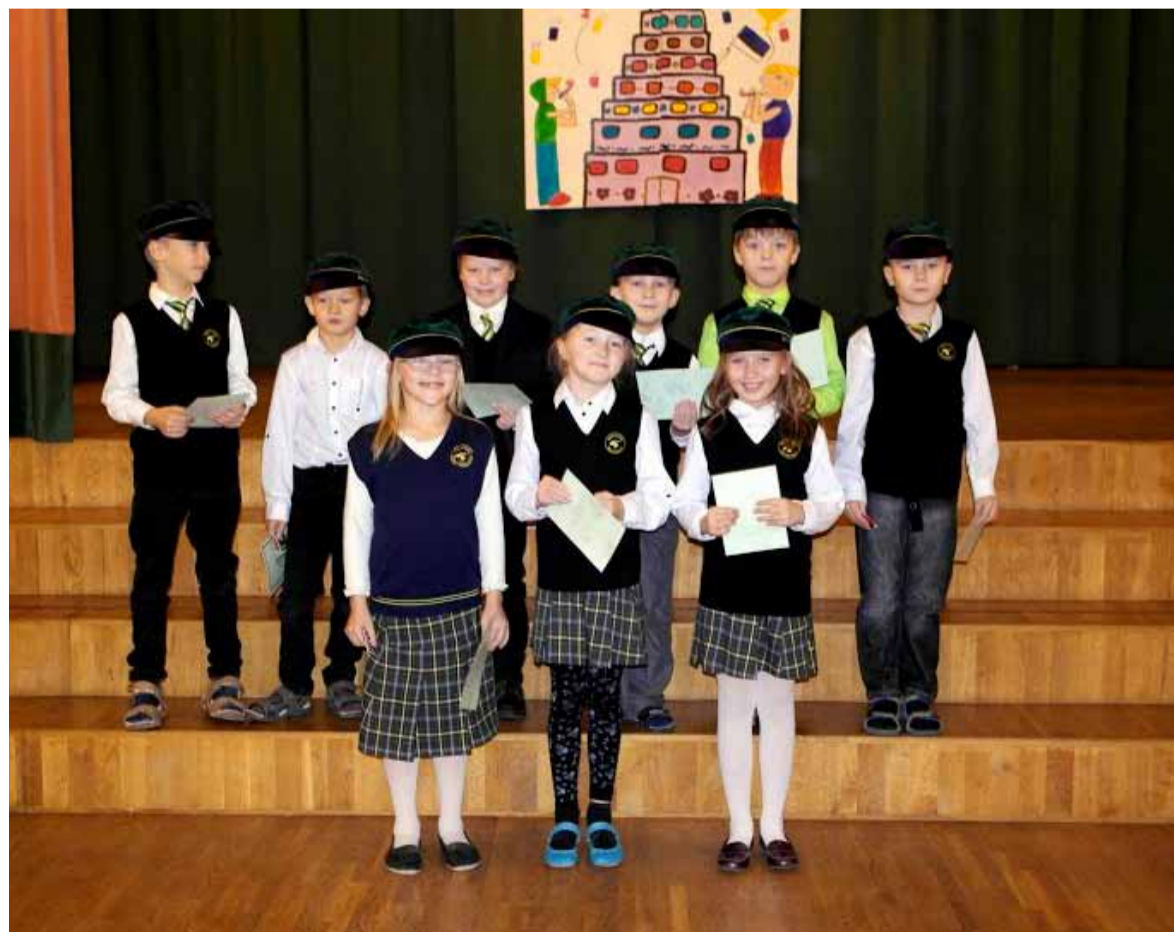
Tublimad matemaatikatundjad 1.a klassist.