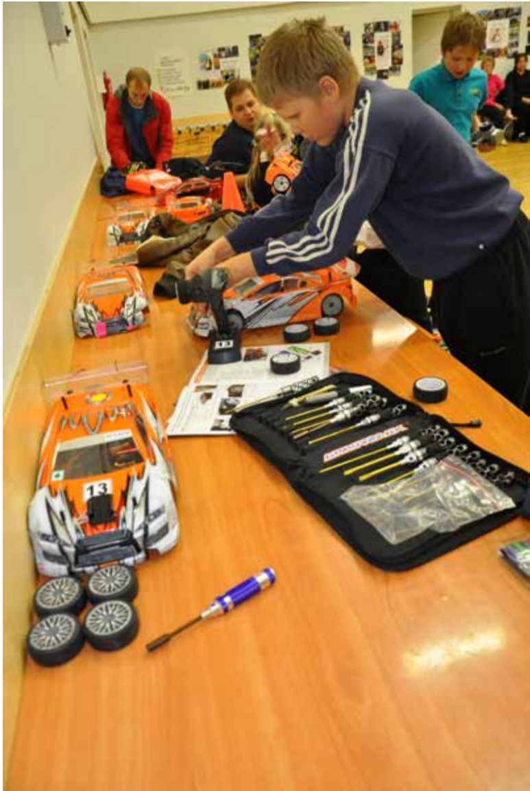
Neljapäeviti putitab noortekeskuses mudelid umbes kümme noormeest ja paar tüdrukut