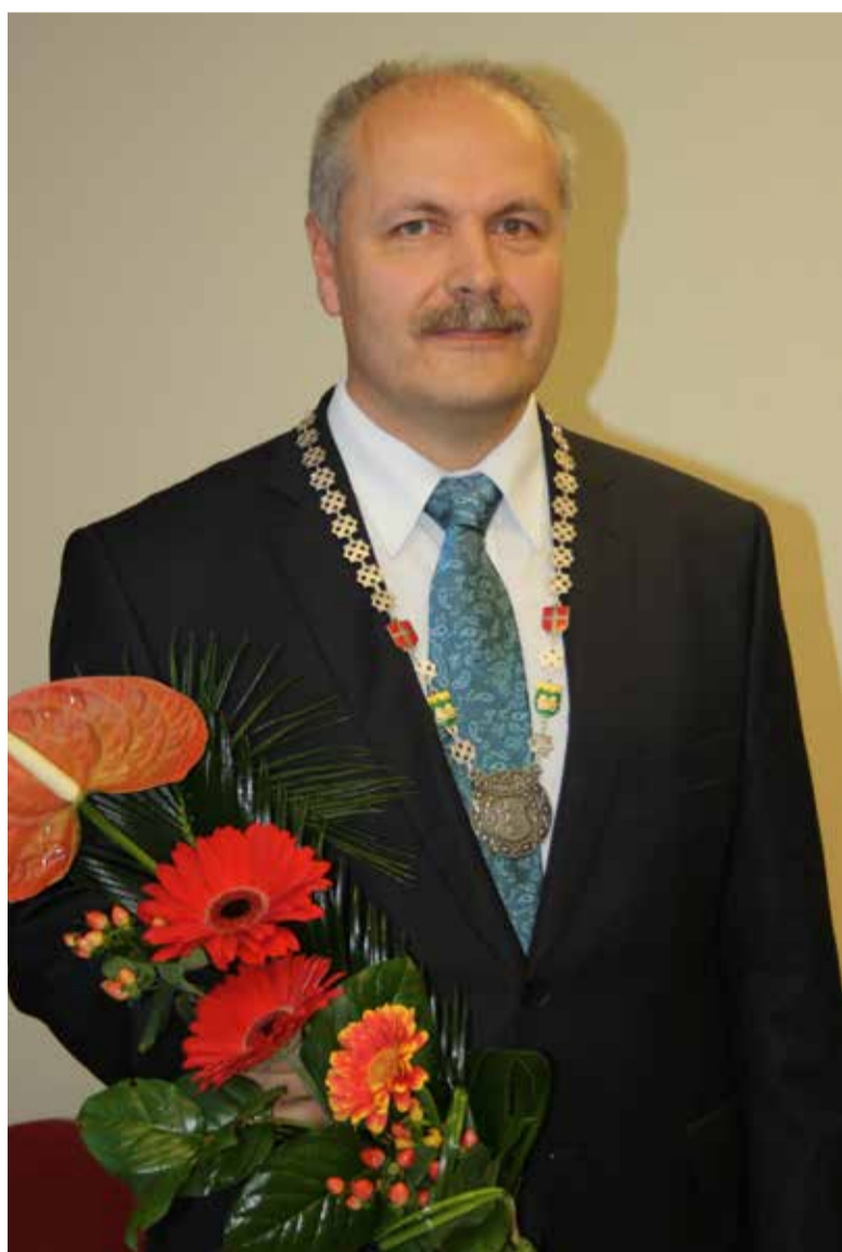
Linnapea Henn Põlluaas