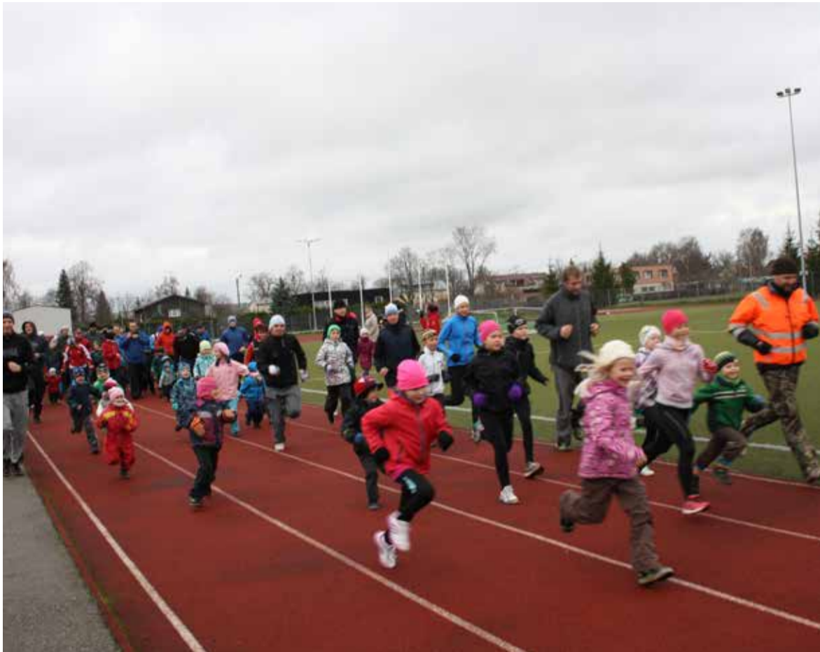
Isadepäeva jooksust osavõtjad läbisid staadionil neli ringi, lapsed kuni 10 eluaastat kaks ringi. Kõik said distantsiga hakkama. Pildistamishetkel juhivad noorem põlvkond.