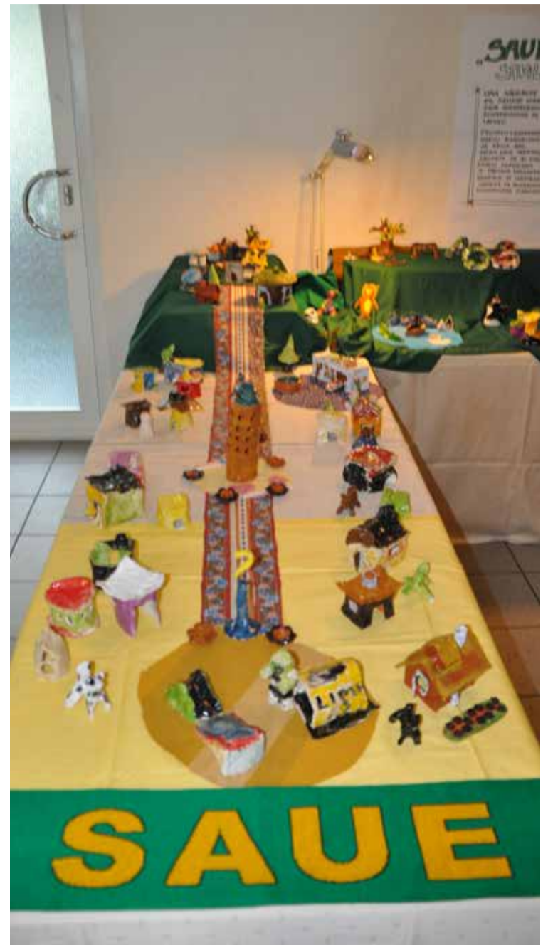
Noortekeskuse savilinn rändab ringi augustist alates, novembri lõpuks jõuab raamatukokku ja jõuludeks lasteaiada.

Oma tegevusele saime toetust Harju Maavalitsuse avatud noortekeskustele suunatud programmist. Rõõm on nüüd kutsuda Saue noori meie kunstiringidesse ja teisipäeviti avatud savituppa (kell 16.00-18.00),