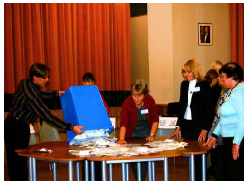
Kokku oli hääletuskastis 2114 kehtivat ja 22 kehtetut hääletussedelit ning 862 kehtivat e-häält.

Eesti Reformierakond 922 häält Valimisliit Kindlad tegijad 778 häält Erakond Isamaa ja Res Publica Liit 732 häält Eesti Keskerakond 304 häält Sotsiaaldemokraatlik Erakond 240 häält