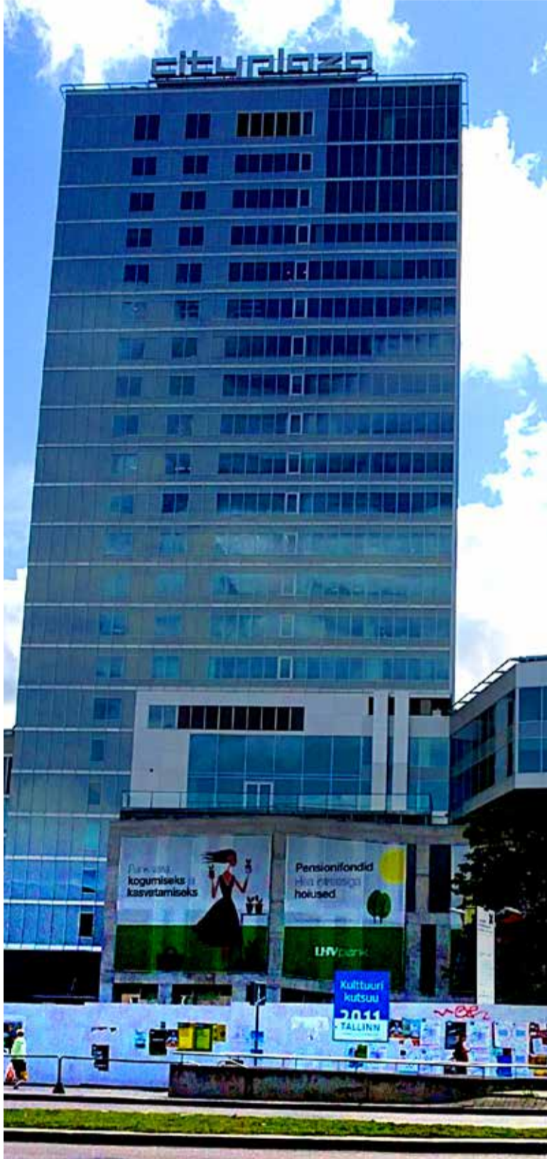
Üks Windoori suuremahulistest projektidest, City Plaza Tallinnas. Enamaga saab tutvuda ettevõtte kodulehel www.windoor.ee .

Silmapaiste on seegi, et Äripäeva müügiedetabeli esikümnes paiknev Windoor projekteerib ja valmistab 25