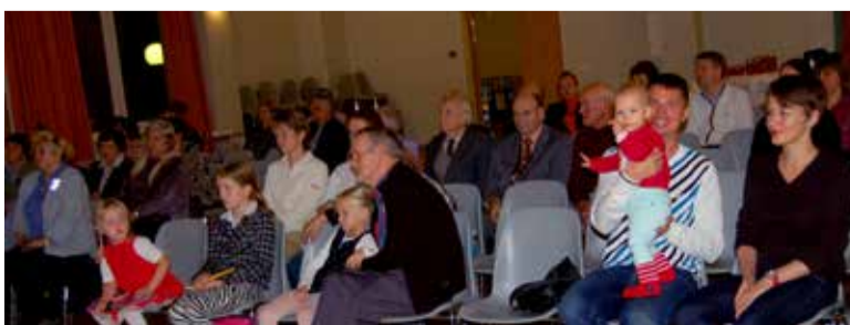
Esitlusel oli palju raamatu teokssaamist toetanud sauelasi. Ees perekonnad Tšerednik ja Madalik, kelle fotod raamatut ehivad.

Fotokonkursi parimad pildid leidsid kinkeraamatus „Linnas on ilu“, paljusid teisi saab imetleda rändnäitusel, mis hetkel on ülal kooli saalis ja raamatukogus. Edaspidi liigub näitus kaubakeskusesse ja mujalegi.