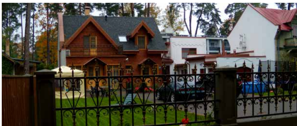
Jürjala on 57 tuhande elanikuga mereäärne linn, kus erineva ilme ja põneva arhitektuuriga uusi hooneid, aga linna üks suurematest uhkustest on puitmajade arhitektuur.

Jalakäijate promenaadil jäi kahel pool teed silma palju