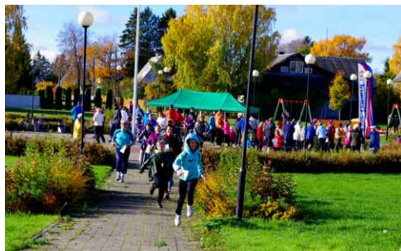
Start on antud.

Kohtumiseni sarja „Saelane liikuma” kolmandal etapil Saue Gümnaasiumi staadionil. Staadionijooks Isadepäeva-eri ootab kõiki isasid ja vanaisasid ning teisi spordihuvilisi starti 9. novembril kell 12. Lisainfo ürituse kohta huvikeskus.sau.ee .