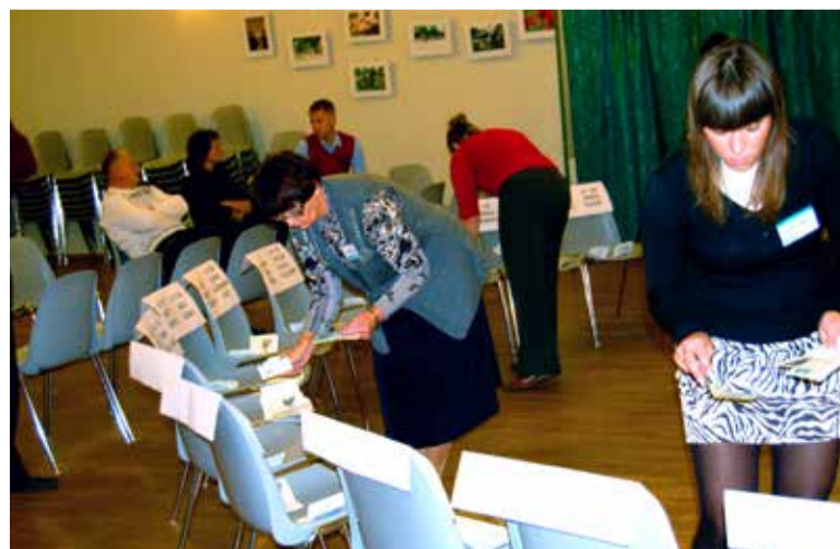
Jaoskonnakomisjon hääletussedeleid kandidaatide kaupa laiali jagamas.

Kokku oli hääletuskastis 2114 kehtivat ja 22 kehtetut hääletussedelit ning 862 kehtivat e-häält. Saue linnas jagunesid antud hääled erakondade ja valimisliitude vahel järgmiselt: