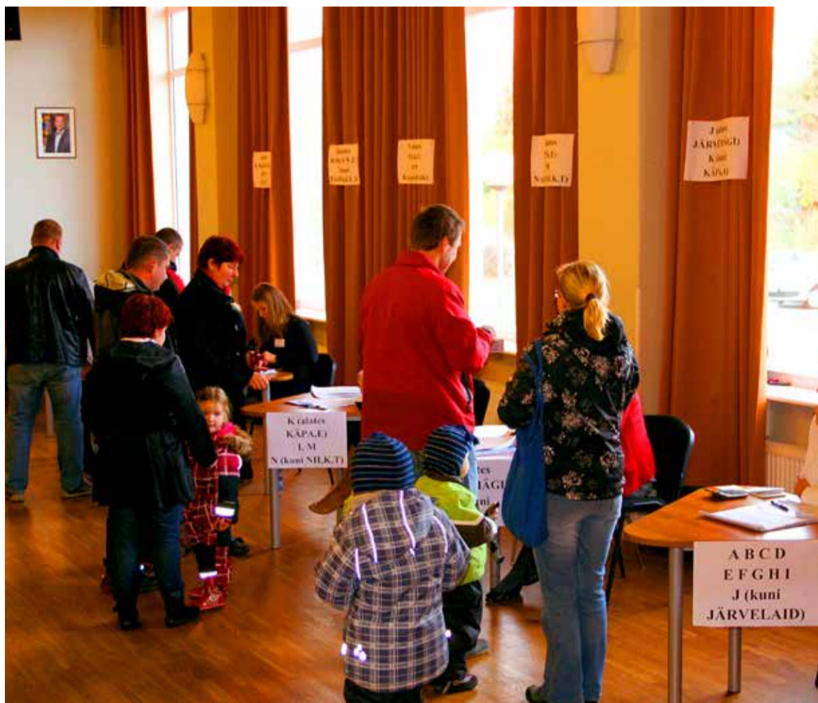
Valimispäeval käis Saue linna valimisjaoskonnas valimas 1586 kodanikku.

Tuuli Urgard Saue linna jaoskonnakomisjoni esimees