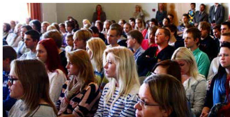
Esinejad nimetasid meie kooli õpilasi heaks ja vastuvõtlikuks publikuks.

Loe lähemalt ja vaata pilte ka Klassikaraadio koduleheküljelt: http://klassikaraadio.err.ee/klassik/ktk2013_uudis_1.html