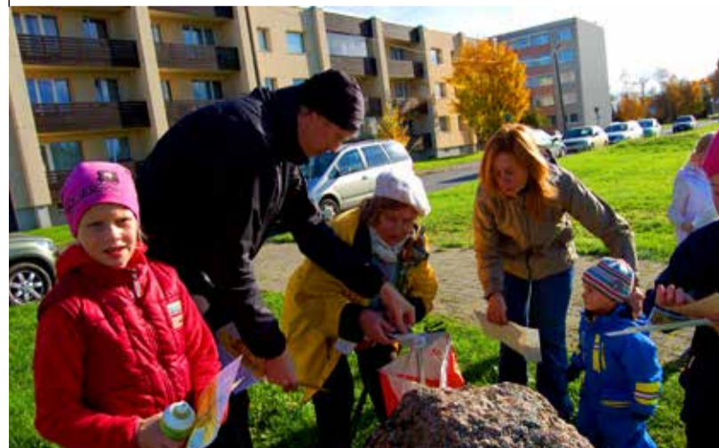
Üks kontrollpunktidest on leitud. Võistlejaid oli igas vanuses, kogu perega ja üksi, nii mõnelgi neist käsil elu esimene orienteerumine.

Sportliku orienteerumise sünnipäevaks peetakse Eestis 19. juulit 1926, kui Kaitseliit korraldas esimesed võistlused Pirital. See oli siis uus spordiala. Startis ei tahtnud keegi raisata aega kaardi vaatamisele ja nii eksisid paljud ära. Kes raiskas paar minutit, et maastik endale selgeks teha, tegi pärast selle aja mitmekordselt tasa. Kuna võistlus toimus Tallinnas, võis karta, et esikohad lähevad kohalikele, kuid paraku see nii polnud. Kuue sees oli küll inimesi Tartust, aga mitte ühtegi Tallinnast.