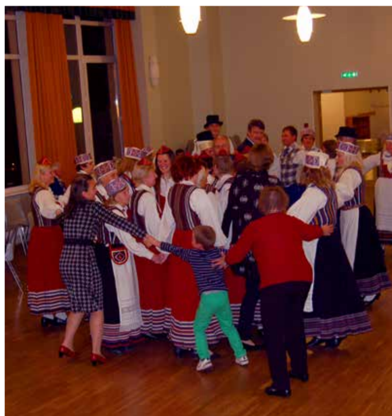
◇ Puntratants tuli ülihästi välja. Puntra moodustas ja harutas lahti Elena Kalbus.