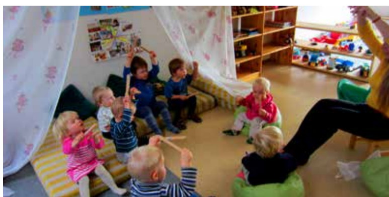
◇ Lustilas saab palju mängida, et õppida ise hakkama saama, mängida, et õppida suhtlema teiste inimestega, ja mängida, et olla lihtsalt laps.

Sarnaselt vanemaga olevale kiindumussuhtele tekib lähedane kiindumussuhe õpe-