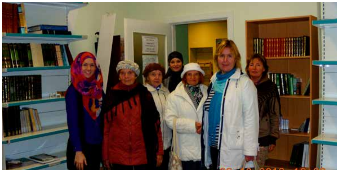
Sauelased lõpetasid islami kultuurikeskusega tutvumise raamatukogus.