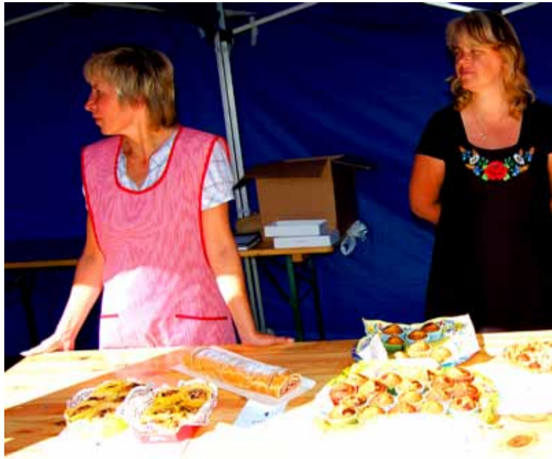
Heategevusliku koogilaada meeskond on tööks valmis