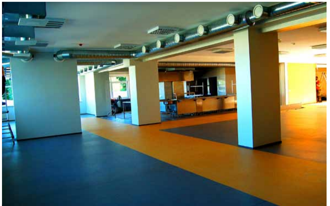
◇ 27. augustil oli kooli söökla laienduse ehitus jõudnud lõpusirgele.

Info telefonidel 6790180, 6790174, www.saue.ee , saue@saue.ee .