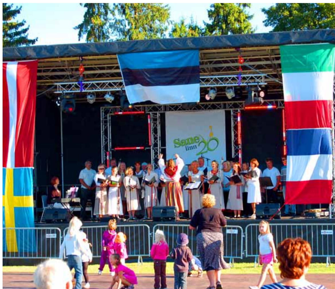
Keskuse parki kerkis lava, kus kontsert kestis kogu päeva. Esineb Saue Segakoor Elviira Alamaa juhendamisel.