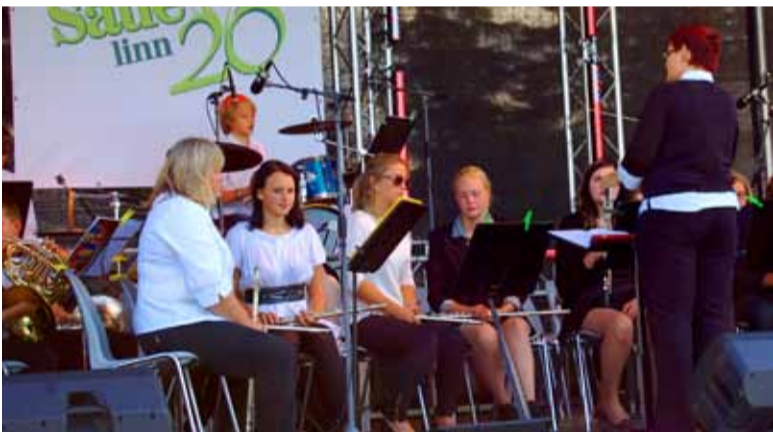
Peol astusid üles Harjumaa esindusorkestrid: Harjumaa Noorte Puhkpilliorkester, Harjumaa Keelpilliorkester ja Harjumaa Noorte Sümfooniaorkester