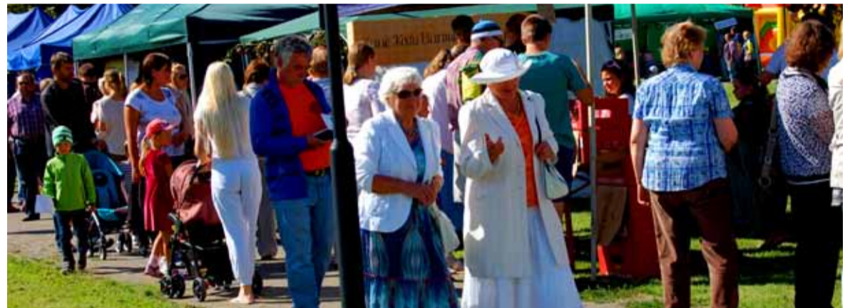
Keskuse park oli täis rõõmsat saginat ja melu. Külalisi oli päeval 1500 ringis, õhtust Smilersi kontserti kuulas ligi 3500 inimest