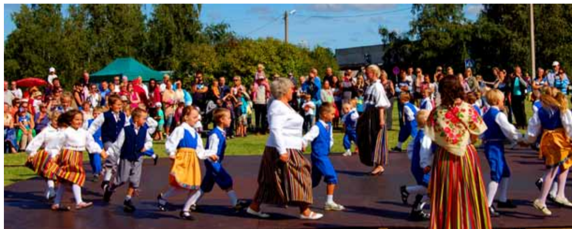
Peo noorimad esinejad olid Saue lasteaialapsed