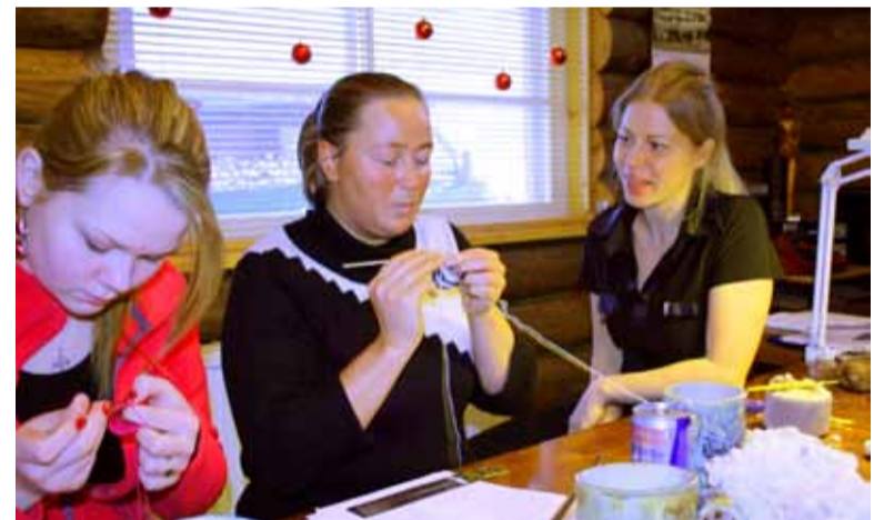
◇ Amigurumi heegeldamise õpituba