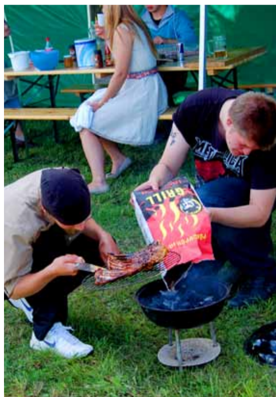
Searibid pole vist veel valmis, arutleb Saue Grillmeister 2013 võistlusel osalev võistkond pannile süsiliisades