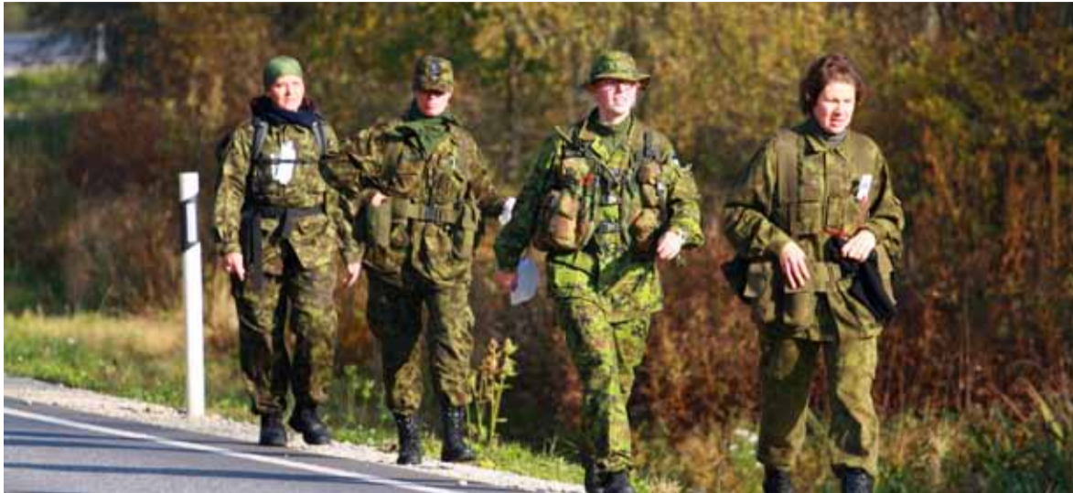
◇ Sõdurioskusi kinnistamas NKK koormusmatkal