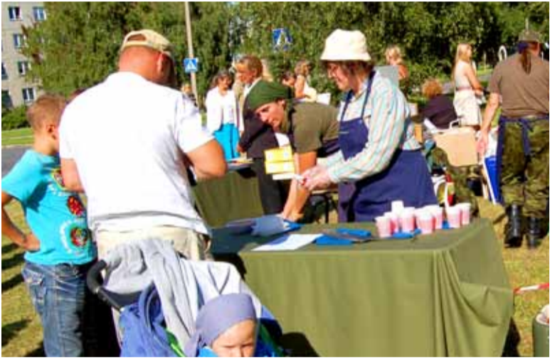
Kaitseliit, sõjaajaloo klubi Front Line, Naiskodukaitse ja Noorkotkad ehitasid üles terve linnaku, kus sai tutvuda relvade ja tehnikaga, läbida takistusriba, süüa sõdurisuppi, osa saada sõjaajaloost ja lüüa kaasa teisteski põnevates tegevustes