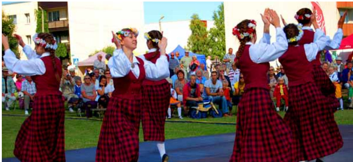
Läti sõprusvalla Inčukalni noored tervitasid sauelasi Karjapoisi (läti keeles Govju kazaks) tantsuga.