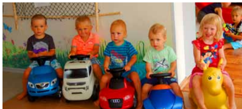
◇ Tähelepanu, valmis olla, start - kes auto, kes hobusega.

2009. aastal avatud Naerupalli päevahoiul algas viies hooaeg sellesamas Tõkke tänava äärses lapsesõbralikus majas, mis just päevahoiu vajadusi arvestades kavandatud ja kus kohti kümnele mudilasele - kõik kohad ka täidetud. Päevahoiu juhataja Signe Laar , kes isegi aktiivselt kasvatajatööd teeb, ütleb, et kvaliteetsel laste