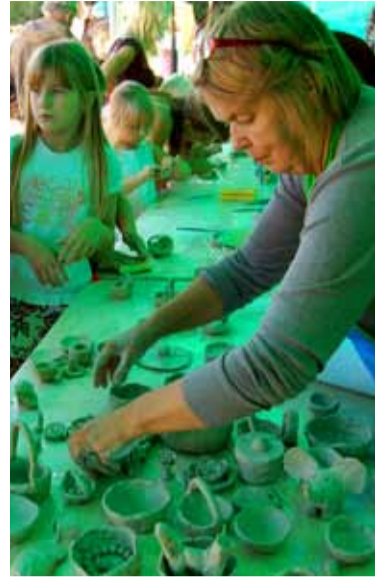
Päike kinkis huvikeskuse savi töötubades meisterdajaile põnevaid rohelisi varjundeid