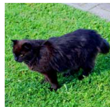
See must kass - peoplatsi peremees ja ühtlasi esimene külaline - urises vahepeal segadusesatunult: nii palju rahvast iga päev tema maadele ei satu