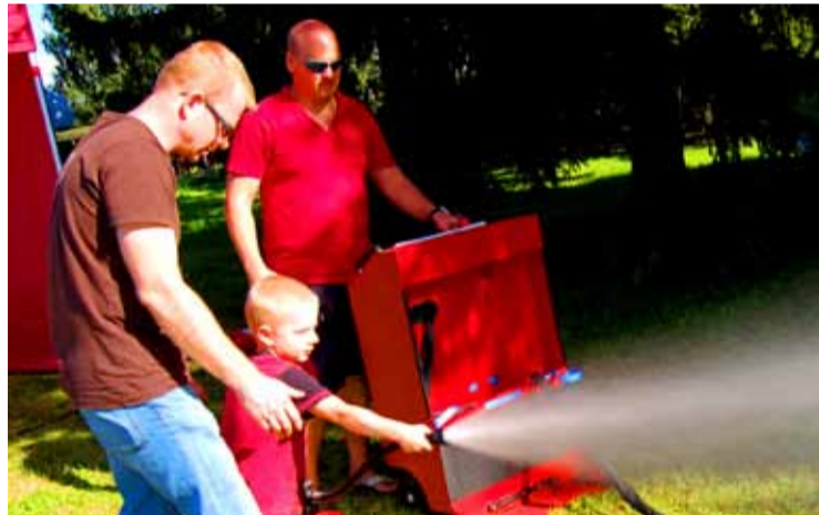
Vabatahtlikud päästjad juhendasid, kuidas tuld kustutada