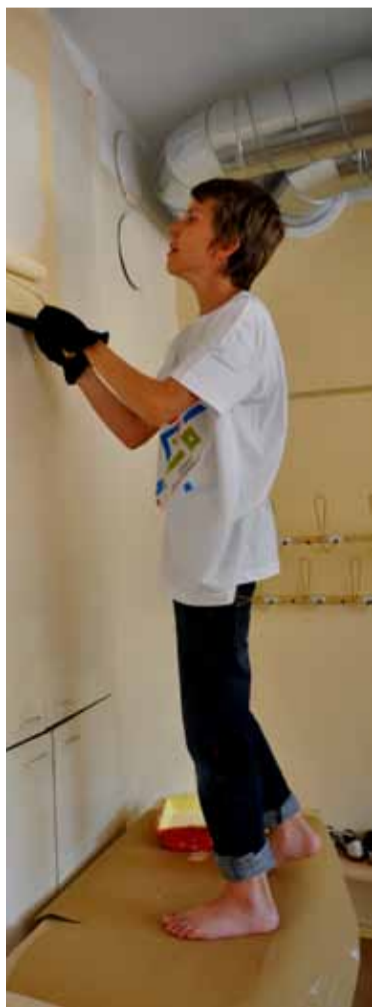
Ranno koolimajas maalriametit proovimas.

Veelkord suur aitäh toetuse eest kõigile, kes Saue töömalevaga sel aastal koostööd tegid ja suur aitäh ka tublidele osalistele. Järgmise suveni!