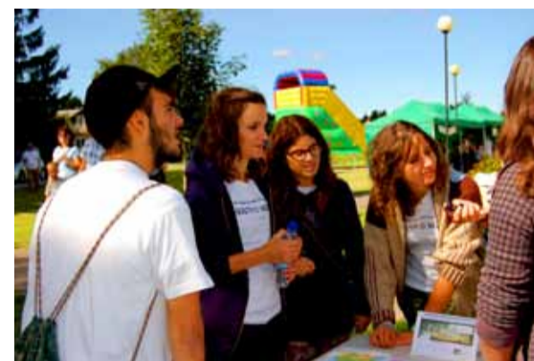
Linnal on augusti lõpuni külas noored Saue sõprusomavalitsustest, kes osalevad rahvusvahelises noortevahetusprojekti Health is Wealth (Tervis on rikkus)