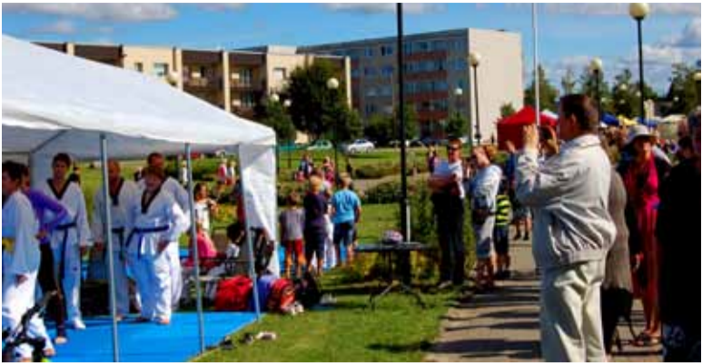
Saue Taekwondoklubi etteasted äratasid sünnipäevakülalistes elavat huvi