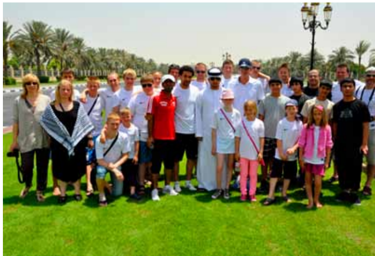
Saue Taekwondoklubi suvelaager oli tänavu 20. juunist kuni 4. juulini Araabia Ühendemiraatides Dubais Sharjah klubis.

Badri sõnul oli laager Dubais midagi enam kui pelgalt treeninglaager: see andis võimaluse tutvuda teise maa kultuuri, aja-