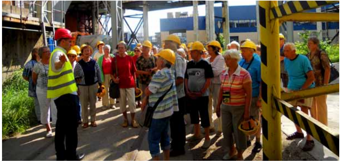
◇ Tänavune keskkonna-alane õppereis sai alguse Iru elektrijaama Jõelähtme jäätmejaamast.

Saturini kodu omanik on Ukraina päritolu ärimees, kes paistis silma külalislahkusega. Kuna ta ise ei saanud tulla meid tervitama, palus ta seda