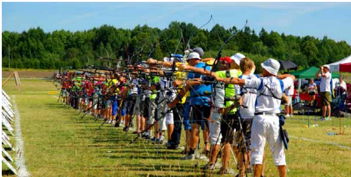
Vibuklubi Sagittarius korraldas Jõgisoo vibuväljakul 52. Eesti meistrivõistlused vibuspordis. Osalejaid oli ligi 80 ja esindatud olid kõik vibuklassid.

Finaalis andis Järvakandi VK Ilves meeskondlikult kõva