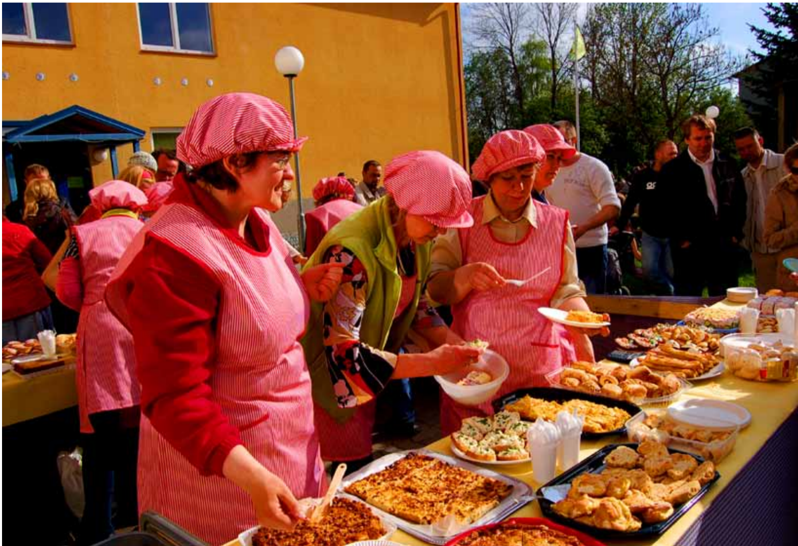
Saue lasteaia koogilaada (pildil) eeskujul on Saue 20. sünnipäeva keskmes heategevuslik küpsetiste laat ühes kauneimate sünnipäevatortide võistluse ja oksjoniga. Linn soovib küpsetiste müügist saadud tuluga ellu kutsuda projekti mälestusmärgi püstitamiseks Saue rongipeatuse rajajatele.