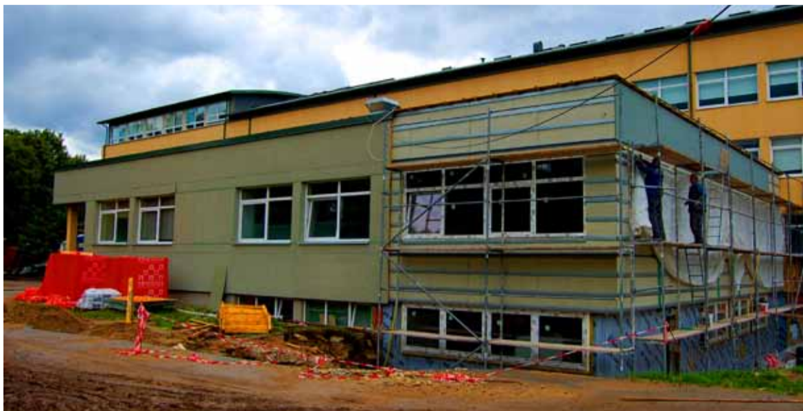
◇ Söökla laiendus saab valmis 20. augustil, kuid tagavaratrepi valu teostatakse 29. augustiks.

Gümnaasiumi edelatiiva kelder oli täis kokkupaakunud savi-kivi pinnast, mitte projektikohast liiva, mida oli vaid moe pärast peale raputatud. See venitas keldri tühjendamise paarilt päevalt enam kui nädala peale, sest suure tehnikaga ei olnud võimalik keldris tööd teha. Täna enam seoses vana osaga ootamatusi