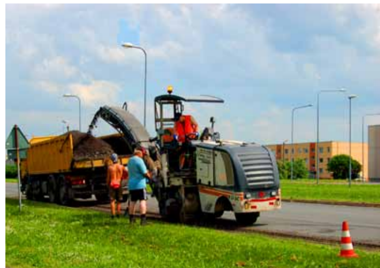
OÜ Üle alustas talvega tekkinud aukude lappimist, freesimistööd Kuuseheki tänaval kaubakeskuse juures.

Rõõm on aga tõdeda, et ÜVK-järgne tänavate ja haljastuse taastamine on jõudnud lõpusirgele. „Enamus tänavaid-muruplatse on taastatud, jäänud on veel mõned üksikud vaegtööd. Tänavatele uue katte laotamisel on need