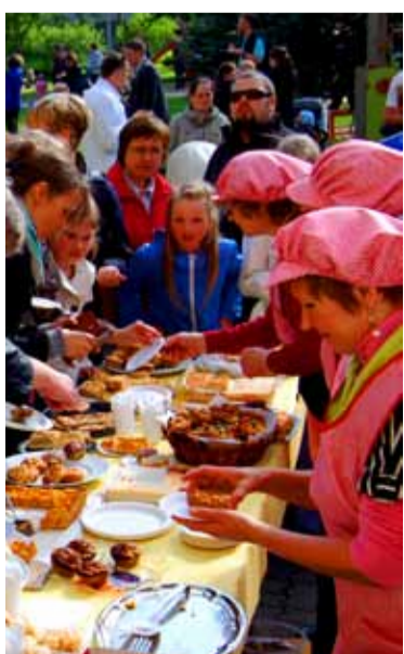
Ostjaid oli rohkesti ja kõik koogid said müüdnud