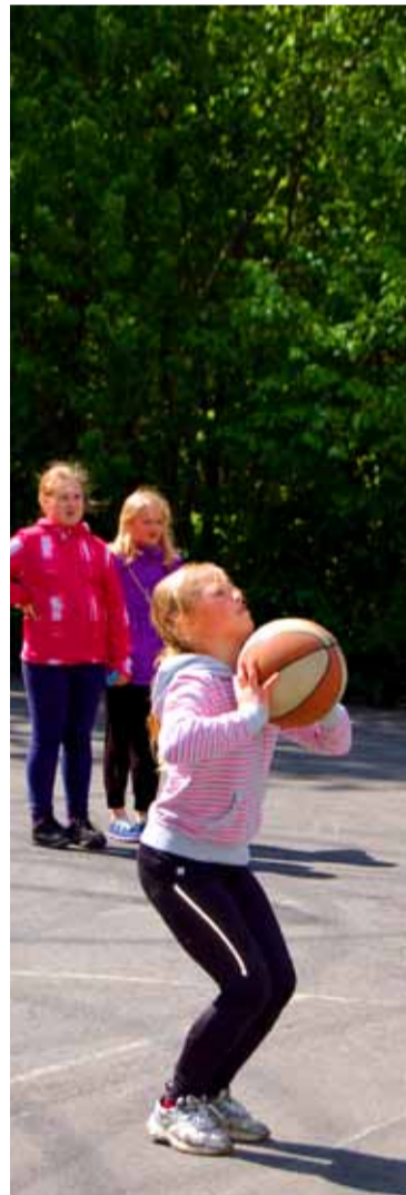
Korvpalli vabaviskevõistlus oli populaarne