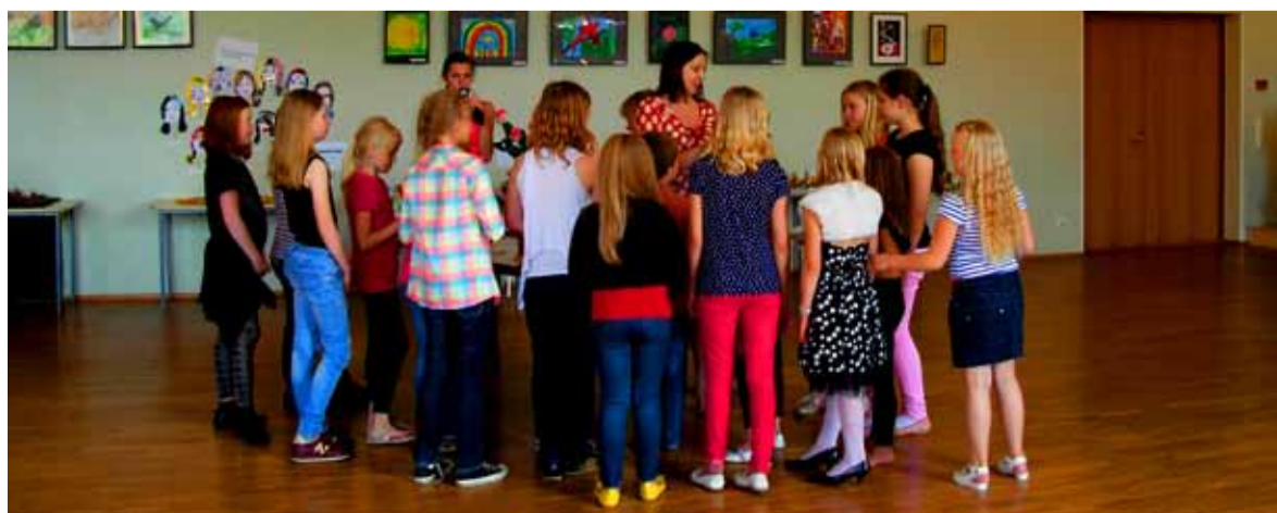
Huvikeskus jagas tunnistusi.

Saue õpilaste saavutustega saate tutvuda linna kodulehel www.sau.ee uudiste rubriigis ja Facebookis.