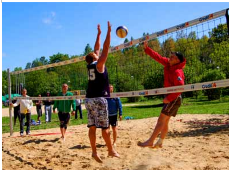
Rannavõrkpall pakkus palju põnevust. Pildil ründamas võitjavõistkond AFO

Miilijooksus oli neli starti, iga jooksu kiiremat naist ja meest autasustati karikaga. Osavõitjaid oli igas vanuses, kõigile oli üks miil jõukohane.