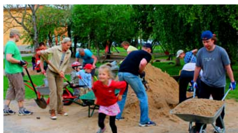
Talgulised vedasid kahe ja poole tunniga laiali neli autokoormatäit liiva.

oli aega tulla taas lasteaiale appi. Täname meeldiva koostöö eest hoolekogu esimeest ja liikmeid, kes aitasid talgupäeva korraldada.