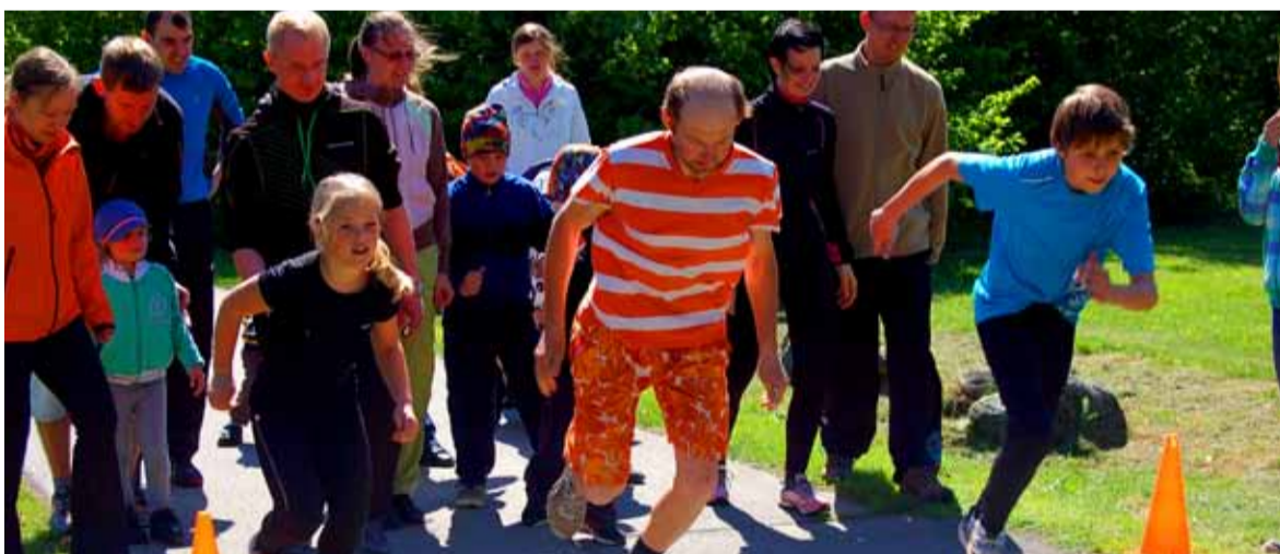
Miilijooksul oli osavõitjaid igas vanuses, kõigile oli distants jõukohane