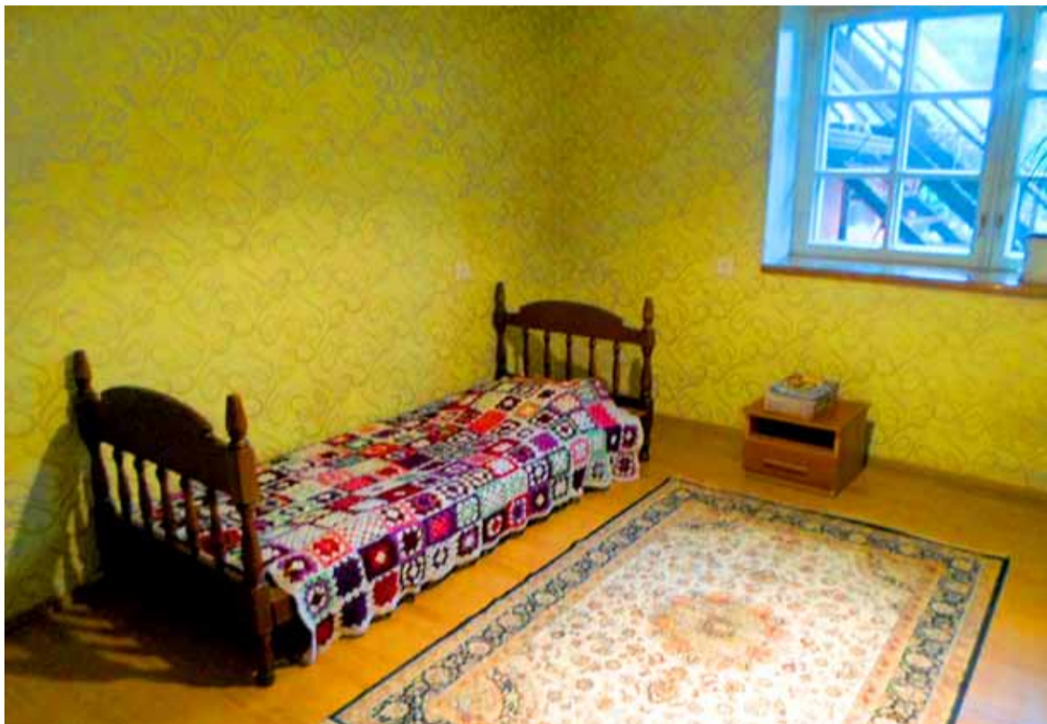
Iga eakas saab teenusel viibimise ajaks omale kindla voodikoha ja öökapi tualett-tarvete paigutamiseks.

Meie päevahoid asub Saue kaunis ja vaikses eramajade rajoonis. Iga eakas, kes meie teenust kasutab, saab teenusel viibimise ajaks omale kindla