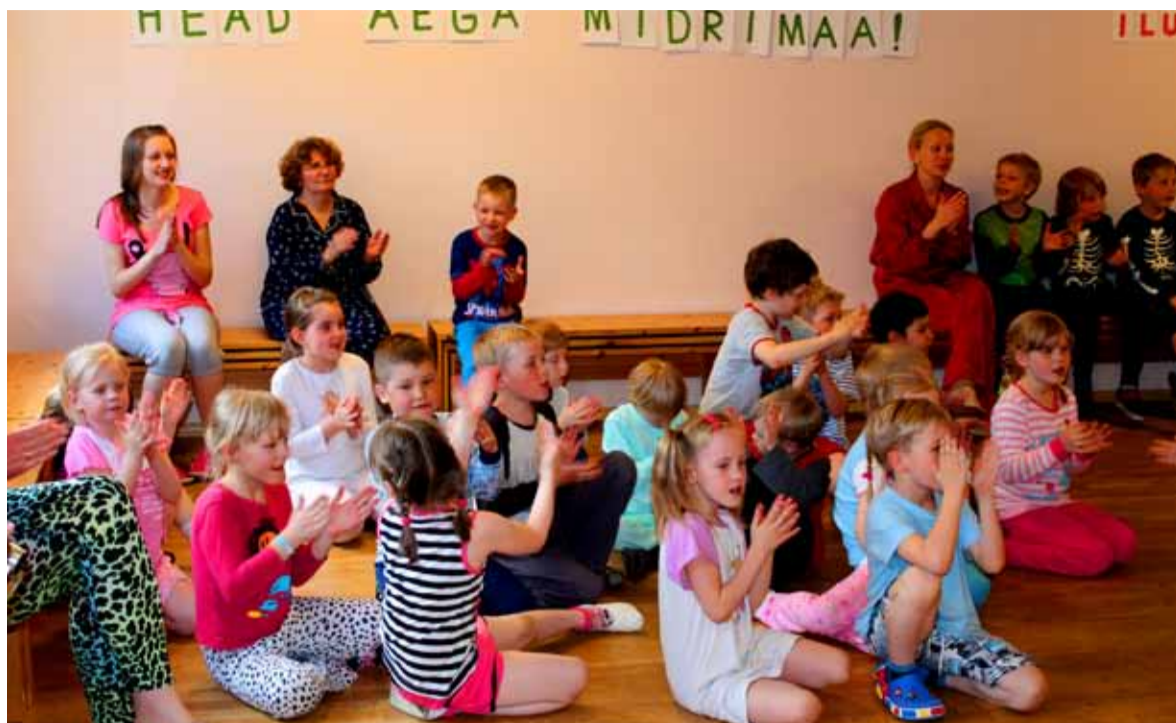
Traditsioonilisel pidžaamapeol jäävad kõikide koolirühmade lapsed ööseks lasteaeda.