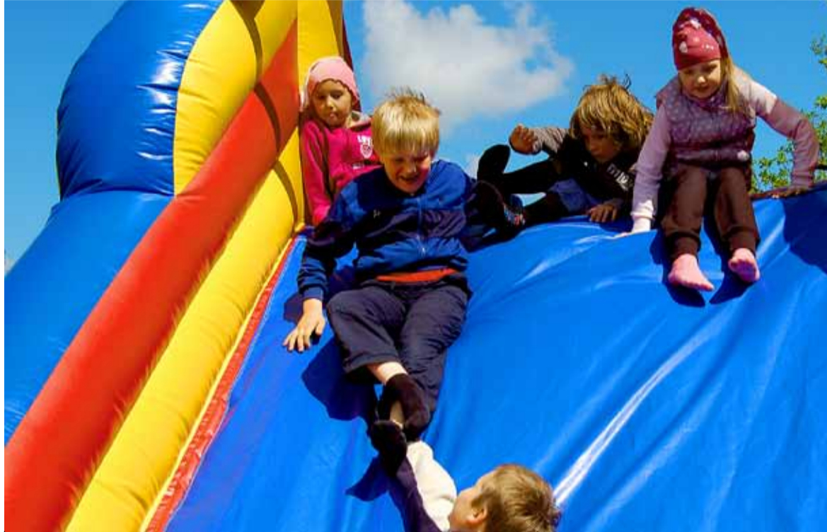
Lapsed ei väsinud terve päeva vältel batuudil turnimast.

Suurt huvi pakkus vibulaskmise võistlus klubi Sagittarius treeneri Zigmontas Strepaitis juhendamisel, kes jagas pro-