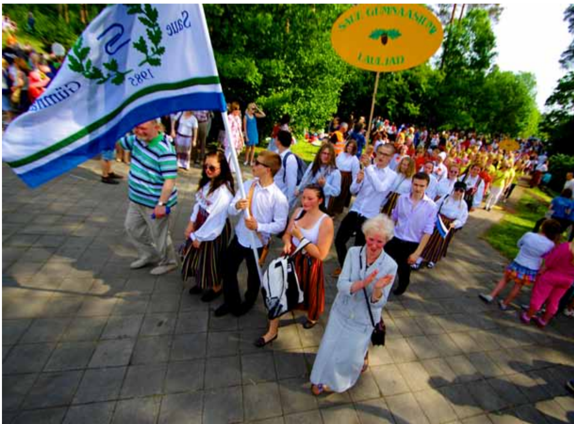
Sauelinnavalitsuse peo rongkäigus.