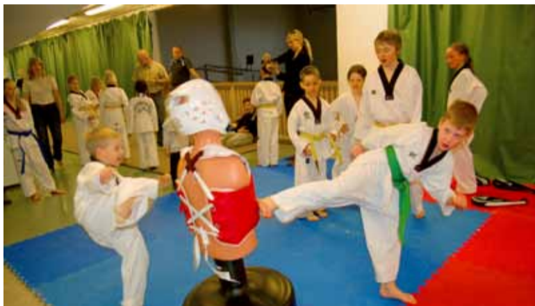
◇ Linna abil soetatud treeningvahendid on alati aktiivses kasutuses.