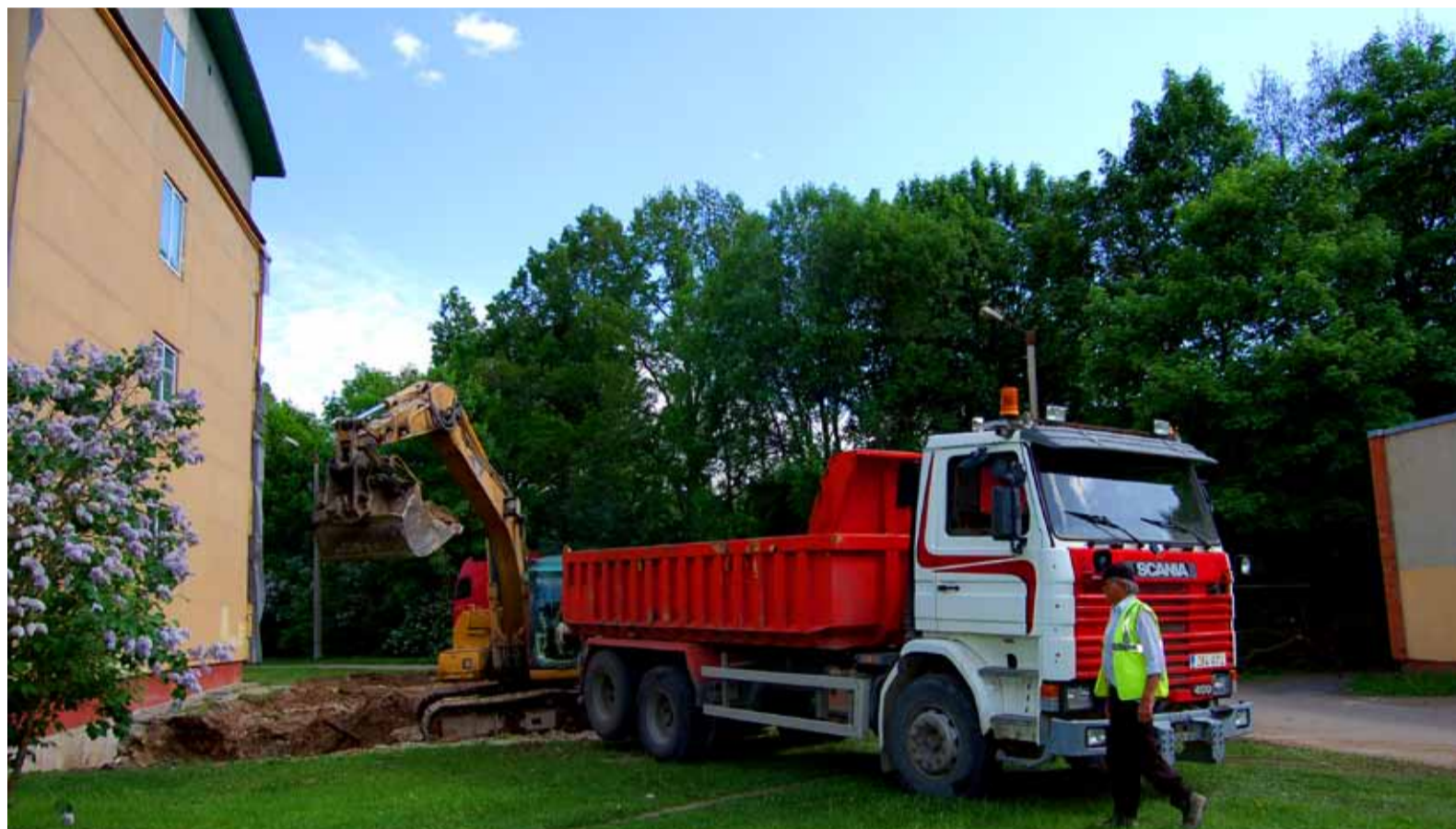
Haridus- ja Teadusministeeriumi sihtotstarbelise rahaeraldise, 40 000 eurot kooli tarbeks kulus kooli ruumiprobleemide lahendamiseks, sh algklassidele lisaruumide loomiseks. Ministeerium kiitis rahakasutuse heaks. Laienduste ehitus käib.