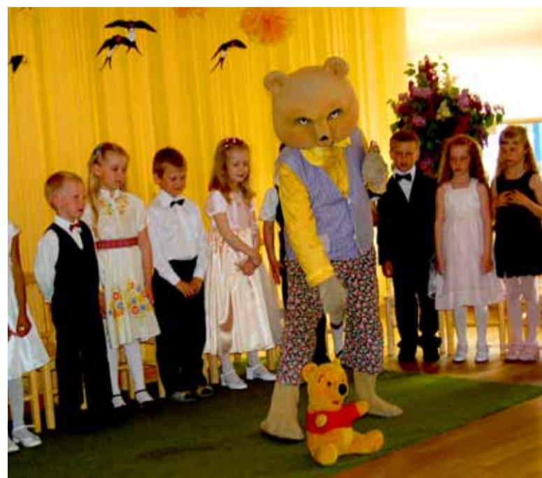
Lapsed saatis kooli telesaatest „Mõmmi ja aabits“ tuttav Mõmmibeebi.

Talguõhtul osales vähemalt kolmandik lastevanematest. Suur aitäh kõikidele, kellel