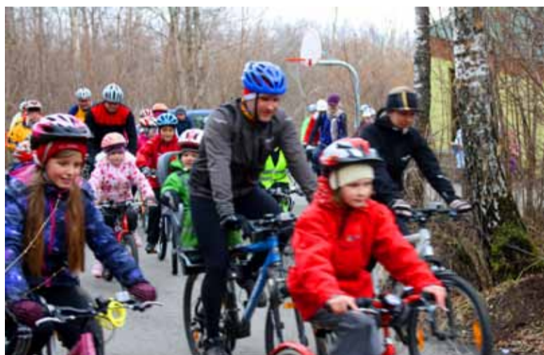
Sauelased nautisid rattasõitu kogu perega, oli nii noori kui eakamaid spordihuvilisi.

Saue Huvikeskuse sporditegevuse juht Terje Toomingas