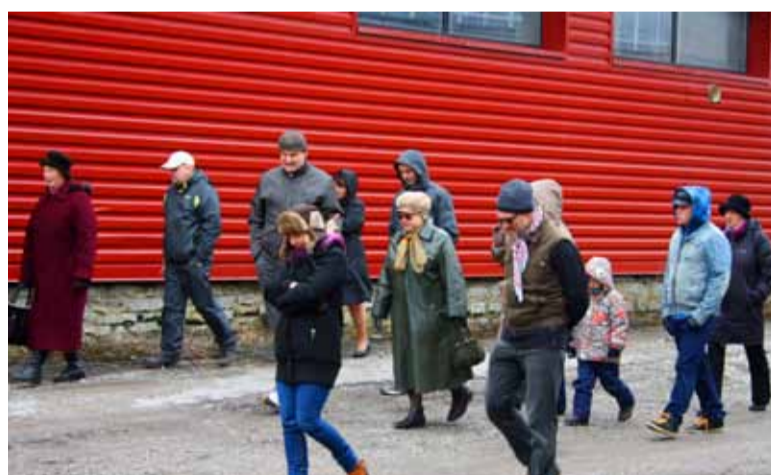
Jalutuskäigule Saue linna keskusealal kogunes 27. aprilli lõuna ajal ligi kakskümmend viis inimest

ilutsevad hetkel nõukogude ajast pärit laohooned, räämas, tühermaa ja hulgaliselt poriloiike, mille vahel lookleb koolilaste sissetallatud rada. Koduse väikelinna turvalisest keskusest on asi aga kaugel.