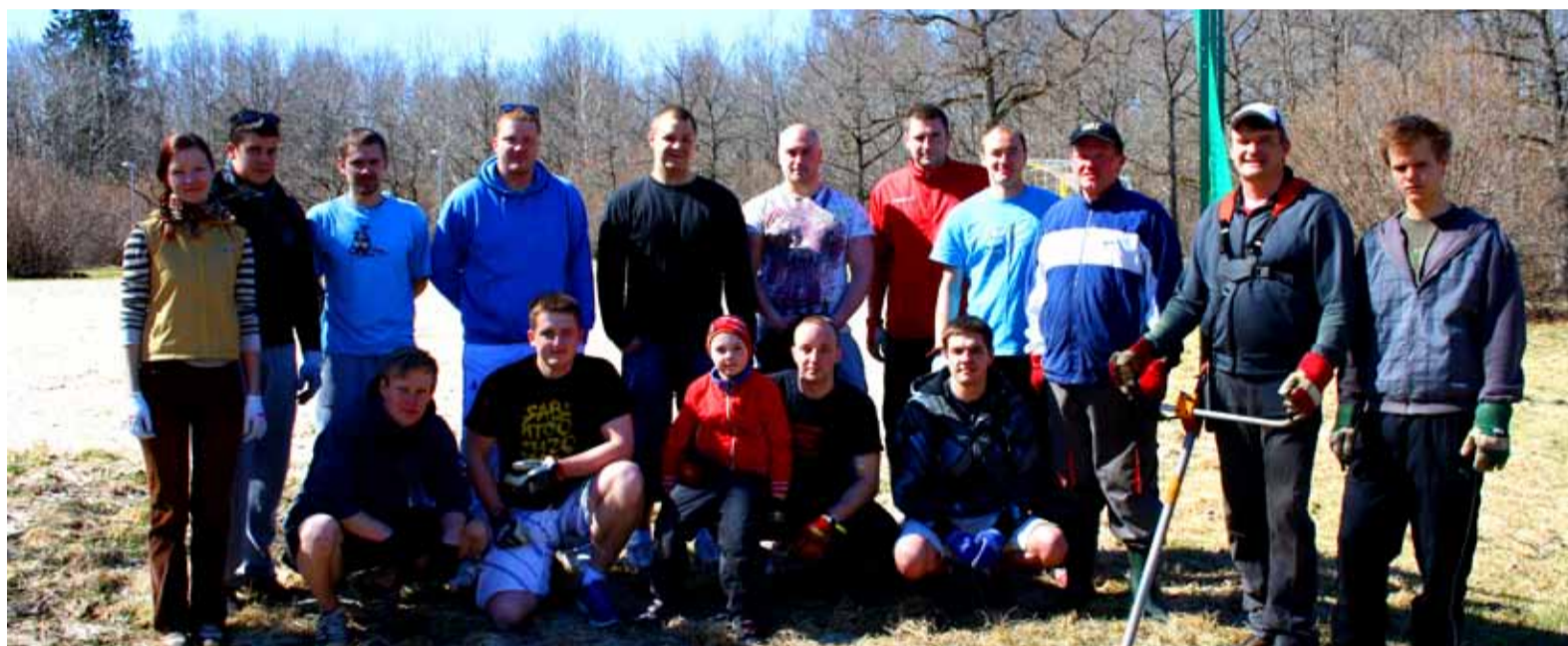
Talgulised jaanituleplatsil.