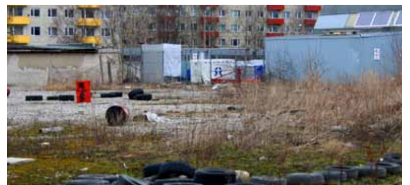
Ühel osal meie linna keskusealast ilutsevad hetkel nõukogude ajast pärit laohooned ja räämas, tühermaa.

korrastrast paljudel. Järgmiste tegevustena on planeerimisel keskuseala mõttetalgud, kus siis juba iga sihtgrupiga eraldi konkreetsemate plaanide juurde minnakse. Saue Linnavalitsus tänab kõiki kohaletulnuid arvukate ideede ja MTÜ-d Linnalabor oskusliku osalusplaneerimisprotsessi juhtimise eest. Kõigil huvilistel on võimalik Saue linna keskuseala visioonilooma projekti käekäiku jälgida sotsiaalmeedia, linna kodulehe ja Saue Sõna vahendusel.