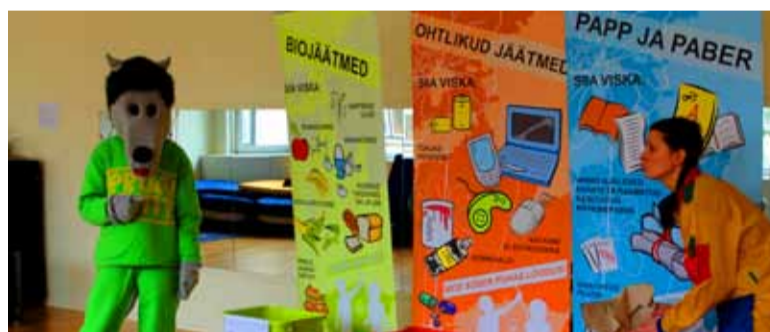
Prügihunt koos sõbra Riinaga õpetas Midrimaa lastele prügi sorteerimist.

„Lapsed olid õhinal valmis oma uusi teadmisi vanematega jagama,“ toob õppealajuhataja välja Prügihundi laiema hariva aspekti: ega kana siis munast kehvem taha olla.