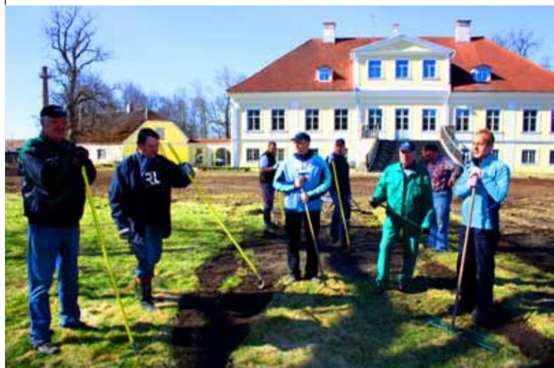
LC Saue korrastas mõisa ümbrust.