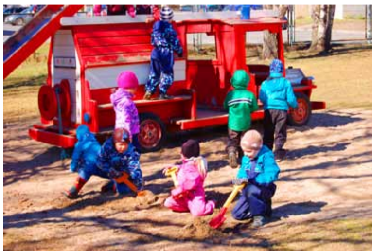
Kui muidu prügi ei leia, siis kaevame - äkki tuleb midagi koristamisväärtset välja.