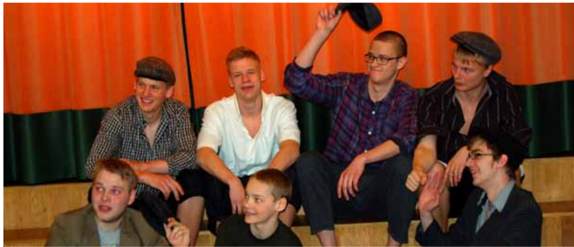
◇ Saue Gümnaasiumi näitetrupp tõi lavale katkendi „Seitsmest vennast“.