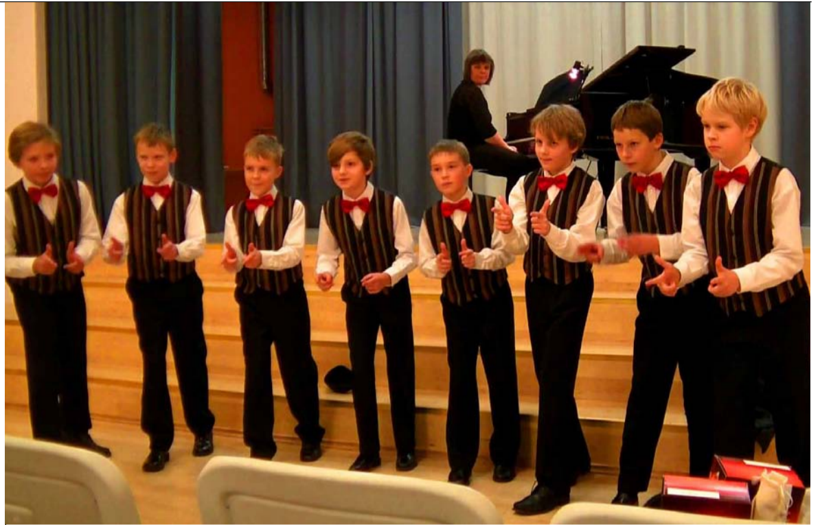
◇ Poistekoori poisid esinesid tundud headuses ja nii 4.-5. klasside arvestuses esikoht endale napsatigi