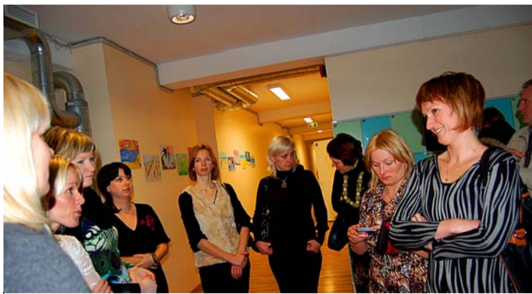
Läti sõprusomavalitsuse Inčukalnsi delegatsioon tutvus pool päeva meie asutuste tegevusega.

Saue muusikakooli sõpruskool oli Vangaži Kunstide Kool.