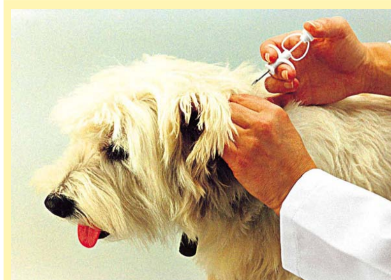
◆ Kiibistamise protseduur on loomale valutult.

Lemmiklooma kiibistamine on vastutustundlik tegu. Oma lemmikloomale saab lasta kiibi panna ka Saue Loomakliinikus, olete lahkesti oodatud.