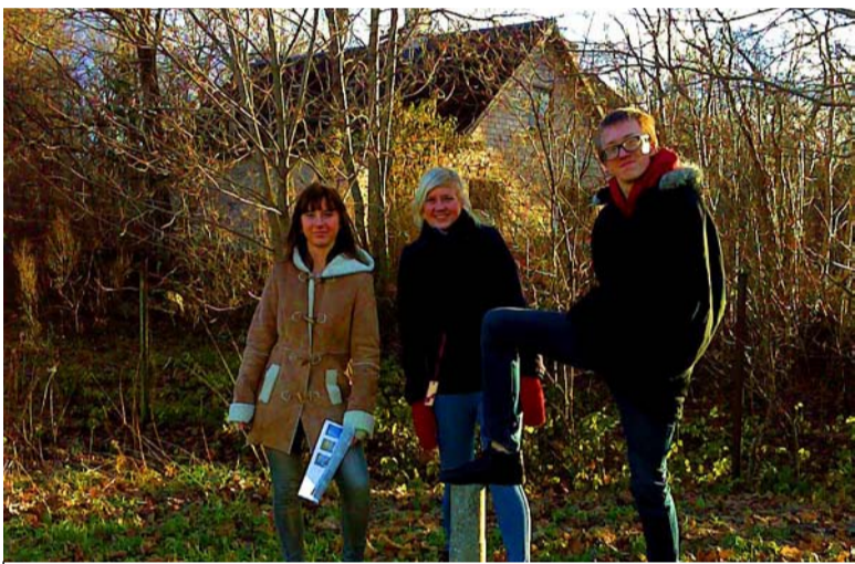
◇ GPS- orienteerumise võitjaks osutus põhikooli osas 9. c klass.