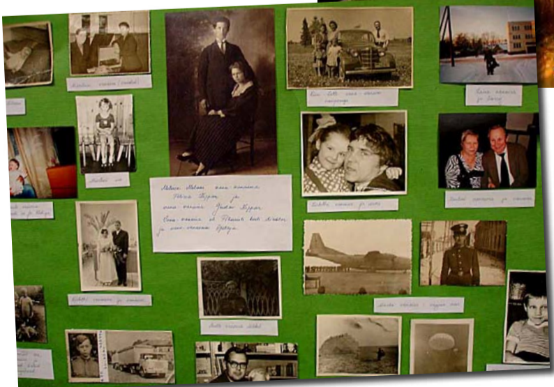
Klassides olid fotonäitused vanaisadest ja vanast ajast.

Elu on küll kole kiire, aga isa ja ema tähelepanu on igale lapsele kahtlemata kallim kui mistahes tehniline imevidin.