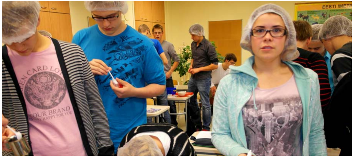
◇ Töötoas said õpilased ise erinevate retseptide järgi kreeme ja salve valmistada

Teisipäeval GPS-orienteerumisel „Fotojaht“ 7.-12. klassidele osalesid külalistenä Saku gümnaasiumi abiturien-