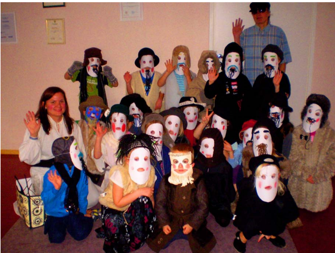
8. ja 9.novembril jooksid lasteaias mardisandid. Laulsime mardilaulu ja jagasime häid soovide.

Loodusteaduslikud võistlused ja konkursid ei lõpe ainenädalaga. Järgmine suur väljakutse on 23.-25. novembril TTÜ Spordihoones toimuv ROBOTEX, kus osalevad nii põhikooli kui ka gümnaasiumi õpilased. Soovime neile edu!