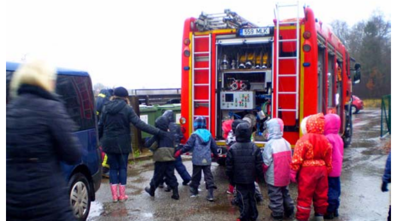
6. novembril toimus Saue lasteaias Midrimaa evakuatsiooniõppus. Kõik rühmad evakueerusid korrektselt ning päästemeetri vaatlejad kiitsid laste ja töötajate rahulikku ning asjalikku toimetamist.