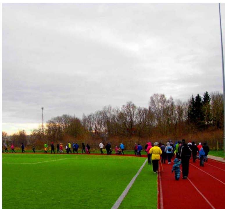
Isadepäeva jooksust võttis tunni jooksul osa üle 100 spordisõbra.

Suur tänu osavõtjatele ja kohtumiseni juba 2. detsembril sarja neljandal etapil Saue ujulas.