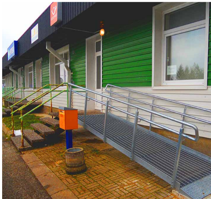
◇ Kaldtee ja laiem uks võimaldab liikumispuudega inimestel postiasutust külastada ja teenusest osa saada.

Konkursi tingimused leiate linna kodulehelt www.saue.ee uudiste alt. Lisainfo telefonil 6790175, Sirje Piirsoo.