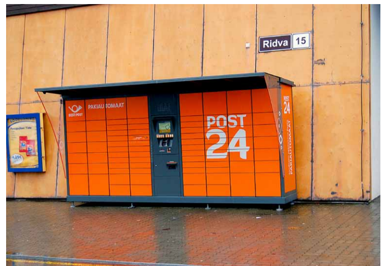
Eesti Post paigaldas Saue Kaubakeskuse juurde välitingimustes mõeldud ja ööpäevaringselt kasutatava pakiautomaadi Post 24.