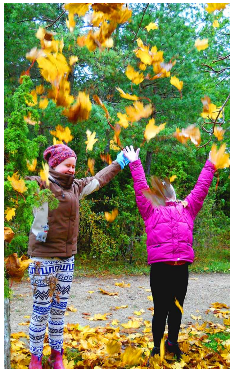
Noortekeskus pöörab sügisese laagris suurt tähelepanu loodusele meie ümber.