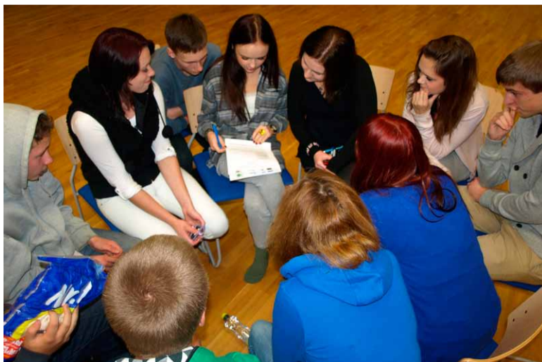
Halloweeni projektiööil sündis noortekeskuses viis noortelalgatuslikku projektiideed.

Pärast ajude ragistamist algas umbes südaöö paiku õudusfilmide maraton, mis kestis varajaste hommikutundideni. Vapramad pidasid vastu kella 10ni hommikul! Noorte sõnul võiks nii tegusaid ja lõbusaid üritusi korraldada veelgi!