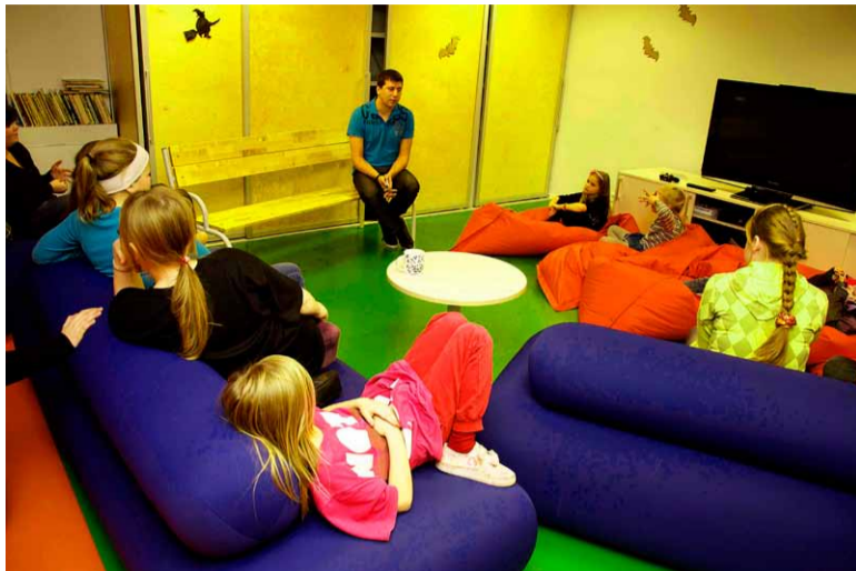
Tööelu tutvustas fotograaf Ardo Kaljuvee.

Saue Noortekeskus on programmist osa saanud kõigil kolmel aastal. Esimese aasta tasuta ring oli kunstiring Arteesia, noortelalgatuste käigus soetati noortekeskusele erinevaid vahendeid (trummid, muusikariistad, batuudid, tri-