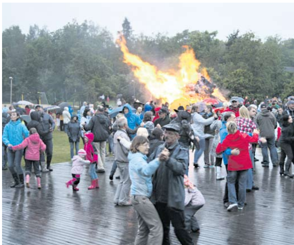
Saelane trotsis vihma ja külma ning lõi jaanitule paistel Kihnu Poiste tempokate lugude saatel hoogsalt tantsu.