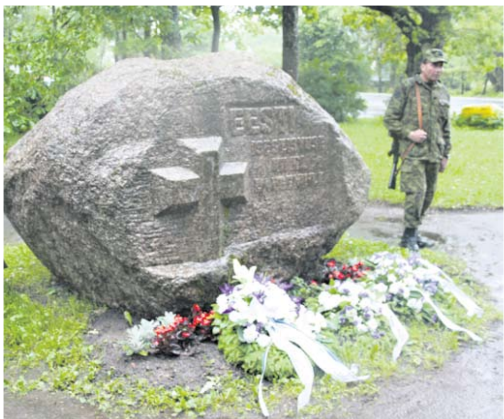
Võidupühal meenutasid pärjad mälestuskivi jalamil ja jumalateenistus Saue vabakirikus Eesti vabaduse eest langenuid. Mälestusüritusel osalesid linna esindajad ja Kaitseliidu Harju maleva Saue kompanii.