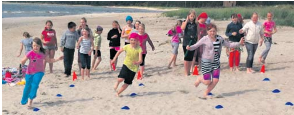
Teisipäev kuulus peamiselt sportlikele mängudele, millest kõik lapsed õhinaga osalesid.

Järgmine päev, teisipäev kuulus peamiselt sportlikele mängudele, millest kõik lapsed õhinaga osalesid. Kolmapäeval külastati Amandus Adamsoni ateljeemuuseumi Paldiskis ja osaleti haridusprogrammis „Amandus Adamsoni radadel”. See väike muuseum on toredasti restaureeritud ja ajakohaselt sisustatud. Ateljeetoas oli arvutiekraanilt võimalik vaadata kõiki Adamsoni skulptuure