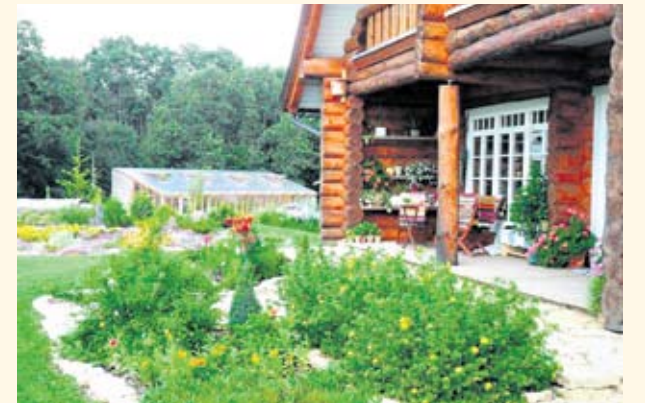
Kodukaunistamise Harjumaal Kogu tunnistas Sadevälja talu tänava Harjumaal kaunimaks maakoduks.

Puukool Haideaed. Asub Kehtna vallas Kaereperes. Võimalus osta istikuid.