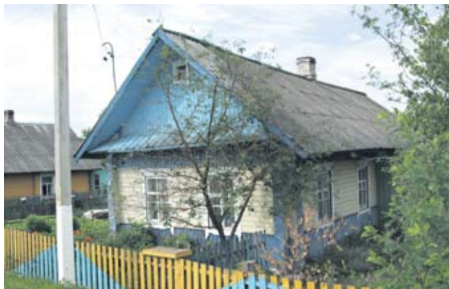
Teeäärased külad olid ilusad oma värviliste majade ja aedadega.

Järgmisel hommikul oli juba pikem jalutuskäik Vilniuses. Külastasime katedraali, ülikooli kirikut ja imetlesime Anna kiriku imelisi torne. Sõitsime üles Gediminas torni, et sealt ülevalt linna vaadata. Edasi viis tee Traikaisse, kus veetsime meeldiva pärastlõuna, käisime linnuses, lõunatasime karaiimi restoranis ja päeva naelaks kujunes laevasõit Traikaid ümbritsevatel järvedel. Õhtuks jõudisime kuurortlinna Druskininkaisse. Seekord õõbisime huvitava arhitektuuriga nüüdisaegses hotellis Pušynas. Pärast õhtusööki oli võimalus tutvuda lin-