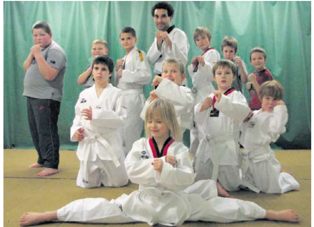
Väikesed tiigrid ja draakonid Sauel treeningut alustamas.

Lapsed ja lapsevanemad treeningutest ja treenerist „Kui andsin lapse trenni, ei teadnud taekwondost eriti