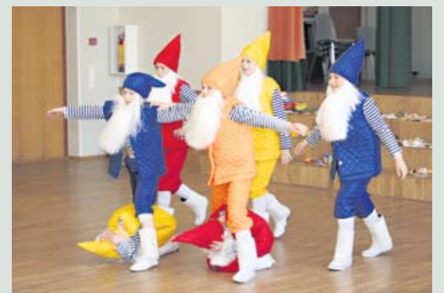
Vikerkaare nooremad tantsisid kunstiringide lõpetamisel Põialpoiste tantsu.