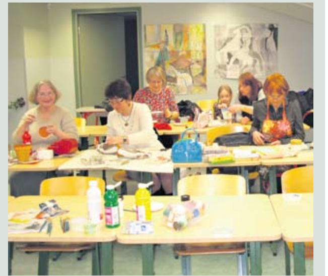
Tekstiili- ja taaskasutuse kursus tööhoos.