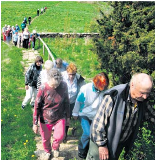
Vapper ja kartmatu reisiseltskond tõuseb pikas rivis Muuksi linnamäele.

Sellel reisil seiklustest puudust ei tulnud! Tagantjärele võiks reisi isegi seiklus-