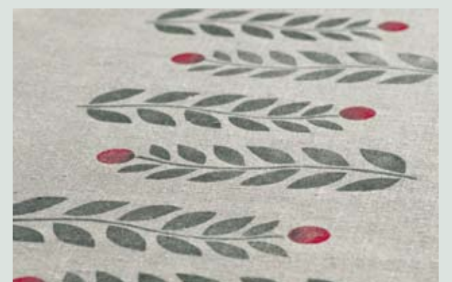
Pakutrükk, disain ja teostus Tiina Sillar.