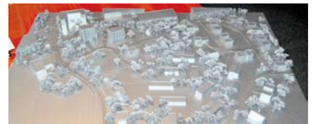
Detailplaneeringu maketi ülemine serv on paralleelne Tule tänavaga.

Detailplaneering on algatatud Saue Linnavalitsuse 14.02.2012 korraldusega nr 58.