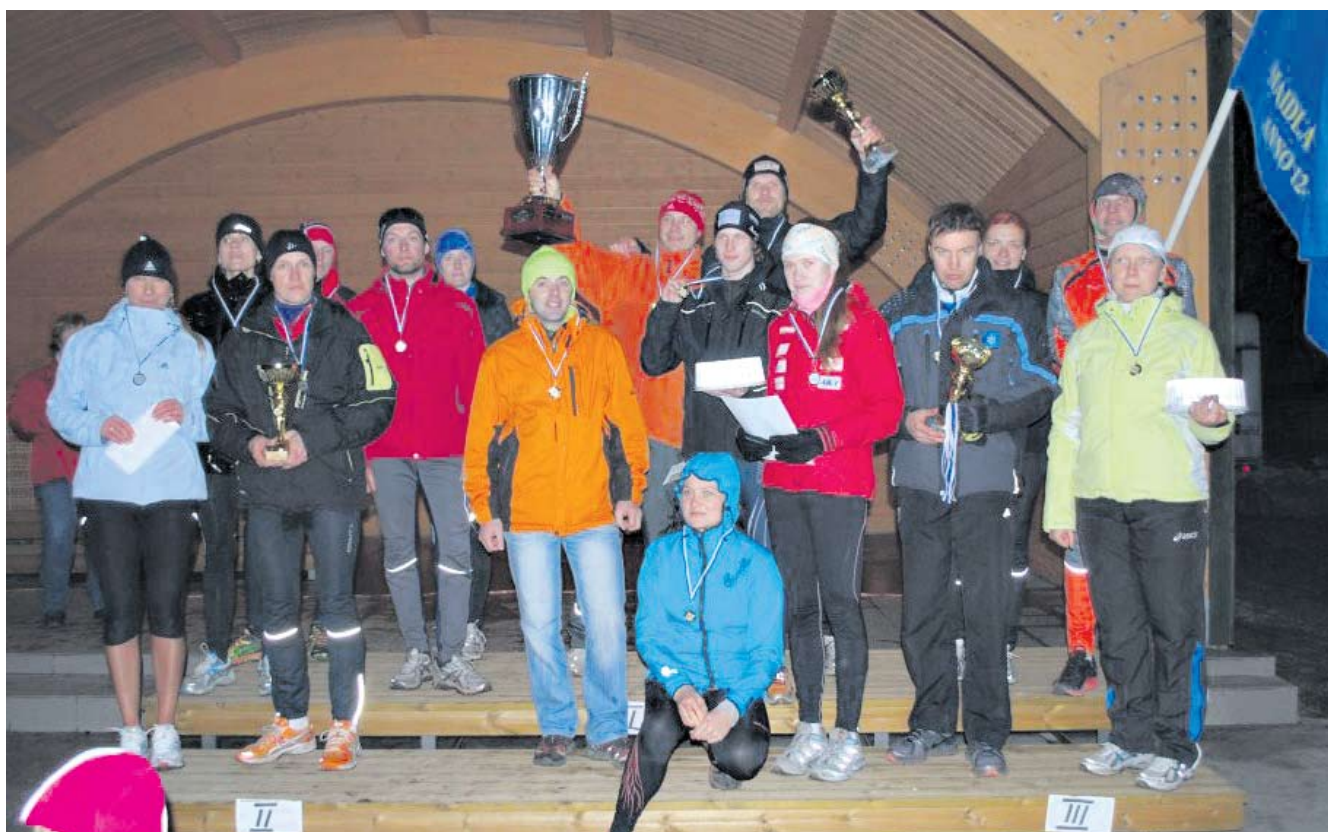
Linna võistkond (pildil vasakul) tuli Saue valla jüriöö jooksul teiseks.

Saue sportlased saavutasid jüriöö jooksudel esimese ja teise koha.