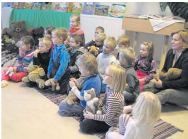
Lasteaiälapsed juttu kuulamas.