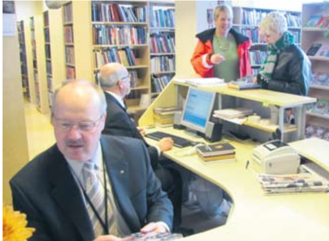
Linnapea ja abilinnapea tööhoos.