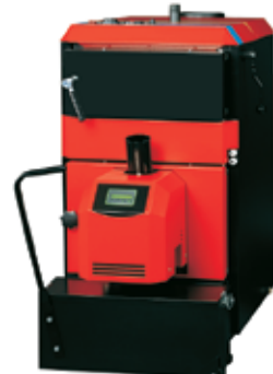
Pelleti katlakompl. Attack Automatic 8-30kw 4090,- € 63994,59 EEK (Hind sisaldab 20% KM)