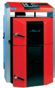
Puugaasikatel Attack 35DP Profi 14-35kw 1650,- € 25816,89 EEK (Hind sisaldab 20% KM)