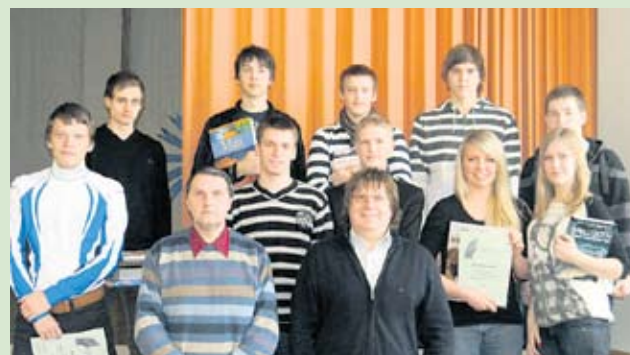
Harjumaa gümnaasiuminoored võtsid üksteiselt mõõtu mälumängus „Mõttemeister“.