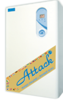
Elektrikatel Attack Electric Easy8 2,5-8kw 424,- € 6634,15 EEK (Hind sisaldab 20% KM)