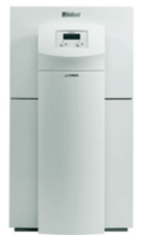
Maasoojuspump Vaillant geoTHERM vws 101/2 4190,- € 65559,25 EEK (Hind sisaldab 20% KM)

Küttemaailm OÜ - Kadaka tee 131, Tallinn - Tel. 6 799 361 - www.kyttemaailm.ee