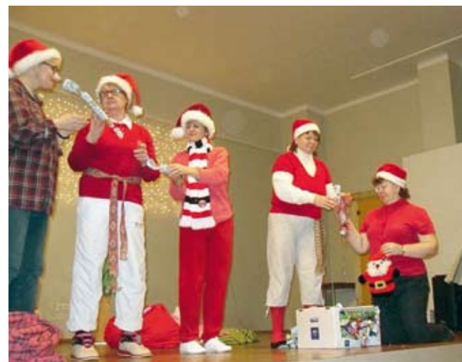
„Tühjade susside saladus”