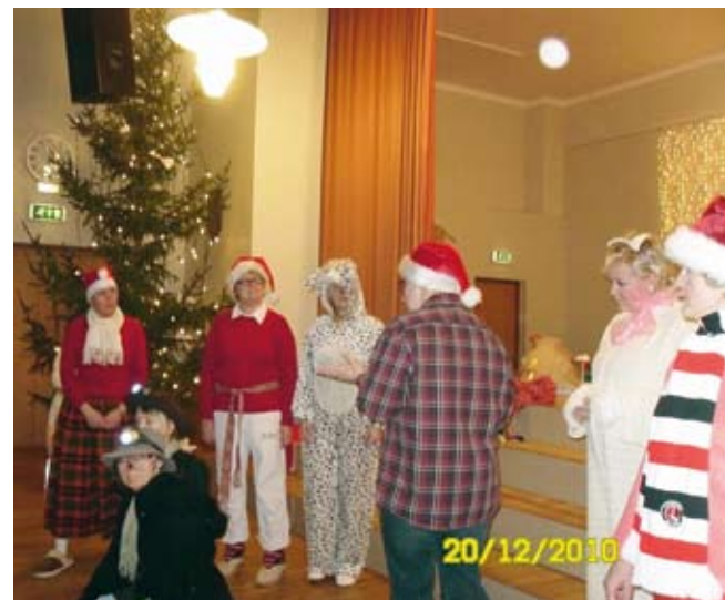
„Tühjade susside saladus”