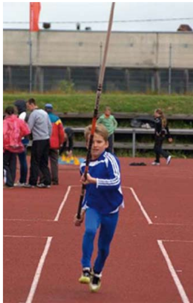
Rainar teivast hüpamas.

TV 10 OS Harjumaa etappide edukamad olid Emil Ojaperv, kes oli esimene nii 60 m kui ka 60 m tõkkejooksus;