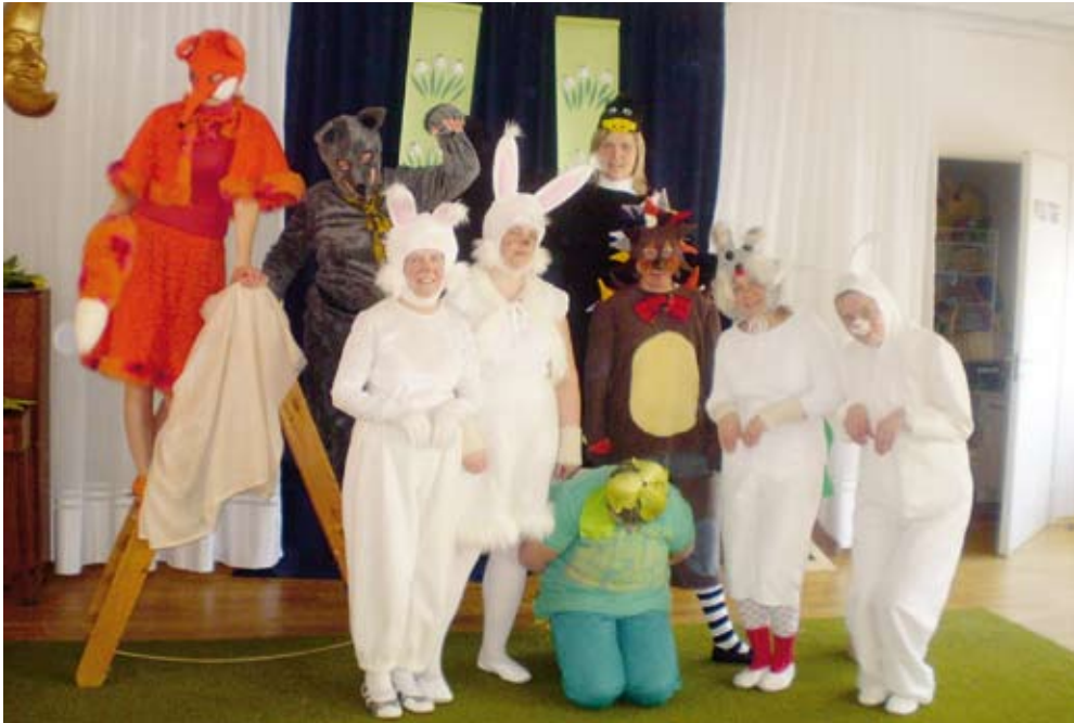
Midrimaa teatritrupp Memme Musi esitamas.