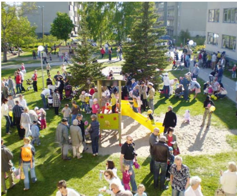
Heategevuslik kevadpidu Saue lasteaia Midrimaa.

Soovin kõigile sauelastele rahulikku Jõuluaga ja Head vana aasta lõppu! 🍀