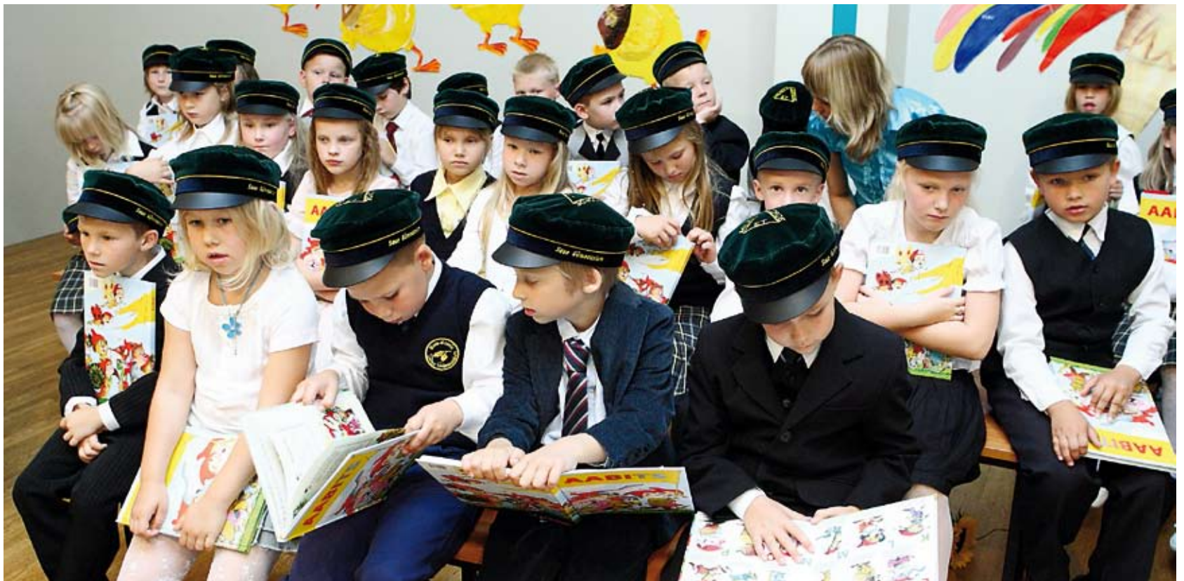
Esimene koolipäev: värsked koolilütsid asusid innukalt uhiuusi aabitsaid uurima.

Saue Gümnaasiumi riigieksamite tase on olnud viimastel aastatel ligilähedane Eesti keskmisega või sellest kõrgem. Gümnaasiumilõpetajad on valinud kohustusliku eesti keele eksami kõrval sagedamini inglise keele, mate-