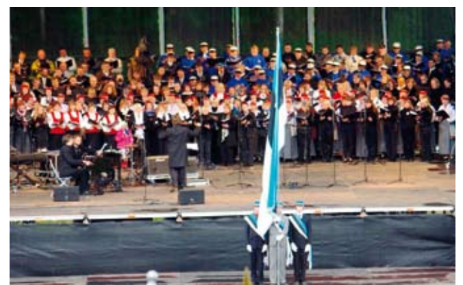
Hetki Eesti lipu sünnipäeva tähistamiselt Saue ja Otepääl 4. ja 5. juunil 2009.