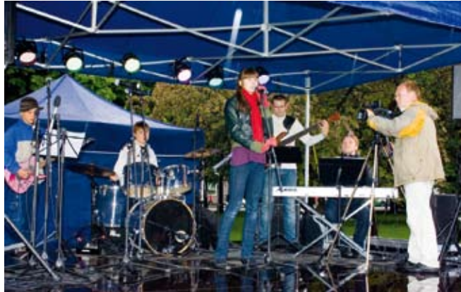
Saue Muusikakooli jazzbänd esinemas 5. juunil Tammsaare pargis Tallinnas.

Eriliseks auks ja üllatuseks oli Riia All Stars, Läti parimate muusikute esinemine Sauel restoranis Loft Lounge, www.