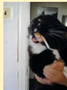
Ka kassid peavad hambaid pesema?