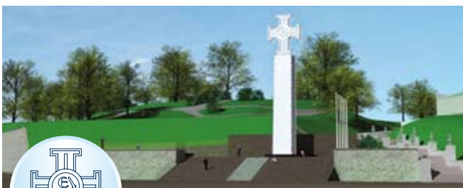
VABADUSSÕJA VÕIDUSAMBA AVATSEREMOONIA 22. juunil 2009 Vabaduse platsil