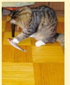
Kiisu kalaga mängimas.