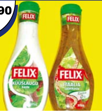
Felix salatikastmed (Itaalia, küüslaugu) 375g