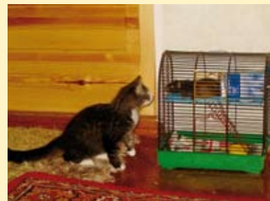
Kass rotiga tutvumas.