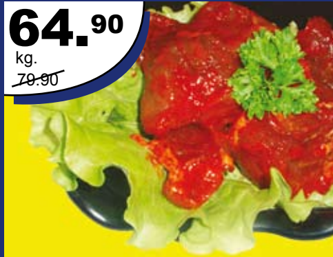
Punane šašlõkk (Rakvere LT)