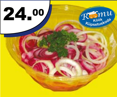
Marineeritud sibul kg