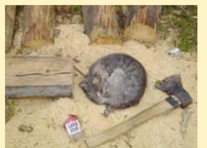
Kassi ei sega miski!