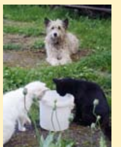
Kõik on kontrolli all!