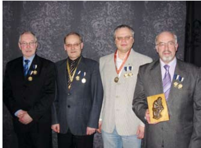
Saue linna esindusvõistkond "Tammeark".

Üldkoosolekul kinnitati klubi 2008. majandusaasta aruanne ning 2009. aasta majandustegevuse aastakava. Kinnitati ka käesoleva hooaja ürituste plaan, milles nähakse